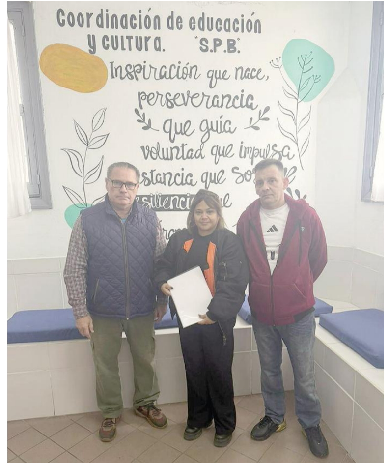
Recepción de las Máximas del general San Martín.

impulsa una colecta de alimentos. Las personas que deseen colaborar pueden hacerlo con verduras, fideos, arroz, puré de tomate, yerba, azúcar, condimentos, galletitas, jugos, carne o pollo. Las donaciones se reciben esta semana en Olleros 675, a partir de las 9:00. Para consultas, el número de contacto es 336 4324067.