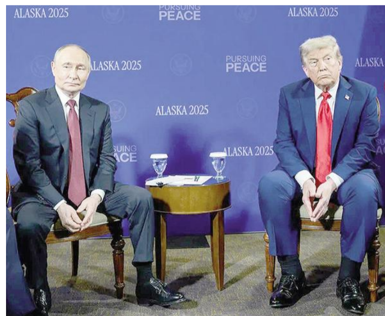
Vladimir Putin y Donald Trump ahora dialogaron por teléfono.

que tuvo un tono franco y profesional, según declaró Ushakov a los periodistas el miércoles.