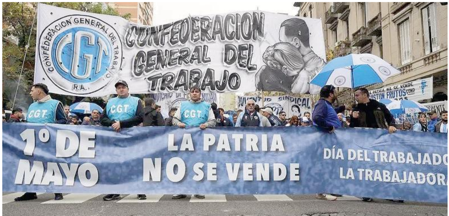
La marcha de la CGT será a Plaza de Mayo.