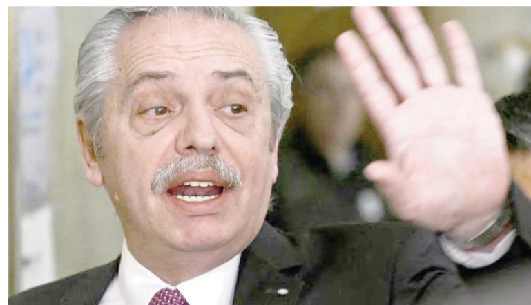
Casación anuló el procesamiento de Alberto Fernández en el caso Seguros.