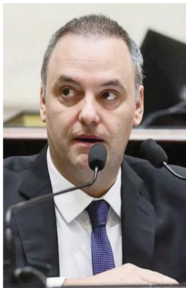
Manuel Adorni, en la sesión informativa de la Cámara de Diputados.

En cuanto a sus bienes, Adorni aclaró que aún tiene plazo para presentar su última declaración jurada y negó haber ocultado información en las anteriores. Especificó que los