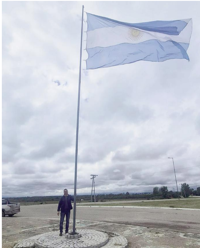
La bandera, confeccionada en la UP 3, flamea en la localidad de Renca.

Bajo el proyecto «Donamos lo que somos, desde Lima (Perú) hasta la Antártida», la Asociación Cultural Sanmartiniana «Pago de los Arroyos», con sede en San Nicolás de los Arroyos, entregó enseñanzas patrias en la localidad de Renca. Este histórico pueblo de la provincia de San Luis es considerado uno de los más antiguos de la zona;