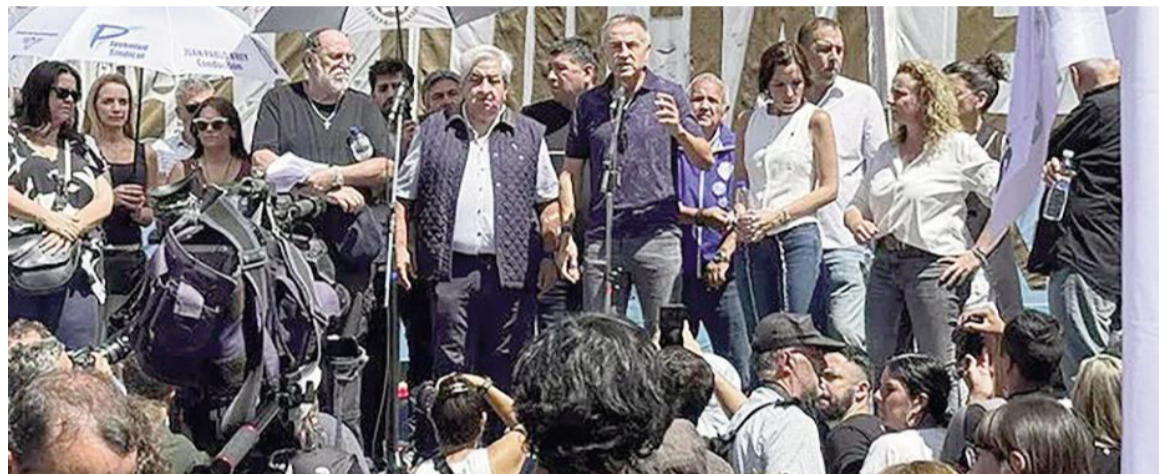
La CGT marchará a Plaza de Mayo por el Día del Trabajador y no descarta nuevas medidas de fuerza.

Sola sostuvo que el malestar social no responde únicamente a la caída