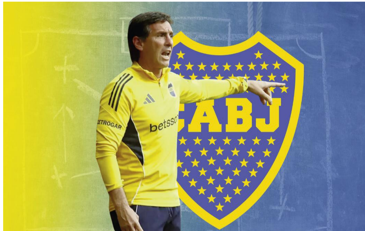
El Xeneize buscará sumar en Florencio Varela.