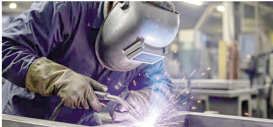
El Indec difundió el Estimador Mensual de la Actividad Económica.

Por su parte, siete sectores de actividad registraron caídas en la com-