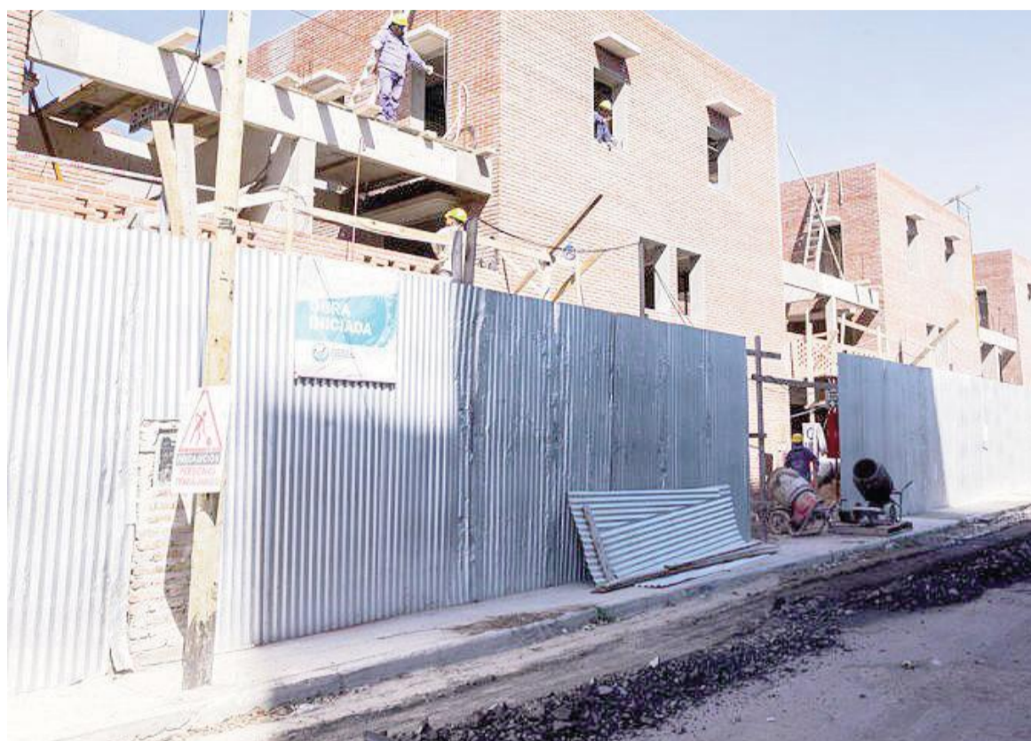
Se aprobó un nuevo régimen para adjudicar viviendas y regularizar la propiedad en villas y asentamientos.

Uno de los puntos más relevantes es que el valor de las vi-