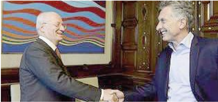
Paolo Rocca y Mauricio Macri.

El empresario Paolo Rocca participó de una reunión con el ex presidente Mauricio Macri en la que le planteó la necesidad de que el PRO tenga un rol activo en las elecciones de 2027, en un contexto de tensiones políticas y reconfiguración del escenario opositor.