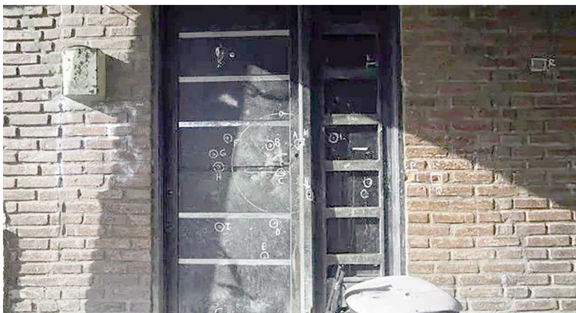
La última de las balaceras ocurrió este miércoles en Malvón al 1700.