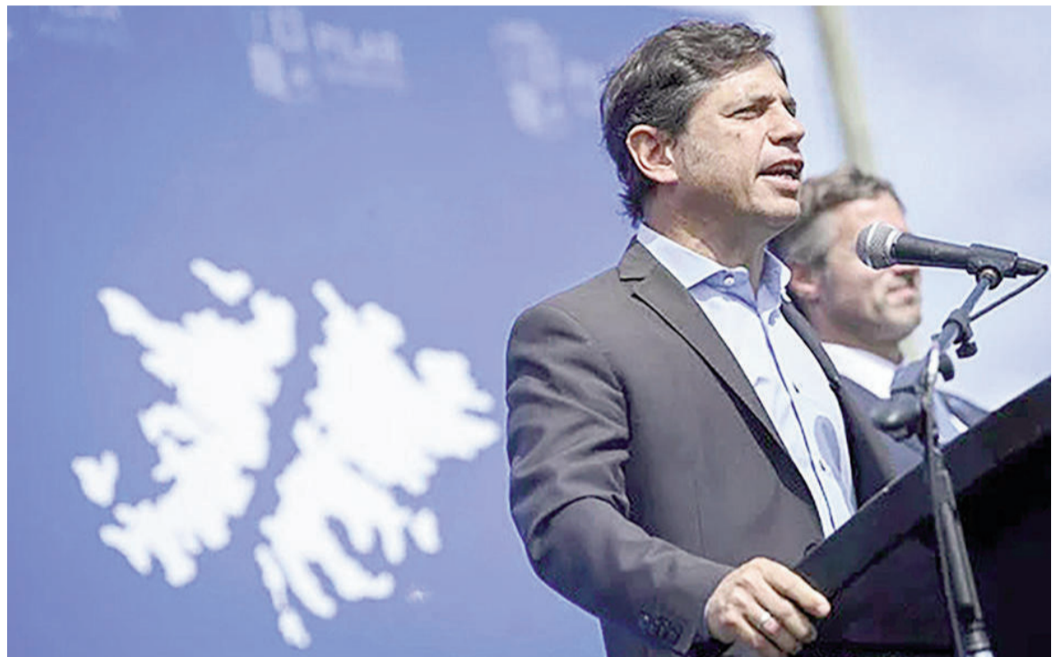
Axel Kicillof, gobernador de la provincia de Buenos Aires.

Además de su significado protocolar y como conmemoración, el viaje del bonaerense es parte de las movidas que viene haciendo en las últimas semanas para extender su influencia en el resto del país. A través de su Movimiento Derecho al Futuro (MDF), Kicillof busca instalarse como una alternativa nacional de cara a las elecciones de 2027.