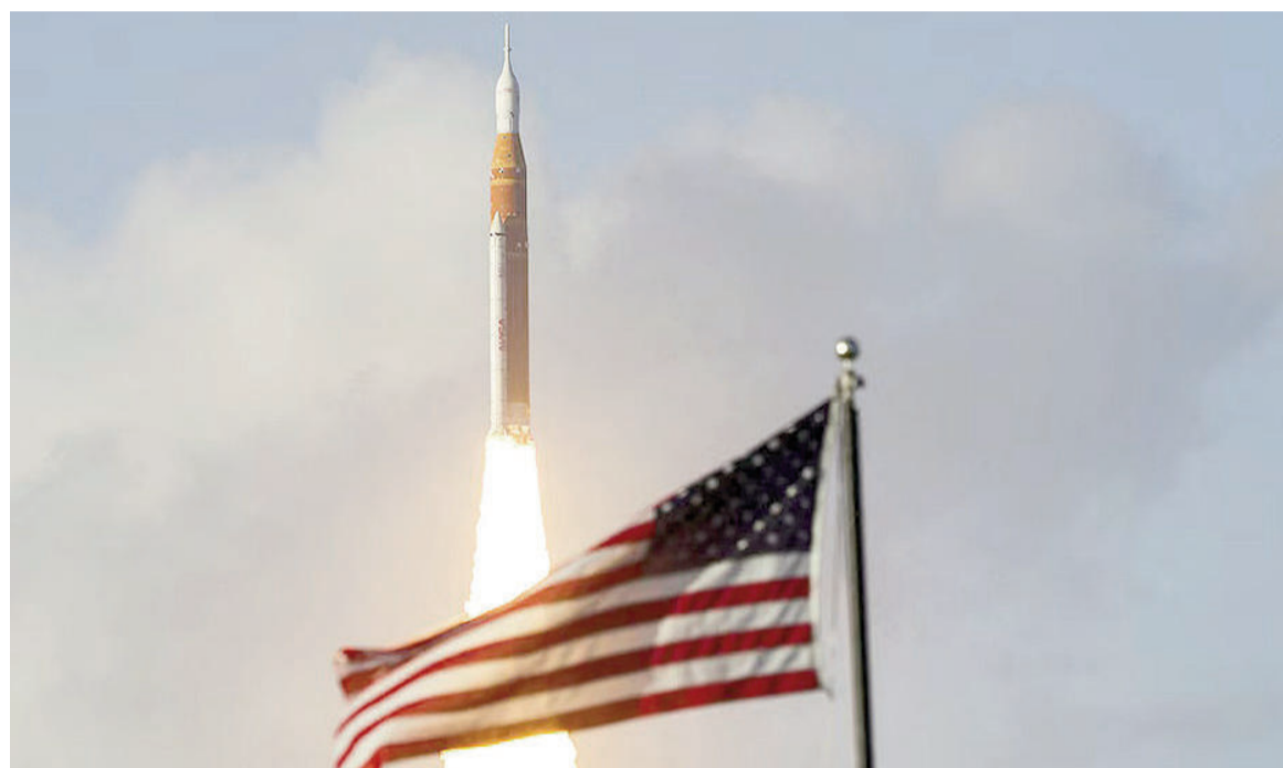
El poderoso cohete SLS de la NASA despega desde el Centro Espacial Kennedy.

La misión marca el regreso de vuelos tripulados al entorno lunar desde 1972. Cuatro astronautas viajarán durante 10 días en una prueba clave para futuras misiones.