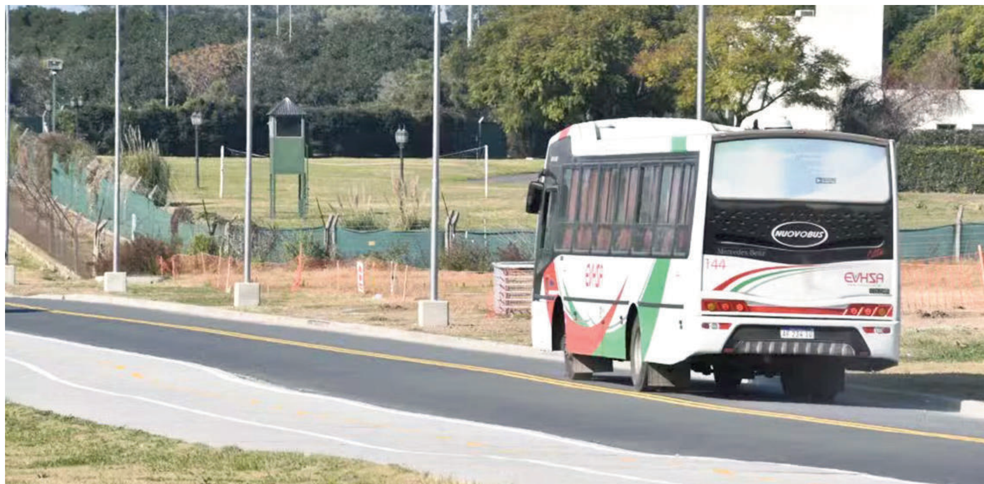
Desde este miércoles, el pasaje local que costaba en San Nicolás $1648 pasó a tener un valor de $1697.

Desde este miércoles rige en el transporte público de San Nicolás un nuevo cuadro tarifario, con un aumento aplicado del orden del 3% que llevó el boleto de $1648 a $1697. La suba anual acumulada es del 36,25% respecto de los $1246 que se pagaban a fines de marzo de 2025. La variación está por encima de la del IPC, que apenas supera el 31%.