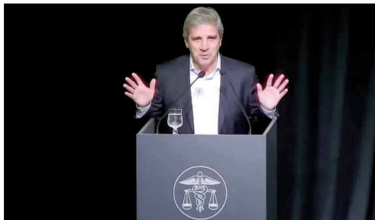
Luis Caputo, ministro de Economía.

También manifestó que “a medida que la cosa empieza a ir mejor, la