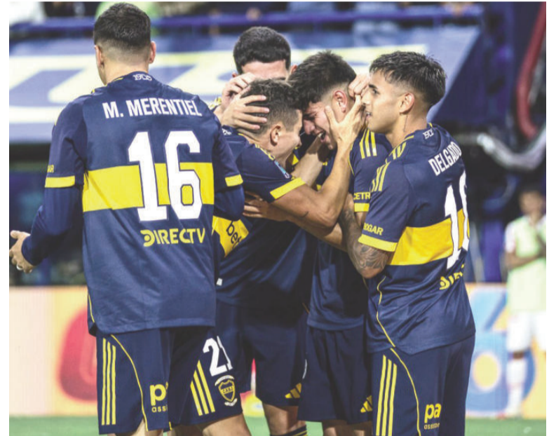
Boca quiere acercarse a la punta de la Zona A.