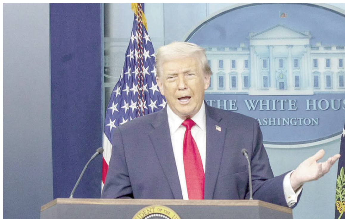
Trump recrudesció su postura contra el régimen persa.

El mandatario estadounidense dio un ultimátum de 48 horas para la apertura del estrecho de Ormuz, bajo amenaza de un ataque masivo.