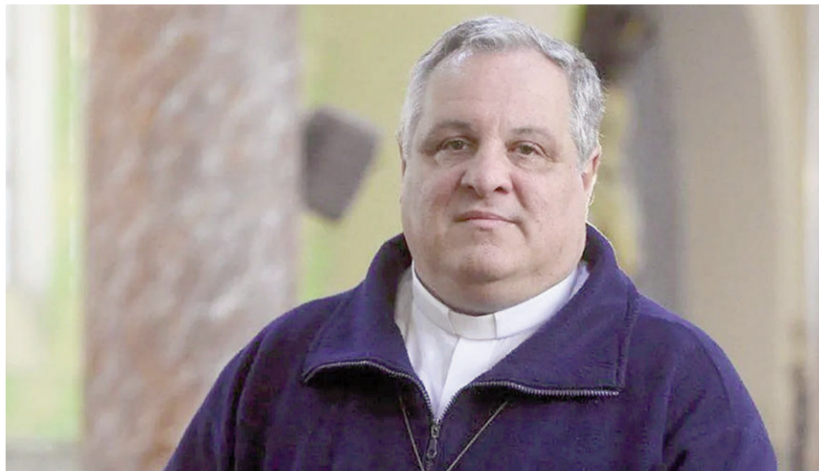
Marcelo Colombo, presidente de la Conferencia Episcopal Argentina.

En ese punto, detalló que varias instituciones dependen de esos re-