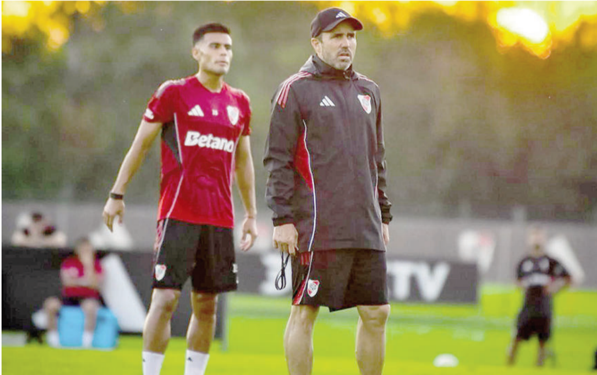
El Millonario quiere hacerse fuerte en el estadio Monumental. WEB

El equipo de Núñez recibirá al Pirata hoy, desde las 18.00, con la ambición de cosechar la cuarta victoria al hilo que le permita seguir escalando en las posiciones, en el marco de la Zona B.