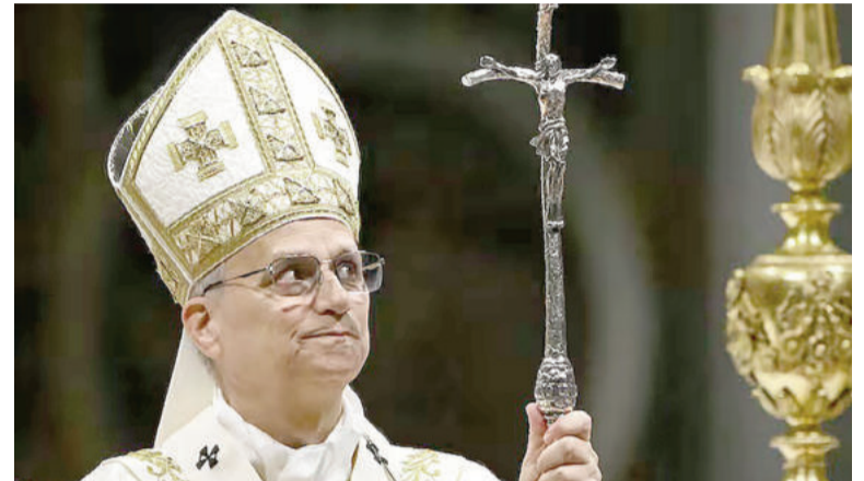
El papa León XIV presidió la Vigilia de Pascua en la Basílica de San Pedro.

En una ceremonia marcada por bellísimos coros de la Capilla Sixtina, en su sermón, que pronunció en italiano, con voz clara, ante unas 4000 personas que llenaban la iglesia, León XIV explicó el significado de la Vigilia. “Queridos hermanos, esta es una Vigilia llena de luz, la más antigua de la tradición cristiana, llamada ‘madre de todas las vigiliass’. En ella revivimos el memorial de la victoria del Señor de la vida sobre la muerte y el infierno. Lo hacemos después de haber recorrido, en los últimos días, como en una única gran celebración, los misterios de la Pasión