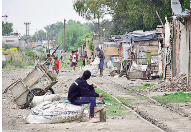
La UCA puso en duda los datos de pobreza difundidos por el Indec.

también está desactualizado, con ponderadores del 2004 y no con los actuales”, sostuvo. Según explicó, esta combinación genera resultados que muestran una reduc-