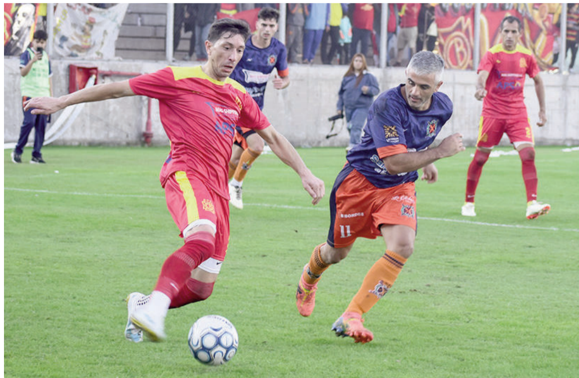
El año pasado, Regatas ganó los dos clásicos en el Estadio San Nicolás.