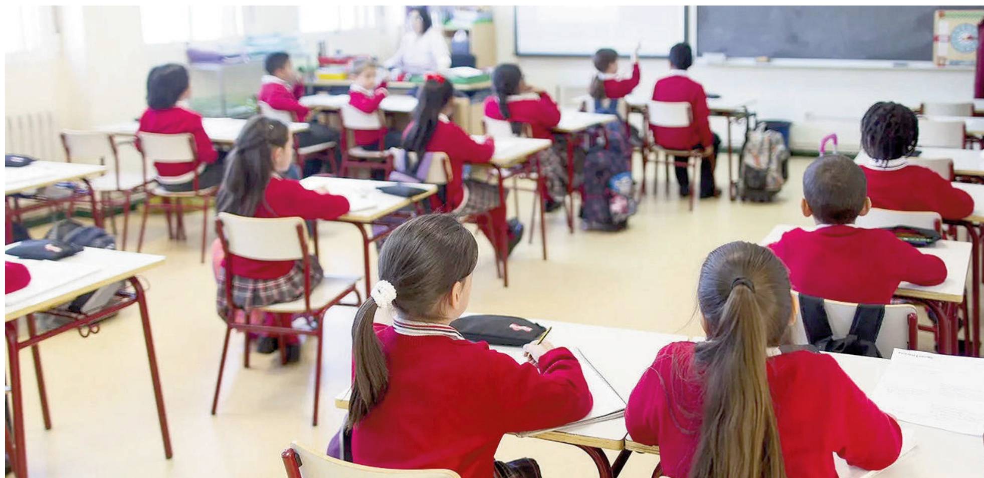
El aumento promedio de la cuota de colegios privados en relación con el ajuste previo es del 6,5% para todas las categorías, escalas y modalidades. ILUSTRACIÓN

Las autoridades de la provincia de Buenos Aires autorizaron nuevas bandas arancelarias para los colegios privados que reciben aportes estatales y fijaron los valores que se deberán abonar a partir de abril. En nuestra ciudad, el costo de las cuotas varía en función de los distintos servicios educativos y el porcentaje de aporte estatal que percibe cada institución: los aranceles de nivel primario promedian los $80.000 y se extienden hasta los $200.000 o más.