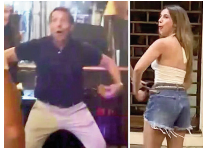
Gesto racista ahora del padre.

Sin embargo, advirtió sobre las consecuencias del video en este contexto: “No obstante, la manifestación del padre en este momento sensible del proceso —especialmente tras el pedido de revocación de las medidas cautelares— acaba generando un impacto negativo en la percepción