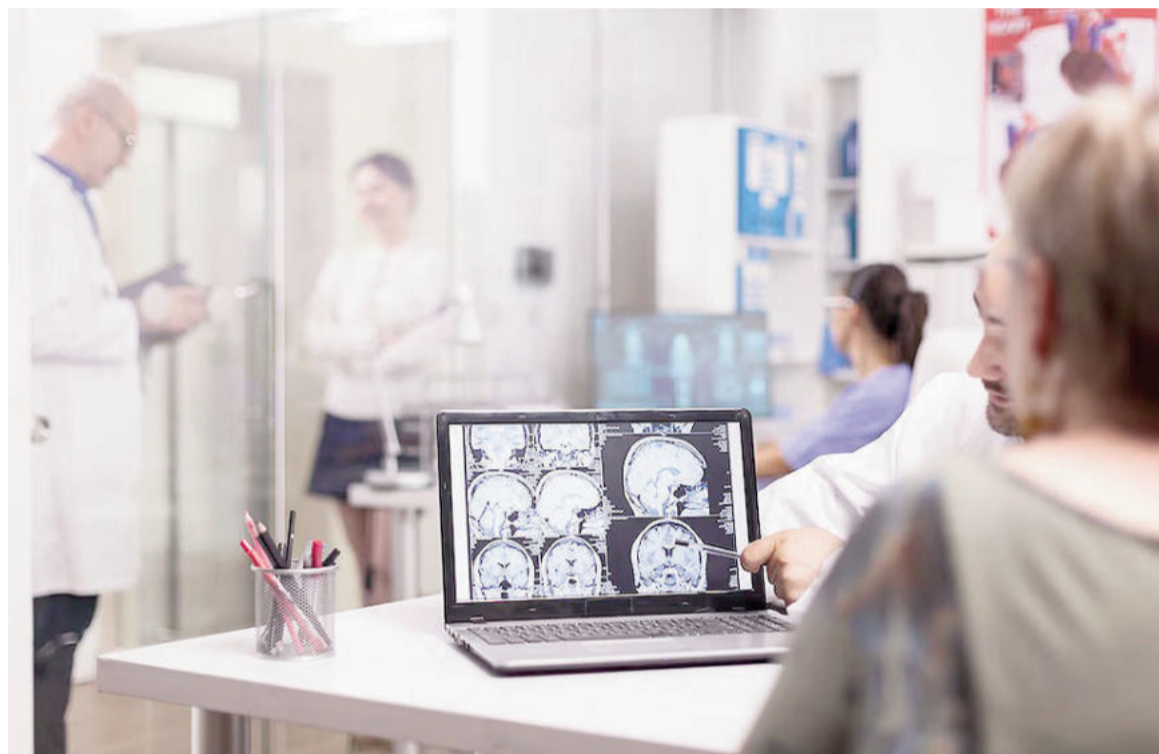
Se utilizaron imágenes cerebrales para calcular la edad biológica del cerebro y comparar si envejece a un ritmo diferente de la edad cronológica. ILUSTRACIÓN

El equipo científico se propuso analizar cómo los ambientes físicos, sociales y políticos donde transcurre la vida inciden en el ritmo del envejecimiento cerebral. El eje del análisis fue el exposoma, que es la suma de exposiciones ambientales, sociales y políticas acumuladas desde el nacimiento. Muchos estudios previos solo consideraban un factor o un país, como la contaminación o la pobreza. En este caso, se integraron datos de miles de personas de di-