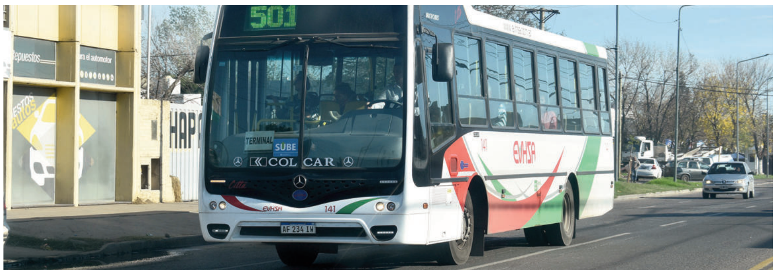
Empresarios indican que el Estado nacional adeuda los fondos correspondientes a los Atributos Sociales de Sube de enero y febrero de 2026.

Desde Fatap advirtieron que la situación ya tiene consecuencias concretas: “Actualmente, muchas empresas ya no pueden afrontar el