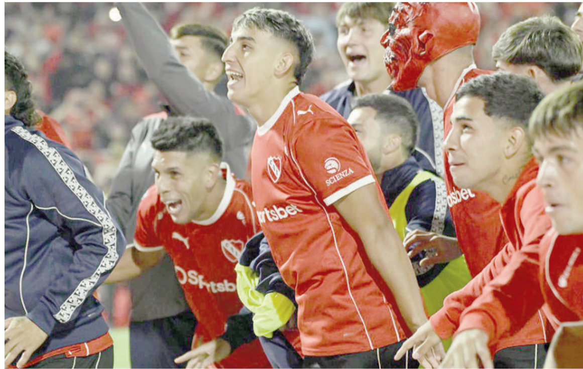
El Rojo obtuvo una victoria muy festejada.

El equipo dirigido por Gustavo Quinteros derrotó a Racing por 1 a 0 en el Libertadores de América con gol de Gabriel Ávalos y ahora marcha octavo en la Zona A.