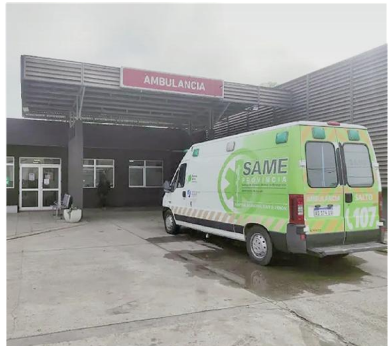
El joven baleado se encuentra en estado crítico.

La víctima, un hombre de alrededor de 30 años, sufrió dos heridas de arma de fuego en sus miembros inferiores. Uno de los