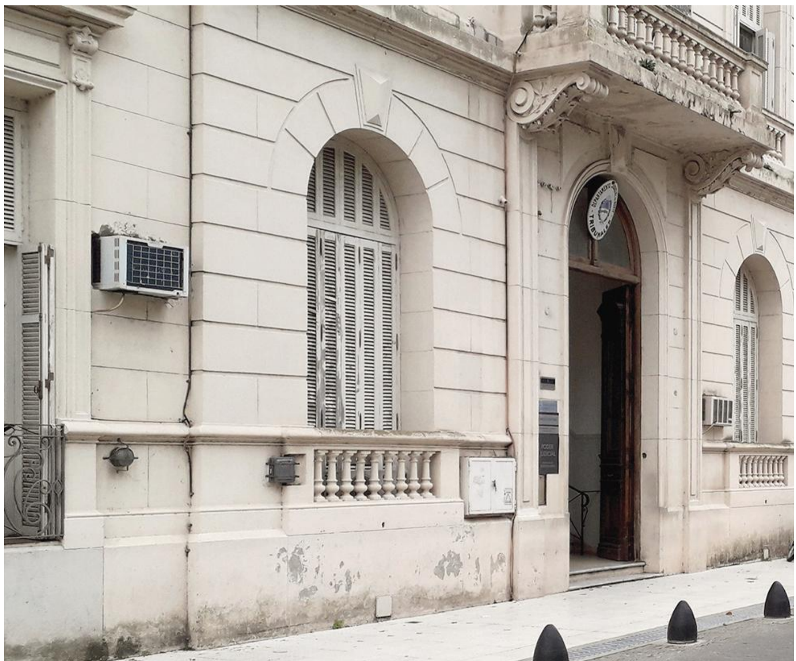
En San Nicolás, el promedio de causas ingresadas por agente supera la media provincial, a lo cual se suma la problemática por la falta de cobertura de vacantes de la planta administrativa.

Según los últimos datos estadísticos del Centro de Investigación y Formación de la Asociación Judicial Bonaerense, en los tribunales de Trabajo del Departamento Judicial San Nicolás hay un promedio de 96 causas