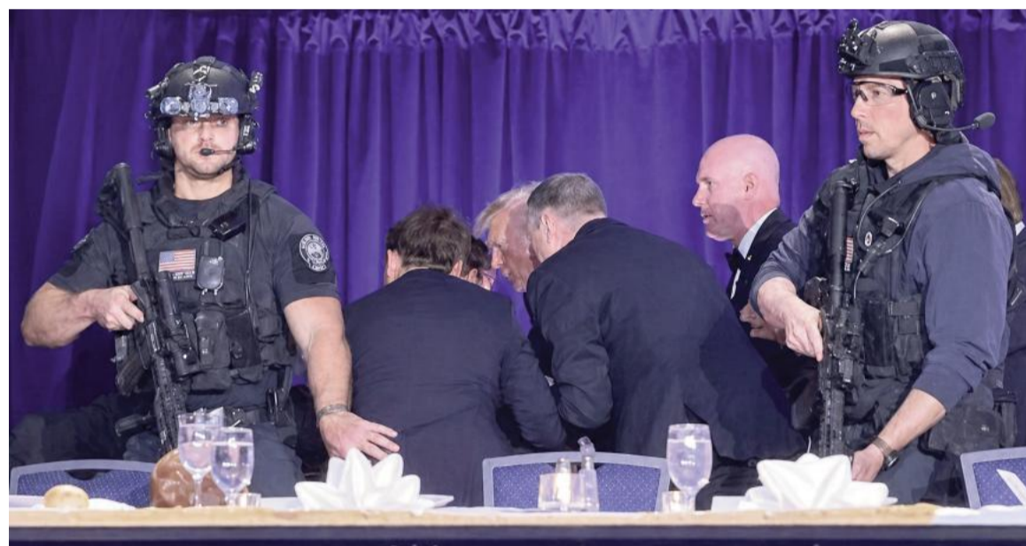
Evacuaron a Trump en medio de un tiroteo.

Ocurrió durante un evento en el que participaba el presidente, quien confirmó que el presunto tirador fue detenido. El episodio generó preocupación y obligó a activar el protocolo de seguridad.