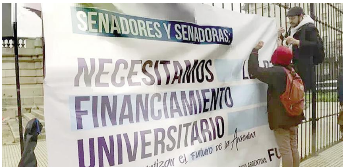
Continúa el conflicto por los fondos para universidades.

La trastienda vuelve a exponer, además, cruces por la estrategia parlamentaria. En distintos despachos oficiales aseguran que existió durante