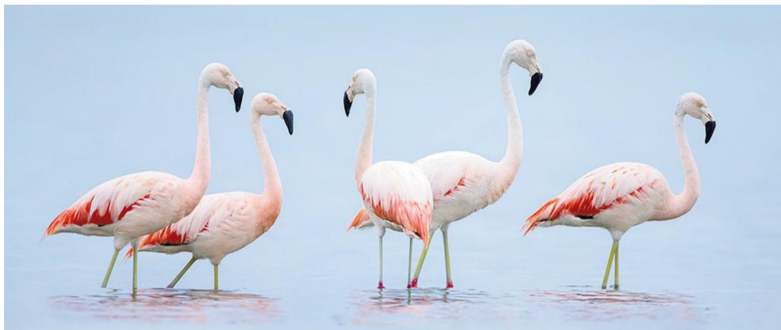
El flamenco austral habita diversos humedales desde el norte argentino hasta la Patagonia; su especie se encuentra en estado "vulnerable", según especialistas.

En ese sentido, el predio platense (exzoológico) lleva adelante el seguimiento reproductivo del flamenco austral como instancia fundamental para fortalecer estrategias de manejo ex situ, generar conocimiento aplicado y consolidar poblaciones de resguardo frente a las amenazas que las afectan, como la pérdida y degradación de hábitats,