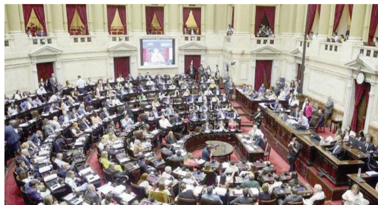
Milei acelera reformas en el Congreso.

En paralelo, el Ejecutivo también envió una reforma de la ley nacional de salud mental (26.657),