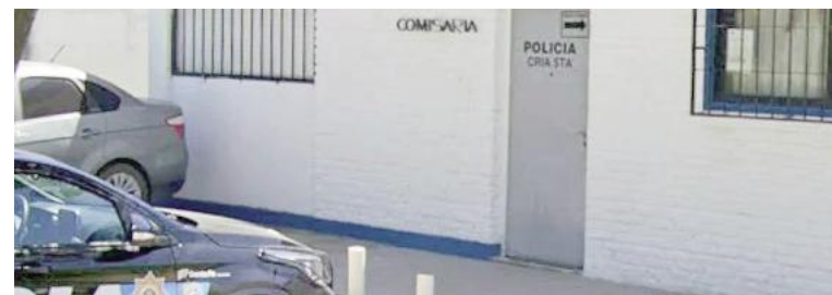
Comisaría 5ta de Empalme, donde se desempeñaba el comisario detenido.

La causa que ahora derivó en estas detenciones tiene un antecedente directo en un procedimiento reali-