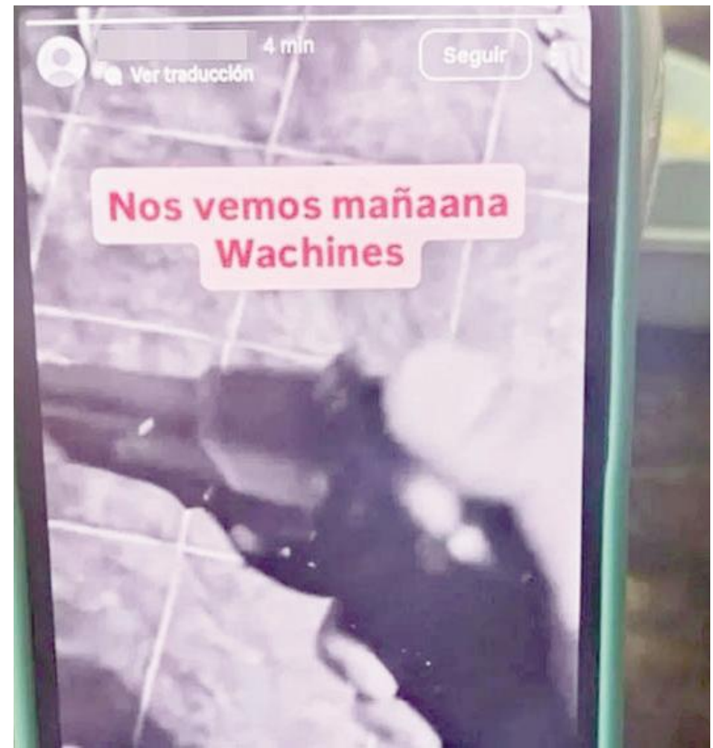
La amenaza que aparecía en la cuenta de Instagram que después fue cerrada.

En tanto, la Fiscalía Penal Juvenil del Turno 4° de Córdoba formuló cargos contra ocho alumnos por el delito de "amenaza agravada por anonimato" en un caso que investiga más de 100 hechos en la capital provincial. Asimismo, se tramitan diligencias en La Falda, Cosquín, Capilla del Monte, Cruz del Eje y Jesús María.