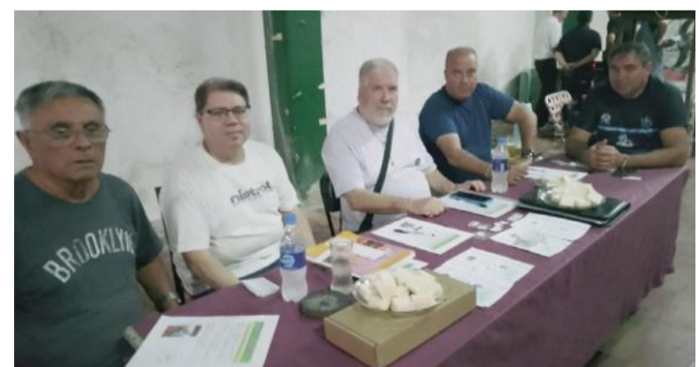
Conferencia de prensa del viernes en el club Lavalle.