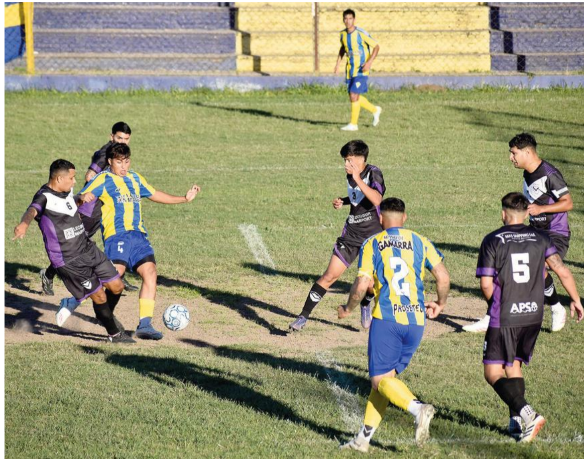
Doce le ganó a El Fortín y subió al quinto puesto. EL NORTE

Ayer se disputaron tres partidos del Torneo Apertura. Los Andes mantuvo el liderazgo al empatar 0 a 0 en Pérez Millán ante San Martín. Además ganaron Social y 12 de Octubre