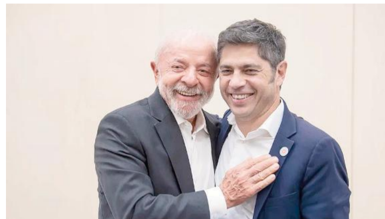
El gobernador Axel Kicillof se mostró junto a Lula Da Silva y renovó críticas contra Milei.

Durante su exposición en el panel "Respuesta progresista local: la primera línea de la democracia", Kicillof apuntó directamente contra la narrativa oficialista. Sostuvo que los supuestos logros en materia de estabilidad e inversiones no se reflejan en la realidad y afirmó que las políticas del Gobierno nacional están deteriorando variables centrales como