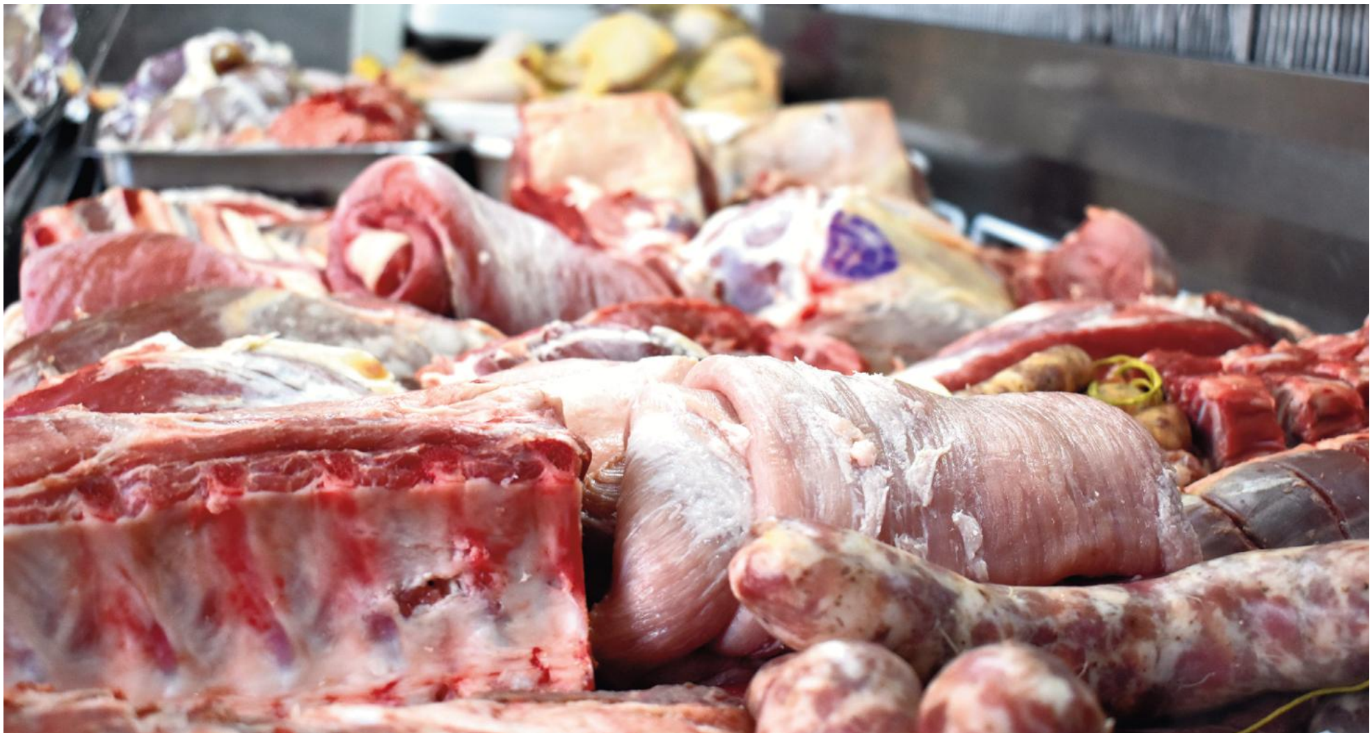
El de las carnes fue el rubro que mayores incrementos registró en los últimos meses.

Una canasta media de 25 productos podía costar entre $73.000 y $89.000 hacia mediados de julio del año pasado en grandes y medianos supermercados de San Nicolás. Nueve meses después, la compra de esos mismos alimentos implica un gasto que puede oscilar entre $110.000 y $123.000. Carnes fue el rubro que más subió, con un alza del 65,2% en cortes vacunos.