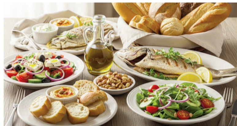
El orden en que se consumen los alimentos influye en cómo el cuerpo procesa la glucosa.

transportada por el torrente sanguíneo hacia todas las células.