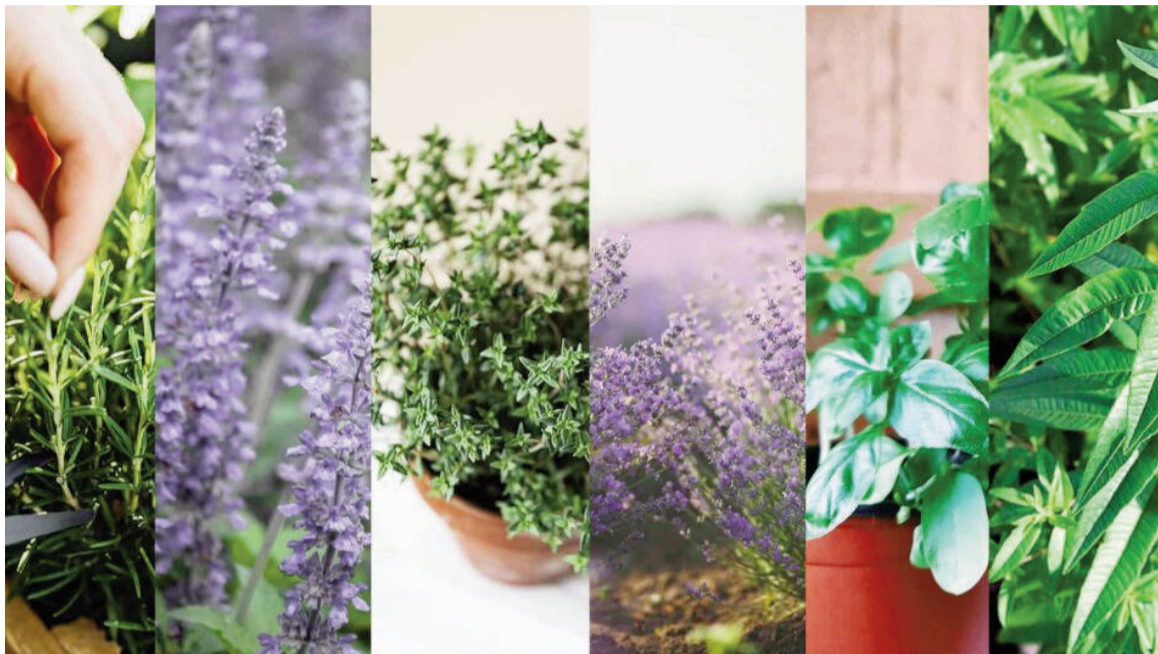
Especialistas recomiendan plantar aromáticas en otoño para aprovechar el fortalecimiento de raíces y mejorar el jardín en primavera.