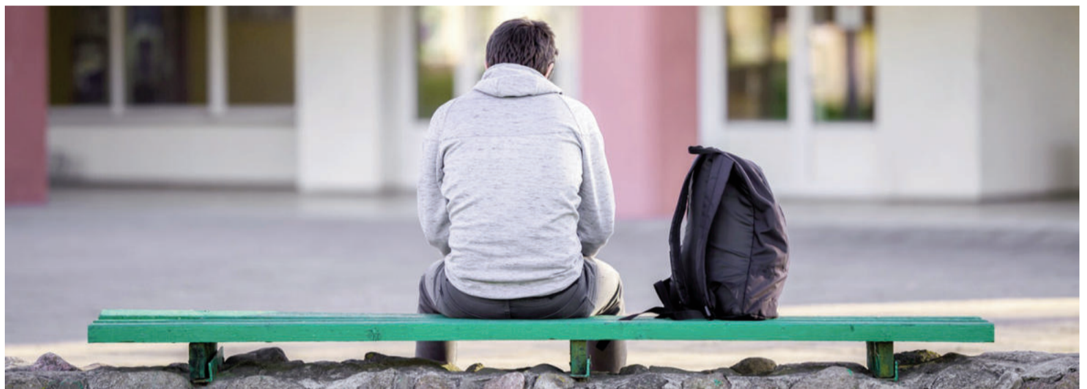
Según la investigación, metas sociales basadas en evitar la crítica reducen la confianza y la participación de los adolescentes.

Este patrón de evitación reduce oportunidades para fortalecer la confianza y la participación, generando un entorno social más restrictivo y