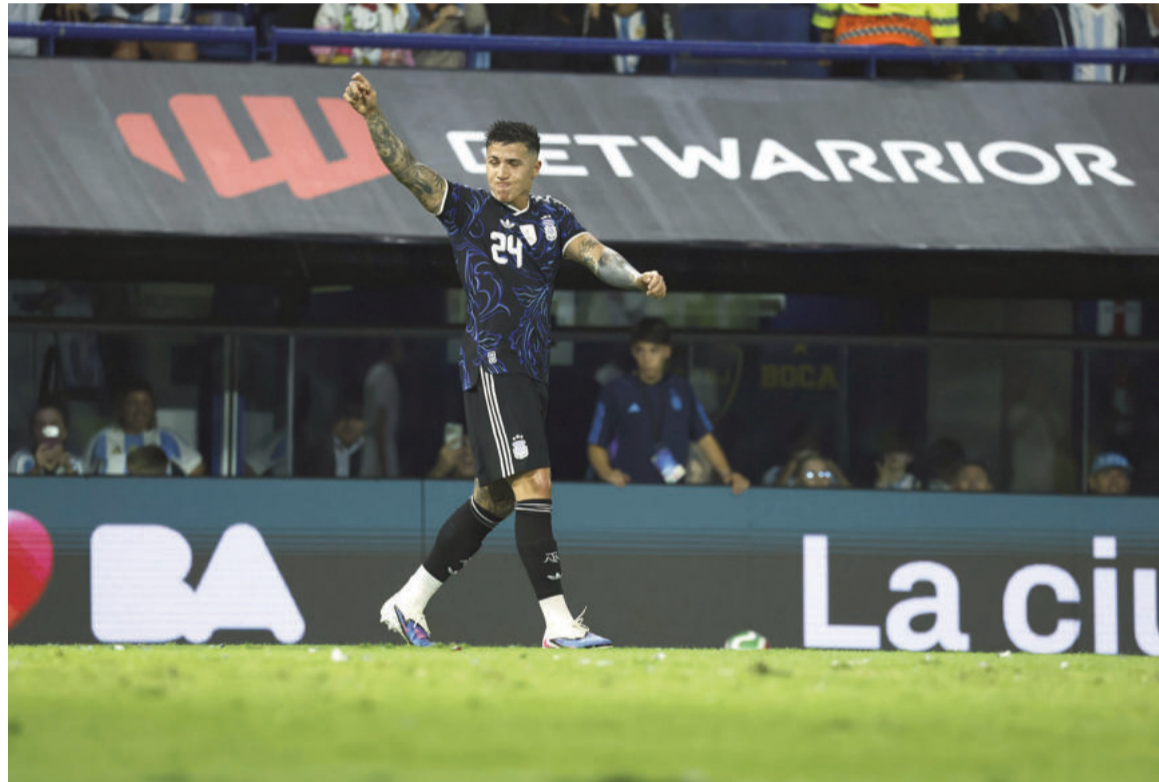
El equipo de Scaloni dejó algunas dudas ante el conjunto africano.

La Selección albiceleste derrotó por 2 a 1 a Mauritania en La Bombonera, pese a cumplir una pobre actuación. Enzo Fernández y Nicolás Paz anotaron para el local, mientras que Jordan Lefort descontó para la visita.