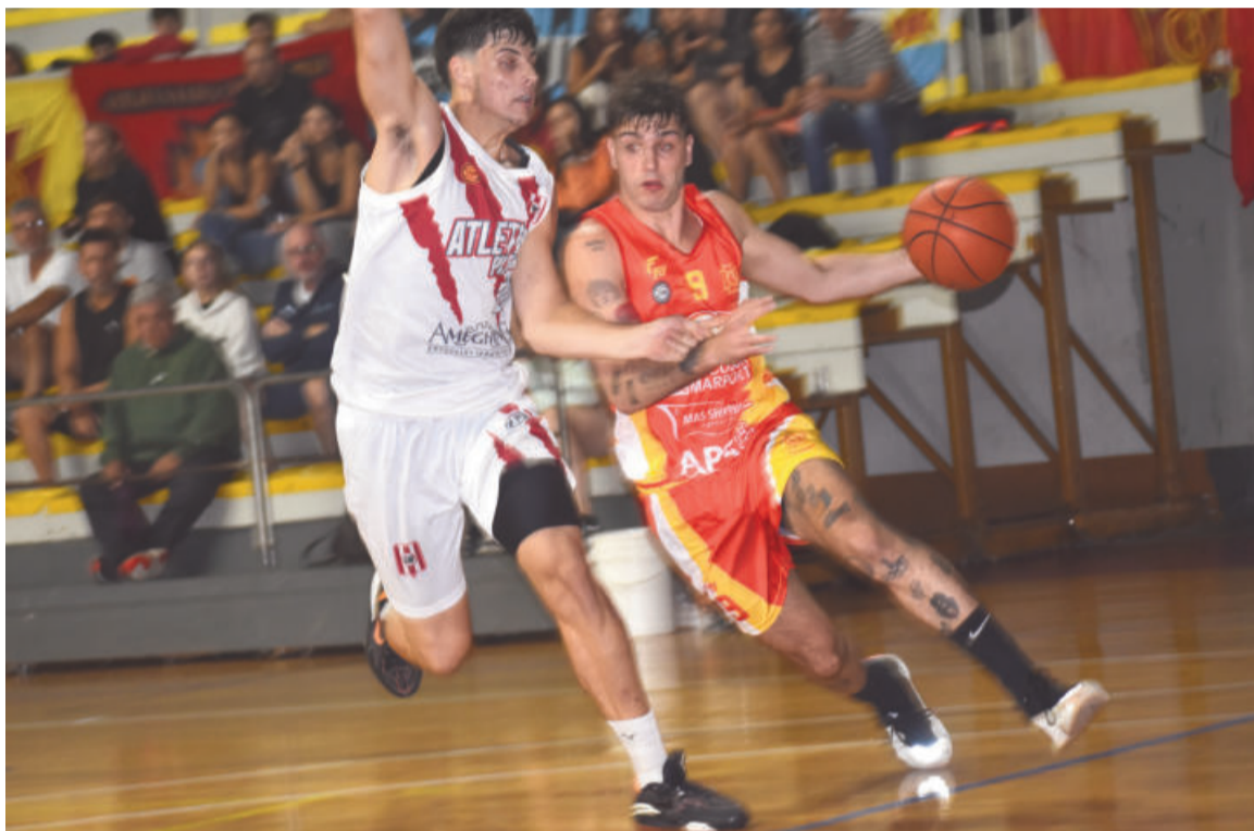
Grunale fue el goleador de Belgrano y de la noche con 19 puntos.

Empezó el segundo período 6-0 la visita, que pudo encontrar cerca