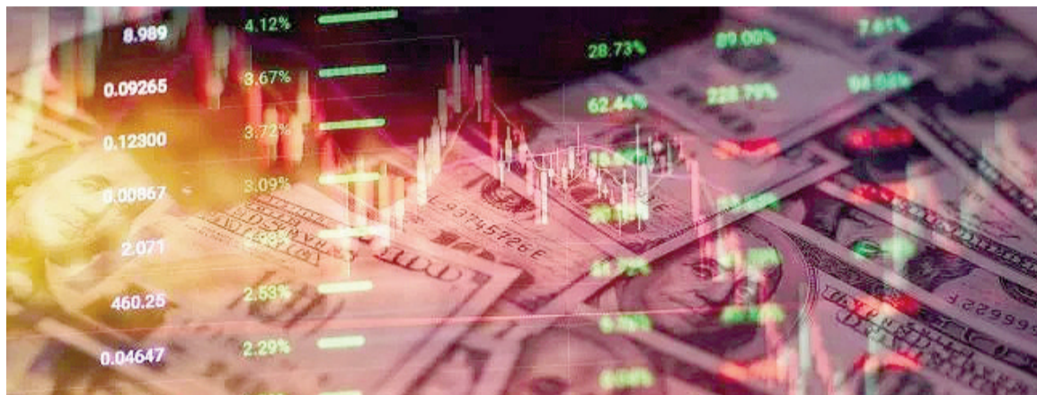
Los bonos y las acciones argentinas se hundieron ayer.

versores de activos de riesgo, los bonos soberanos en dólares argentinos sufrieron una complicada jornada. Se destacaron particularmente las caídas en el Global GD35 (-1%) y el Global GD29 (-0,8%).