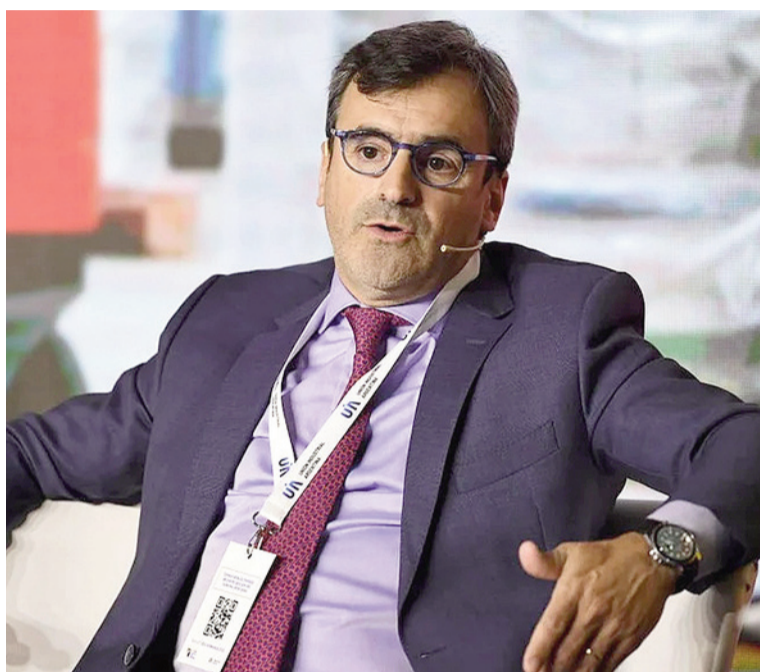
Martín Rapallini, presidente de la UIA.

“Estos datos reflejan el rol estratégico que cumple la industria en la economía argentina por su capacidad de agregar valor, generar exportaciones y aportar divisas. Detrás de cada fábrica se encuentra un capital social construido por empresarios y trabajadores”, indicó la UIA.