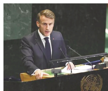
Macron rechazó las acciones militares de Estados Unidos e Israel.

En ese marco, el portaaviones Charles de Gaulle fue enviado al Me-