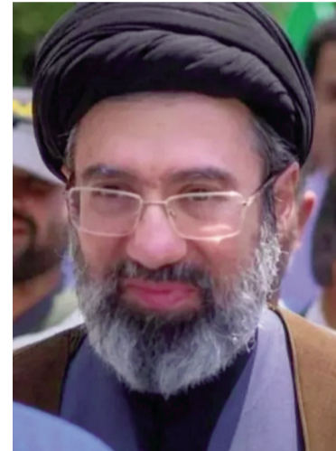
Mojtaba Khamenei será el nuevo líder supremo de Irán.

el país bajo fuego y una economía asfixiada, enfrentando retos que definirán la supervivencia del régimen.