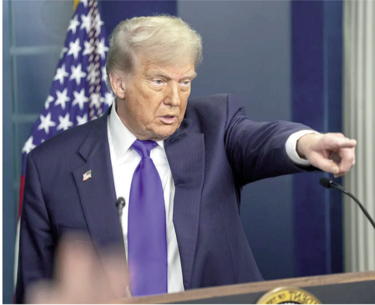
Donald Trump muy molesto con España.

Trump anunció que romperá “todo el comercio con España”, como represalia a la negativa de Sánchez