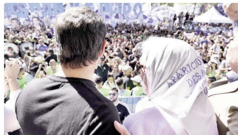
Kicillof en el discurso con las Abuelas.

Varias veces, además, volvió sobre las Madres y Abuelas, para reivindicar su papel en el proceso de Memoria,