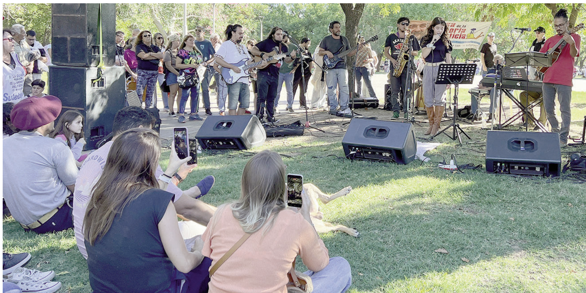
La música fue la protagonista en el Día de la Memoria, con la presencia de cientos de asistentes en las actividades organizadas por la Mesa local.