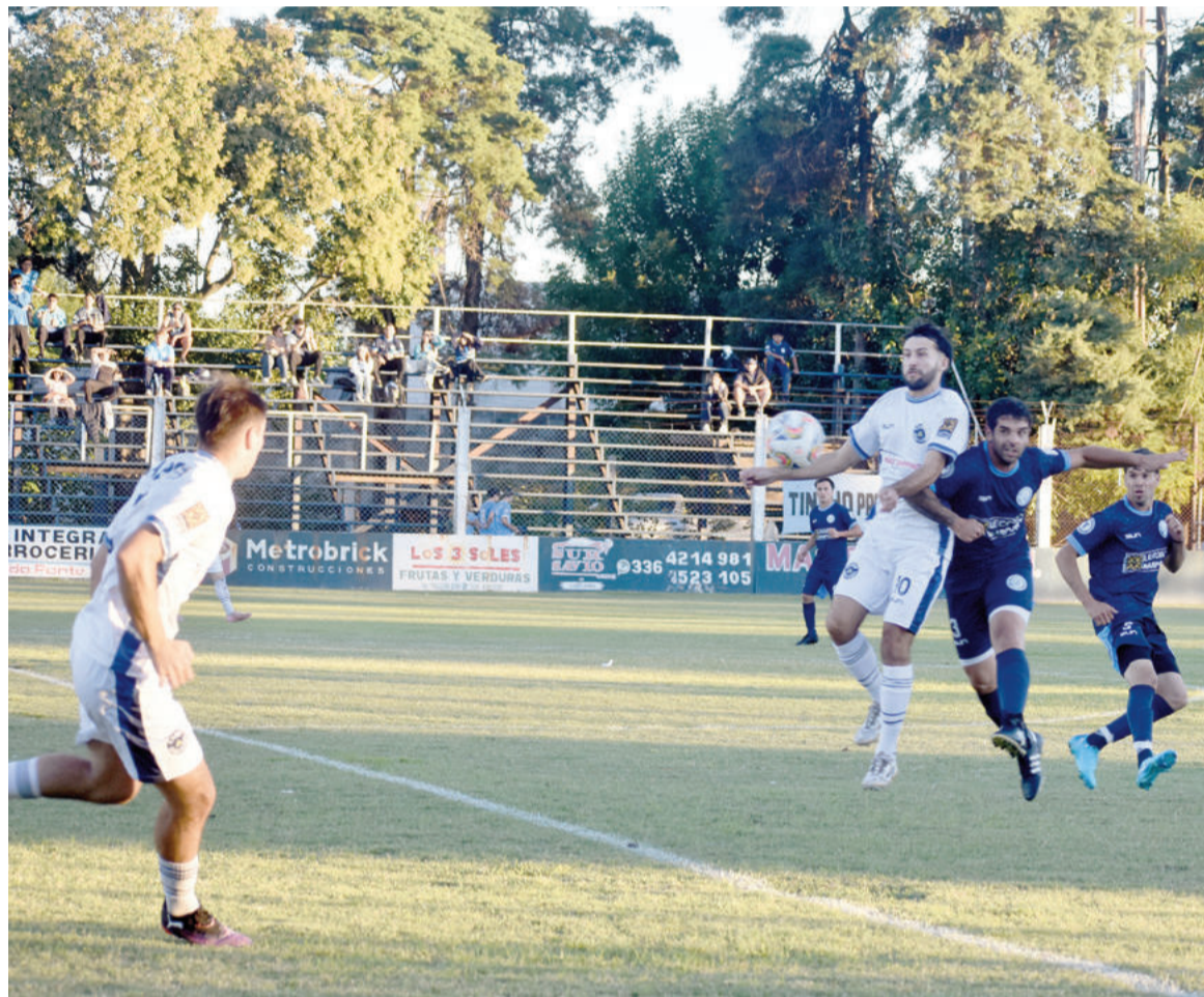
Somisa lo liquidó en ocho minutos.