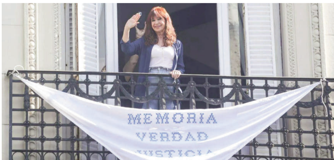
La expresidenta saludó a quienes se acercaron a San José 1111.

La expresidenta Cristina Fernández de Kirchner puso este martes una bandera en el balcón de su departamento al cumplirse el 50 aniversario de la dictadura militar y saludó a los militantes de la agrupación La Cámpora que pasaron por su domicilio para pedir su libertad, previo a concurrir a la Plaza de Mayo.