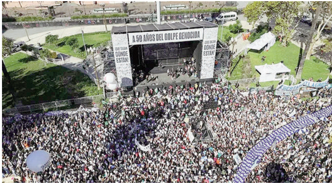
La Plaza de Mayo fue nuevamente el punto central de la convocatoria por el 24 de marzo.

"Mientras los genocidas son reivindicados por el gobierno, la política