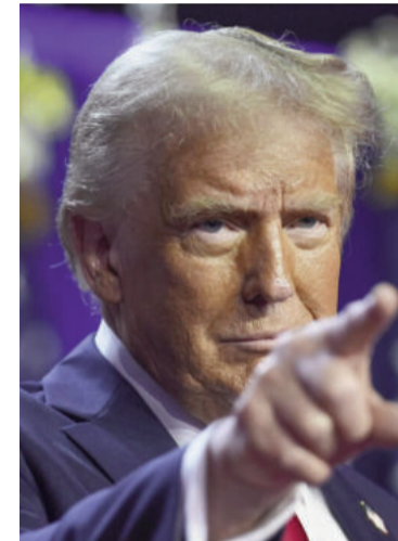
Presidente de EE.UU. Donald Trump.

Washington entregó a Irán un plan de 15 puntos para un acuerdo de alto el fuego de un mes de duración, informó anoche el Canal 12 de Israel.