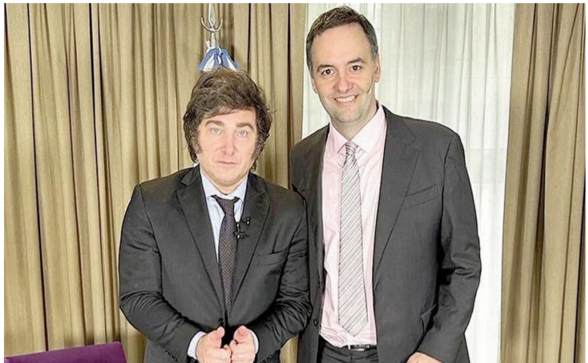
Milei y Adorni en tiempos felices.

El movimiento también se da mientras el Gobierno intenta contener el desgaste político de dos frentes si-