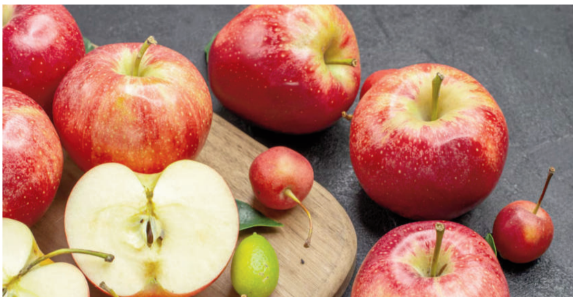
La manzana, una fruta con múltiples beneficios para la salud.

Otro punto importante es la fibra presente, sobre todo en la piel, que actúa en esa limpieza superficial al desprender partículas adheridas a los dientes. A la vez, el esfuerzo de morder