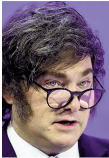
Milei insiste en que la inflación de agosto empezará en 0.

Al respecto, detalló que la "inflación mayorista de los últimos doce meses viaja al 26% anual" y que, "a su vez, la del bimestre anualizada viaja al 17% mientras que la del mes de febrero anualizada lo