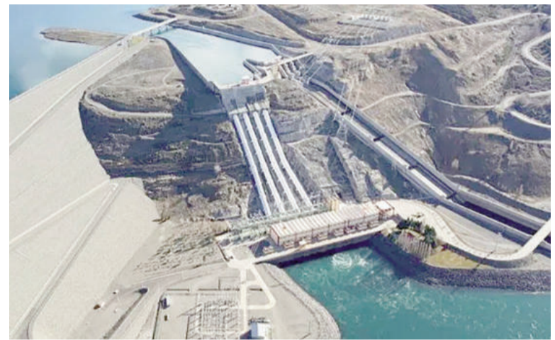
La privatización de las represas del Comahue apuntaló el superávit fiscal en el inicio de 2026.

Según indica el IARAF, en los dos primeros meses del año los ingresos totales bajaron 5% en términos reales. Eso es producto de un mix entre ingresos tributarios que tuvieron un descenso real del 9%, con una suba del 61% de los no tributarios impulsados, por los ingresos extraordinarios