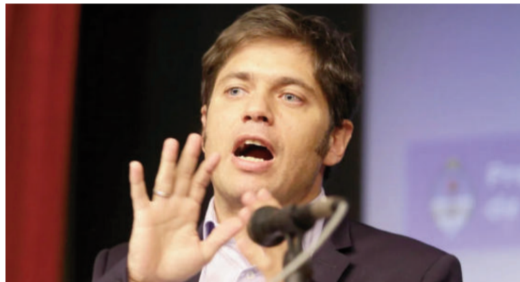
Axel Kicillof, gobernador bonaerense.

“La culpa, la responsabilidad, el origen de lo que está pasando es deliberado y tiene ganadores y perdedores”, siguió. En otro tramo de su discurso, apuntó directamente contra Milei por las nuevas pruebas incriminatorias del caso Libra, que demostrarían que el presidente era