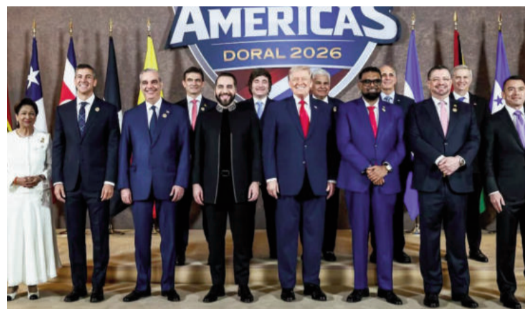
Argentina forma parte del «Escudo de las Américas».

apareció en medio del contraataque militar iraní ante los bombardeos de Estados Unidos e Israel y aumenta la tensión bilateral con una serie de acusaciones inéditas. En el texto, se afirmó: “Irán no puede permanecer indiferente ante las posiciones hostiles del actual gobierno argentino. Deberá diseñar una respuesta proporcionada a esta enemistad. Argentina se presentó oficialmente como enemiga de Irán y se ha alineado con Estados Unidos y el régimen sionista en la agresión militar contra nuestra nación. Esta es una línea roja imperdonable que ha sido cruzada”. La declaración iraní surge tras el discurso de Milei el 9 de marzo en la Universidad Yeshiva de Nueva York, donde afirmó: “Irán es nuestro enemigo. No me cae bien Irán. Nos han metido dos bombas, una en la AMIA y otra en la Embajada de Israel. Por lo tanto, son nuestros enemigos. Además, tengo una alianza estratégica con Estados Unidos e Israel”. El mandatario también sostuvo sentirse “orgulloso de ser el presidente más sionista del mundo”. Durante su estadía en Nueva York,