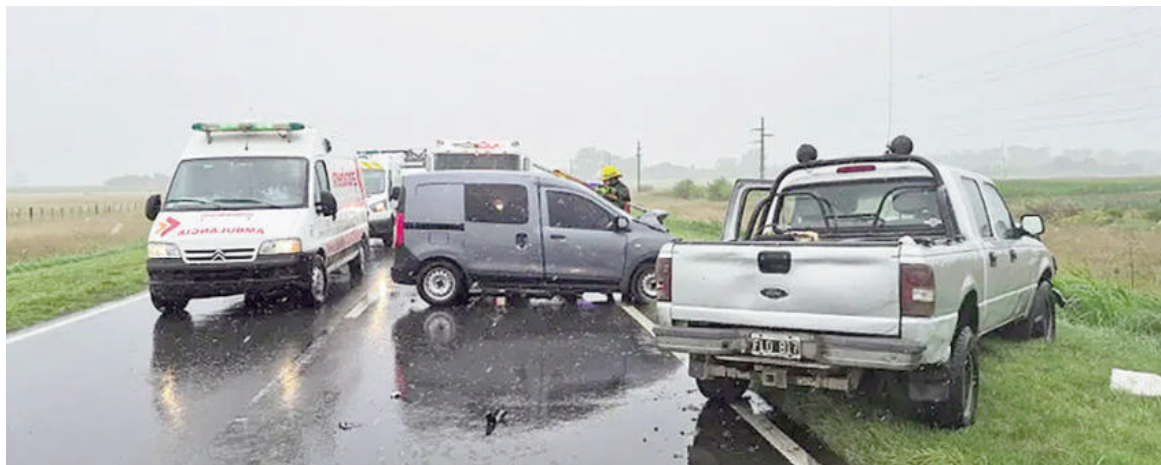
Bomberos, el SAME y agentes de Policía Vial trabajaron sobre la ruta 8.

De acuerdo con el parte oficial del Destacamento Vial Pergamino, dependiente de la Zona Vial VIII Junín, la Ford Ranger, dominio FLO817, era conducida por un hombre de 47 años domiciliado en zona rural de