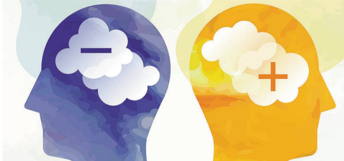
Las neurociencias demuestran que el pensamiento positivo y la felicidad tienen un impacto directo en la longevidad y la salud cerebral.

La hipótesis actual es que la felicidad y el pensamiento positivo no son solo emociones pasajeras o a ser