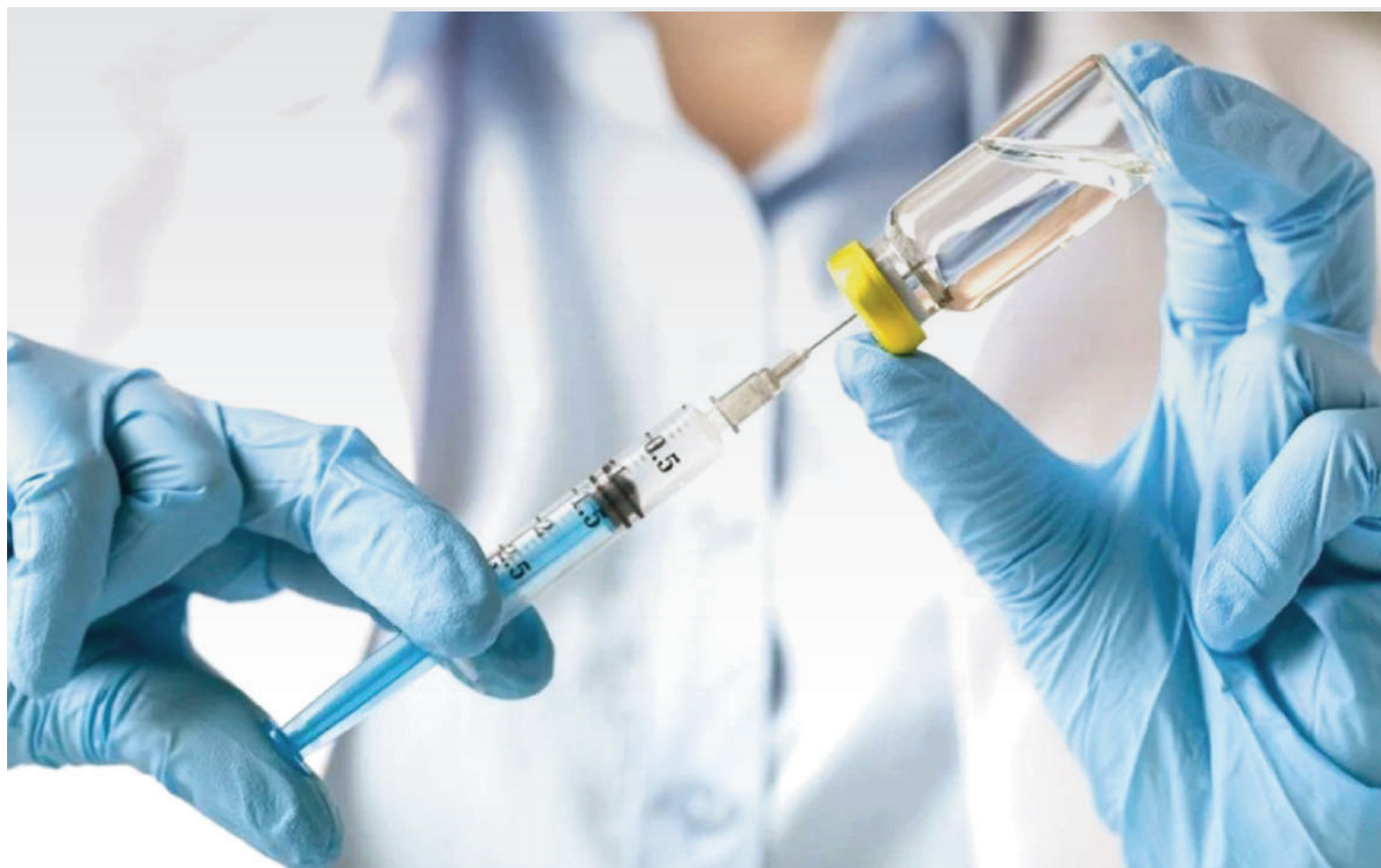
PAMI lanzó oficialmente su campaña de vacunación antigripal 2026.

Desde la entidad señalaron que la decisión de anticipar la campaña