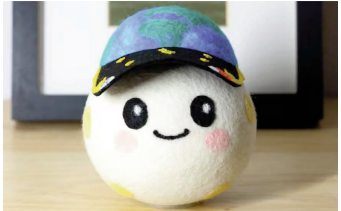
La nueva mascota fue presentada por la NASA en sus redes sociales.

"En una nave espacial llena de equipos y herramientas complejas... el indicador es una forma amigable y útil de resaltar el elemento humano, que es tan crítico para nuestra