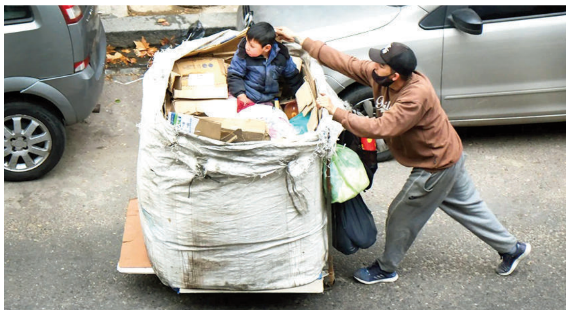
El último indicador de pobreza en San Nicolás-Villa Constitución se ubicó en 34,5%.

Así se desprende de un análisis privado de la Universidad Torcuato Di Tella (UTDT), que pronostica un indicador en torno al 30,6%, por debajo del 31,6% de la primera mitad del año pasado. Sin