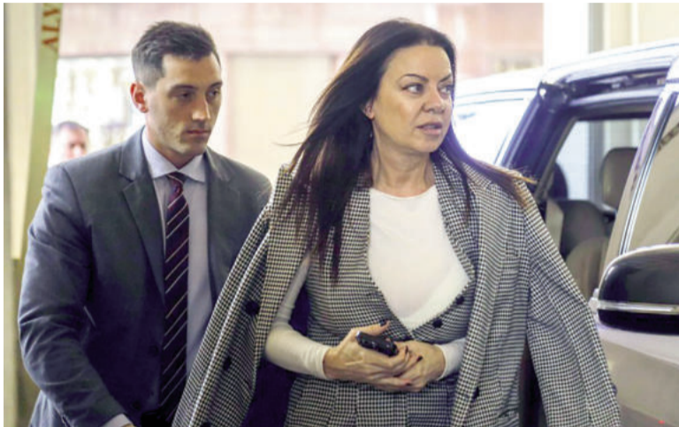
Sandra Pettovello, ministra de Capital Humano.

El lunes comenzó con un revés en el terreno judicial para el Gobierno: el Juzgado Nacional del Trabajo N° 63 suspendió cautelarmente un conjunto de artículos de la Ley N° 27.802 de Modernización Laboral a raíz de una presentación de la CGT. El oficialismo ya promete trabajo con ejes puntuales para revertir el escenario.