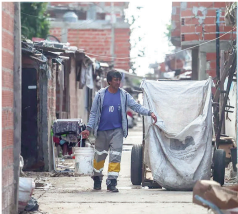
El Indec difunde hoy el índice de pobreza e indigencia.

Sin embargo, en el segundo semestre de 2024 la pobreza bajó considerablemente, alcanzando al 38,1% de la población, 3,6 puntos porcentuales menos que en igual período de 2023. En el mismo sentido, la in-