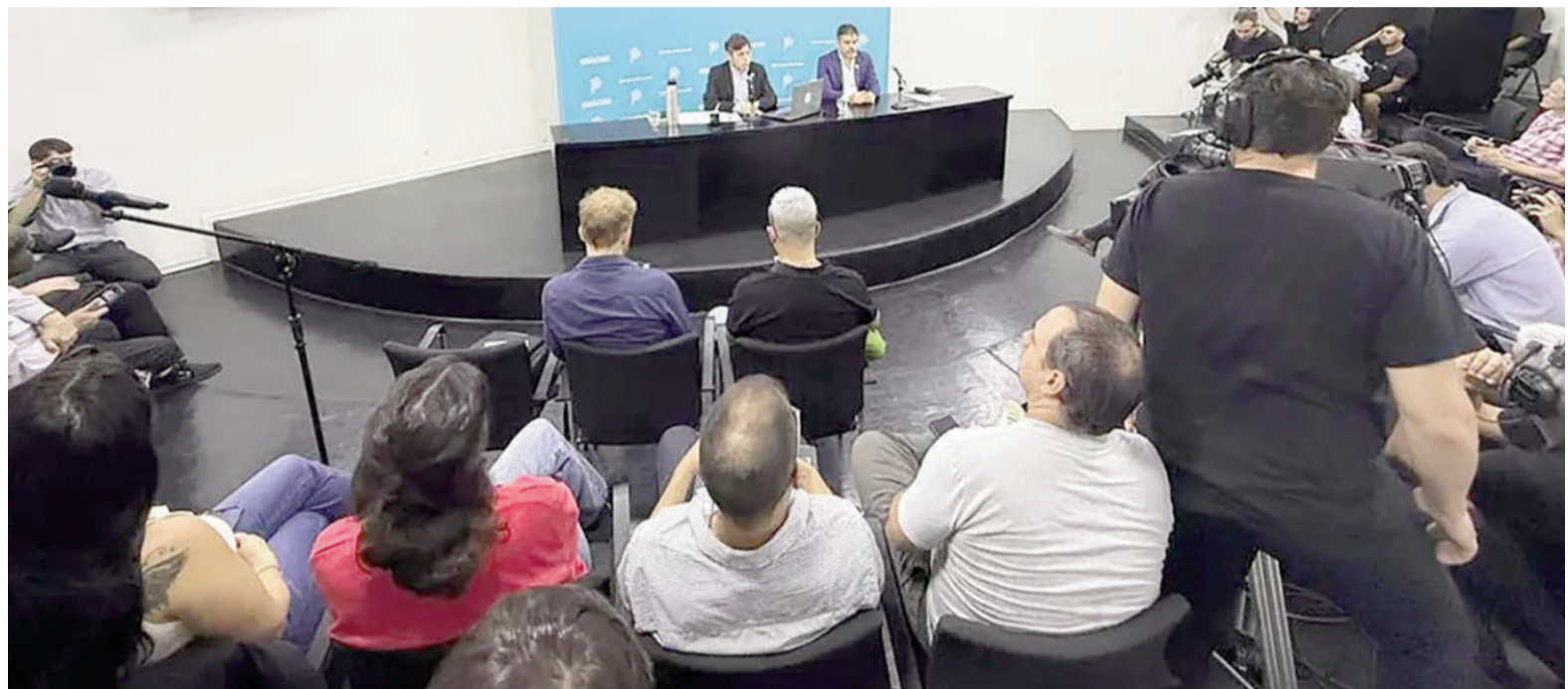
Axel Kicillof junto a Carlos Bianco en Casa de Gobierno.

"Privatizar a cualquier precio y sin ningún tipo de condicionamiento tiene riesgos tremendos y resultados trágicos", insistió el mandatario, y mostró diversos gráficos que mostraban la caída de la producción de petróleo, de gas y las reservas a la mitad bajo el mando de Repsol. Y agregó: "De exportar pasamos a importar. Fue la conducta de la privatizada la que llevó a este desastre económico".