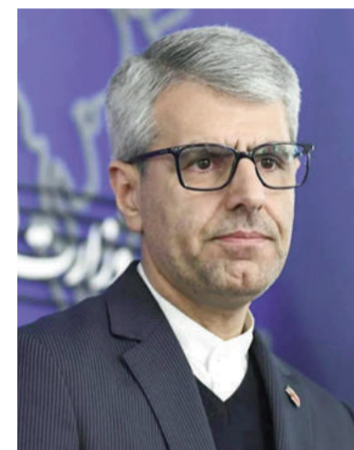
El portavoz de la cancillería iraní, Esmail Baghaei.

El portavoz de la cancillería iraní dijo que su país anunciará su conclusión sobre el plan de manera apropiada "en el momento oportuno".