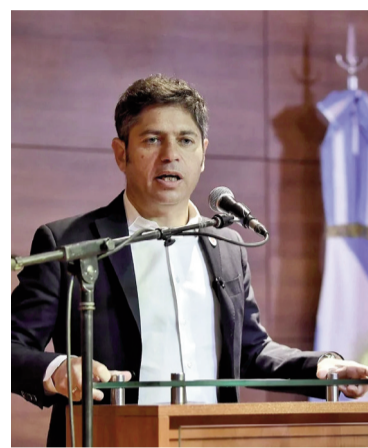
Axel Kicillof, gobernador de la provincia de Buenos Aires.

“En la fantasía anarco capitalista, el Estado no debería existir. Mientras ese discurso siga siendo aceptado y reproducido ciegamente por algunos empresarios y parte de la dirigencia va a ser muy complicado entrar en