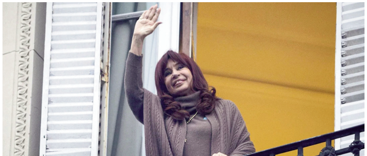
La expresidenta Cristina Kirchner cumple su condena en San José 1111.

había requerido la eliminación de la tobillera electrónica, la supresión de la autorización judicial recurrente para visitantes habituales, la quita