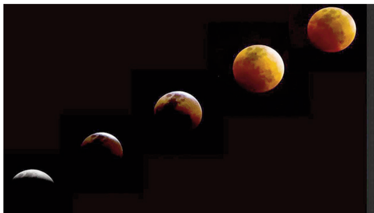
A la espera de un nuevo eclipse lunar.

1998 - MADONNA. Lanza "Ray of light", su séptimo disco, álbum de pop y dance donde la temática oriental está presente en varias pistas del álbum como «Sky Fits Heaven» y «Shanti/Ashtangi», resultado de su conversión a la Cábala, sus estudios sobre el hinduismo y el budismo, así como a la práctica de yoga.