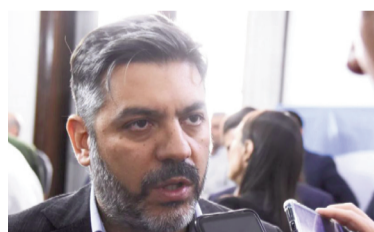
Carlos Bianco, el ministro de Gobierno bonaerense.

“Se está trabajando como hemos hecho siempre: con paritarias libres, con todos los gremios estatales”, dijo Bianco ante una consulta periodística, mientras se concretaba el paro de los sindicatos agrupados en el Frente de Unidad Docente Bonaerense (FUDB). Hoy será el