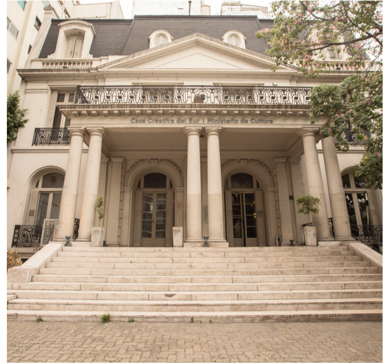
Ministerio de Capital Humano.

El Ministerio de Capital Humano se desligó del conflicto docente que afecta a varias provincias, entre ellas la provincia de Buenos Aires, y reiteró que la materia salarial es "competencia exclusiva de las provincias", mientras regía la medida de fuerza por demandas salariales y contra la reforma laboral sancionada por el Congreso.