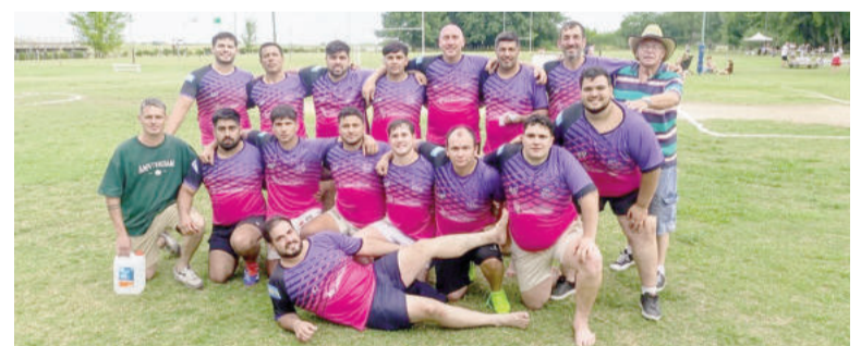
El plantel de primera de De los Arroyos Rugby Club, que se presentará el domingo en su cancha de Carlos Gardel y Pringles.