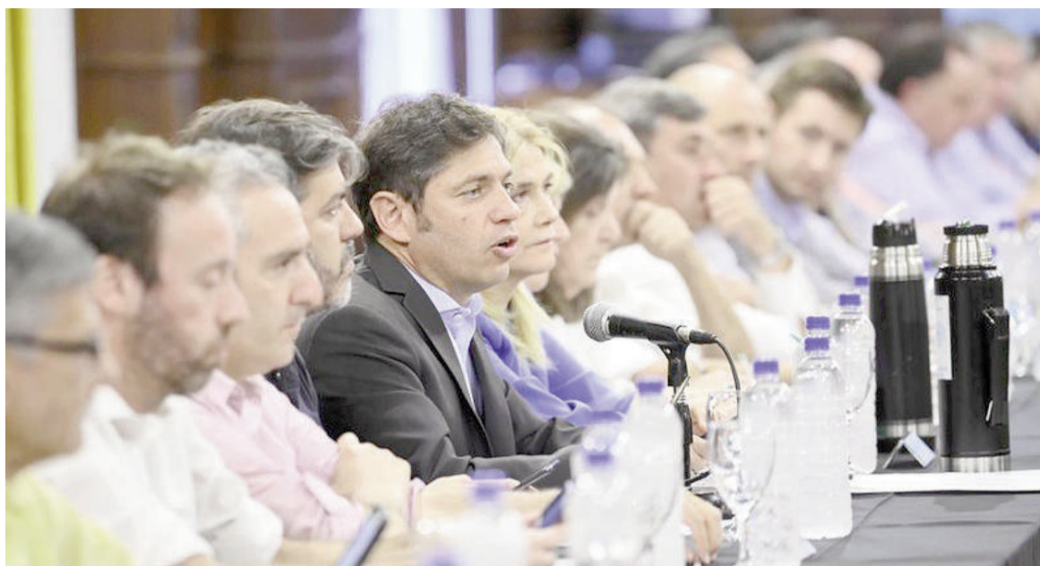
El gobernador Kicillof citó a los intendentes bonaerenses.

Cabe recordar que la semana pasada la Corte Suprema realizó una