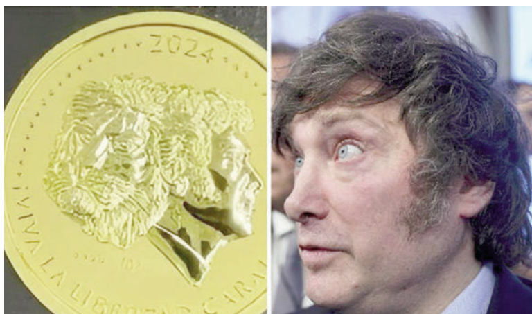
Impulsores del caso $Libra analizaban lanzar monedas de oro y plata con la imagen de Milei.

El plan se conoció a partir de pericias judiciales en el marco de la causa $Libra, donde se investigan posibles vínculos entre operadores privados y funcionarios en proyectos financieros. La aparición de esta iniciativa sumó un nuevo elemento al expediente, que busca determinar si existieron maniobras incompatibles con la función pública o uso indebido de la investidura presidencial.