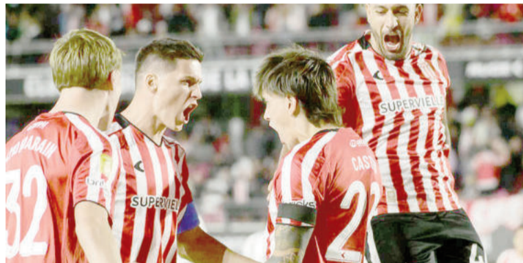
El Pincha fue contundente ante el conjunto santiagueño.

Estudiantes de La Plata goleó 5-0 a Central Córdoba de Santiago del Estero, en condición de local, en el marco de la fecha 12 de la Zona A del Torneo Apertura de la Liga Profesional y quedó como escolta del líder Vélez con un punto de diferencia. En el estadio Jorge Luis Hirschi de La Plata, el equipo del uruguayo Alexander Medina abrió la cuenta a los 2 minutos del complemento con el gol de Alexis Castro, mientras que Mikel Amondarain amplió la ventaja a los 25. La goleada la cerró Adolfo Gaich, con un triplete a los 35, 39 y 42 minutos. El 'Pincha' llegaba a este encuentro tras lo que fue la victoria por 2-1 sobre Gimnasia de Mendoza en la fecha pasada, que le permitió recomodarse en esta Zona A liderada por Vélez. Por su parte, el 'Ferroviario' venía de ganar 1-0 a Deportivo Riestra,