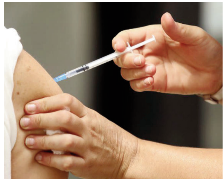
Se aconseja concurrir al vacunatorio con DNI y libreta de vacunación para su chequeo por parte del equipo de salud. ILUSTRACIÓN

Desde los efectores sanitarios estiman que, una vez cubierta la población objetivo, se podría abrir la vacunación a la población en general.