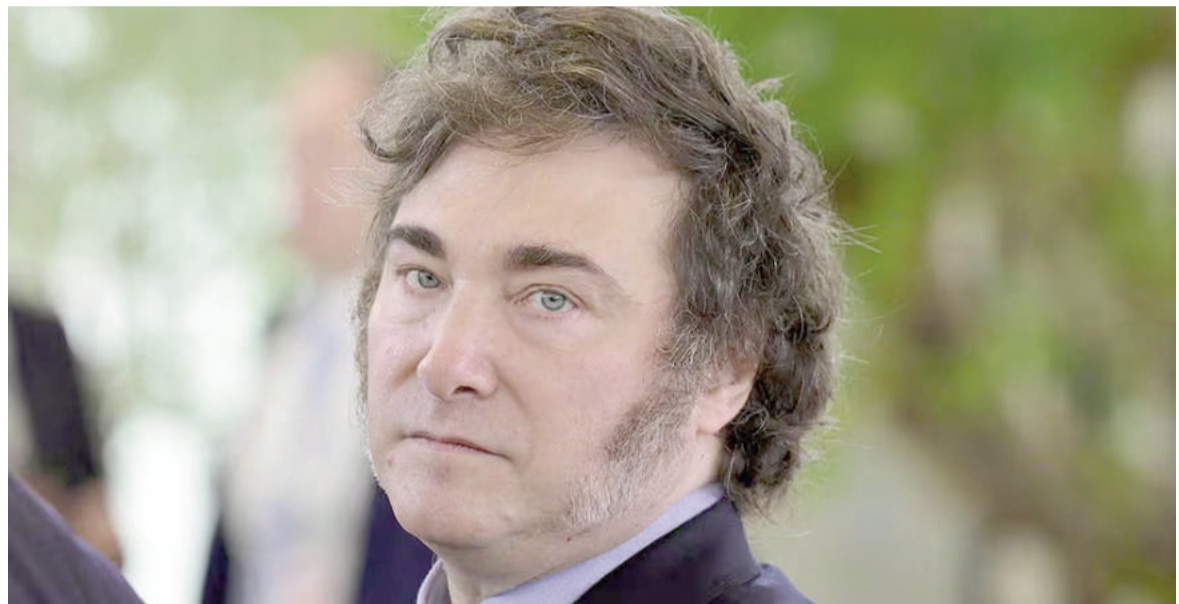
Milei busca enderezarle el rumbo a su gobierno.

Por su parte, la oposición —encabezada por sectores del pero-