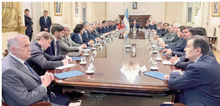
Cumbre entre el presidente, Javier Milei, y gobernadores en Casa Rosada.