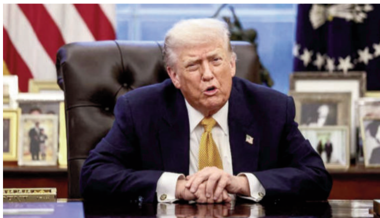
El presidente estadounidense Donald Trump.

Irán, por su parte, había respondido con dureza: la Guardia Revolucionaria prometió atacar centrales eléctricas en todas las zonas que suministran electricidad a bases estadounidenses, así como infraestructuras económicas, industriales y energéticas en las que Washington tiene participaciones. El presidente del parlamento iraní, Mohammad Bagher Qalibaf, llegó a señalar instalaciones de desalinización críticas en las naciones del Golfo como objetivos legítimos, una amenaza que podría cor-