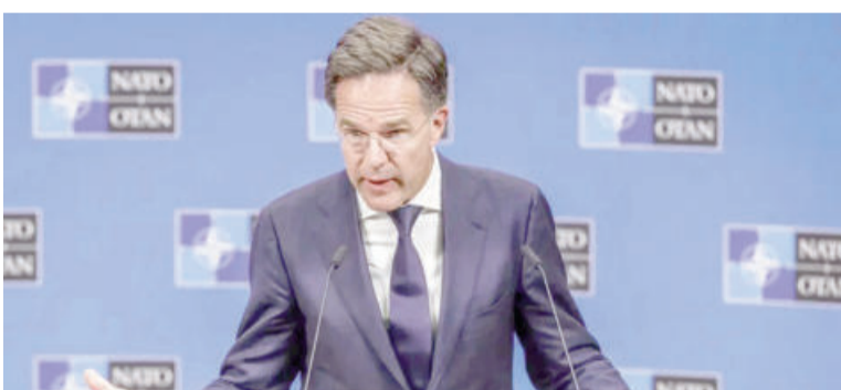
Mark Rutte, secretario general de la OTAN.

litar en Irán aún continúa, por lo que ahora estamos trabajando con estos países, así como con Estados Unidos para evaluar qué, cuándo y cómo podemos hacer para lograrlo”, añadió.