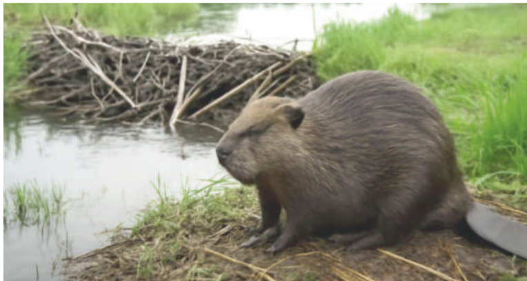
Castores transforman ríos en sumideros de carbono.