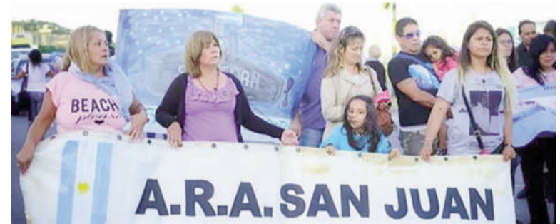
Familiares de víctimas del ARA San Juan.

"Estamos preparados para pedir los falsos testimonios que sean necesarios. De los 20 testigos que se quieren tomar esta semana, pienso que no vamos a llegar porque de cada uno hay que ser muy meticu-