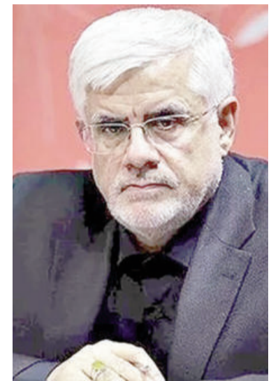
El primer vicepresidente de Irán, Mohammad Reza Aref.

“No existe preocupación alguna por el suministro de energía, combustible y productos básicos”, declaró Aref en un comunicado pu-