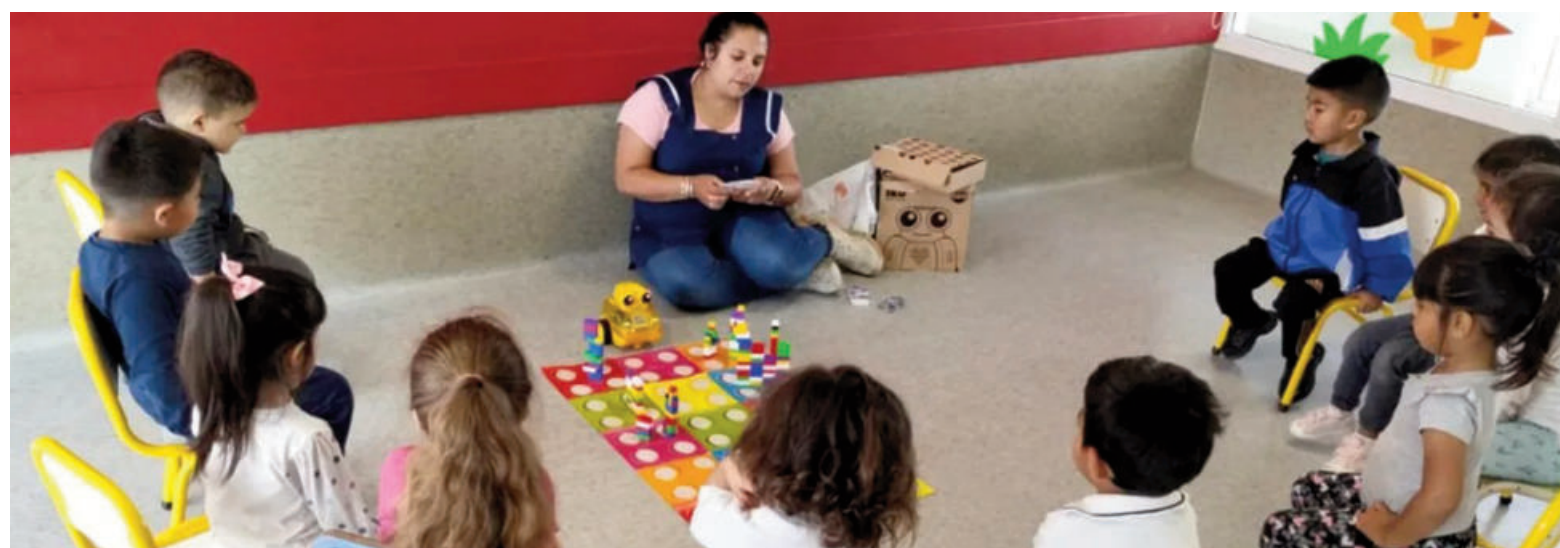
La baja en las matrículas escolares comienza a impactar en los primeros niveles de educación, tanto en gestión pública como privada. ILUSTRACIÓN

Ello también preocupa a los estudiantes del profesorado de Educación, ante la consecuente reduc-