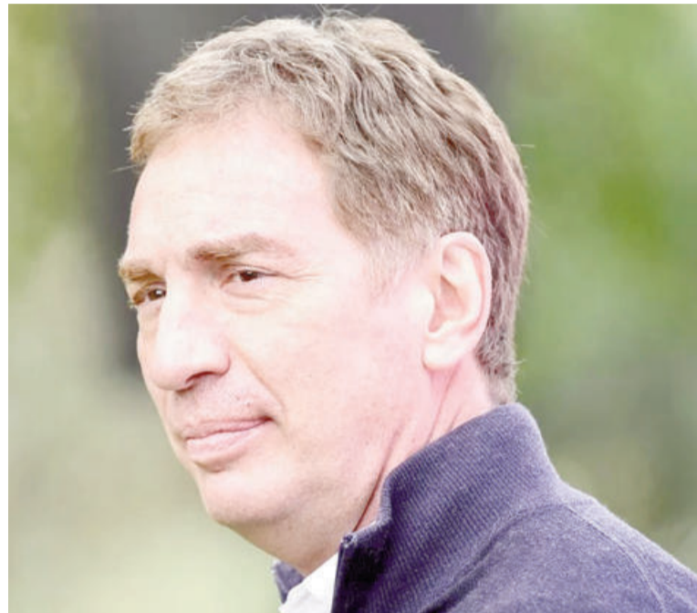
Diego Santilli se perfila como candidato a gobernador de un eventual acuerdo entre PRO y LLA.

"El acuerdo que hicimos en la provincia de Buenos Aires, que lo hice con Karina (Milei) y con todo el equipo, para nosotros fue un muy buen