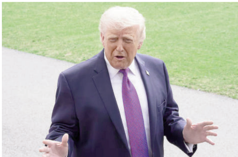
Trump volvió a exigir a Irán que reabra el estrecho de Ormuz.

En declaraciones a la cadena de televisión israelí Canal 13, Trump sostuvo: “Pronto verán lo que pasa con el ultimátum de las centrales eléctricas. El resultado va a ser muy bueno (...). La destrucción de Irán va a ser total y va a funcionar estupidamente”. Asimismo, sostuvo que “Irán ha sido muy malo durante 47 años y ahora está recibiendo su justo castigo”. El presidente también criticó la falta de participación de