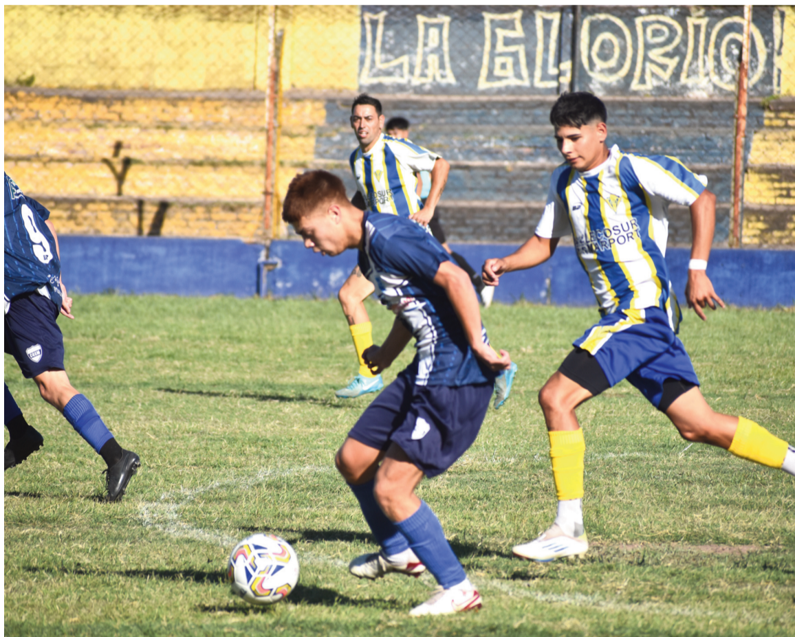
En Soler y América, Doce y San Martín terminaron 1 a 1. EL NORTE

La fecha había comenzado el viernes con los empates de Somisa vs. Regatas (0-0) y Conesa vs. Belgrano (1-1). El sábado, Matienzo y Defensores igualaron 0 a 0 y Paraná derrotó a El Fortín 4 a 0.