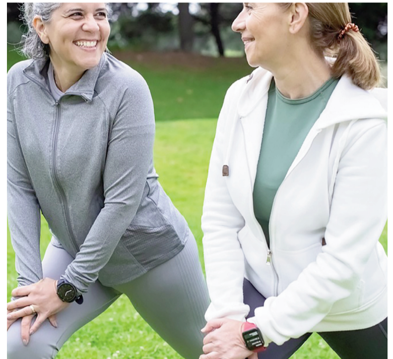
El ejercicio físico se recomienda como tratamiento complementario para la depresión.

El ejercicio, a través de la liberación de exerquinas, puede revertir estos cambios.