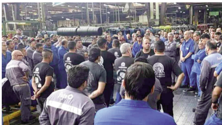
El conflicto de Fate fue uno de los más resonantes de los últimos meses.

En cuanto a la distribución geográfica, gran parte de la zona centro del país acaparó el 48% de los casos de conflictividad laboral: Buenos Aires 25,8%,