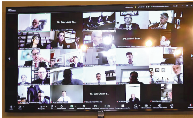
El Tribunal Oral Federal 7 define si rechaza las nulidades y habilita el avance del juicio por la causa Cuadernos.