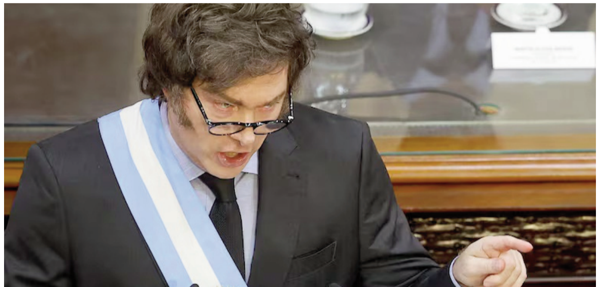
El Presidente hizo varios frenos a la lectura para hablarle a la oposición con sarcasmo.

«La política debe ser nuevamente puesta al servicio de la sociedad. Por eso necesitamos reformar integralmente el sistema electoral», dijo, y aseveró que «esto implica también reformar cómo se financian los partidos políticos» para poder «eliminar la influencia de