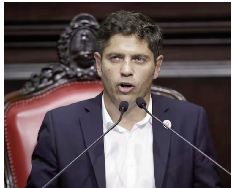
Kicillof, en la apertura de sesiones de 2025.

La vicepresidencia primera, el cargo más importante que se definía,