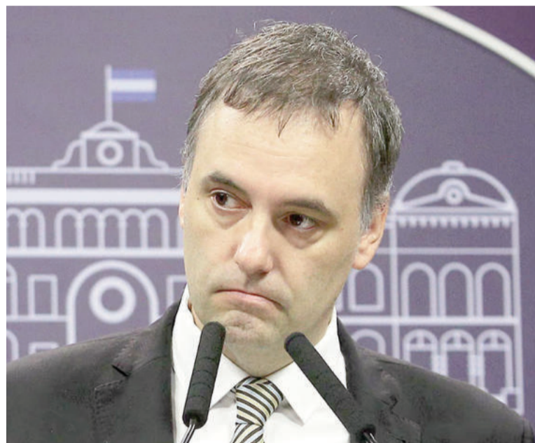
Volvió a encabezar una rueda de prensa en casi dos meses.

El jefe de Gabinete redobló las críticas contra parte de la oposición, en especial el kirchnerismo, y la prensa: "No me voy a sentar a que nos den clases de ética los