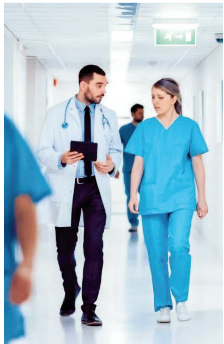
Los nuevos profesionales del hospital San Felipe realizarán durante 6 meses una formación en servicio. ILUSTRACIÓN

El programa de pre-residencias está destinado a profesionales recientemente graduados -con menos de dos años desde la obtención del título- y propone