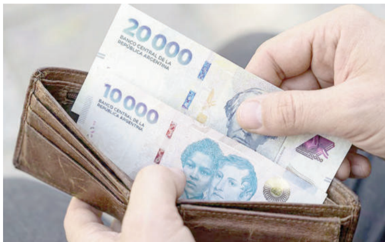
Los salarios registrados perdieron contra la inflación en enero de 2026.

Según cifras oficiales del Indec, en los últimos 100 meses tanto los