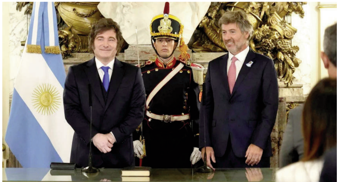
Juan Bautista Mahiques al jurar como ministro de Justicia.

Entre los delitos que se buscarán tipificar o reforzar aparecen los vinculados a cuestiones migratorias, las estafas piramidales y modalidades delictivas urbanas como las “viudas negras”, salideras bancarias, entraderas y los denominados motochorros.