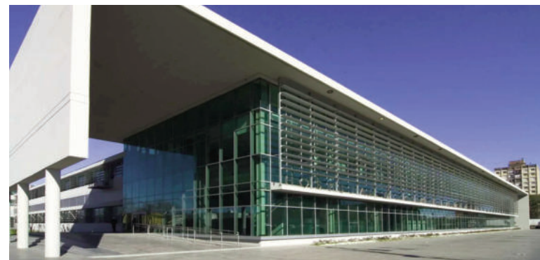
Balacera en zona del Hospital de Emergencias Clemente Álvarez.

Los autores no fueron identificados ni detenidos. Intervino el Ministerio Público de la Acusación.