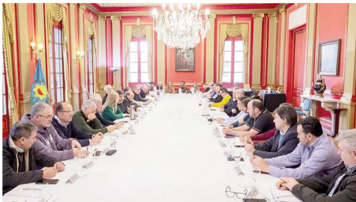
Axel Kicillof llamó a una cumbre con intendentes para evaluar el impacto del ajuste de Milei.

El tema fue abordado el martes en un zoom por alcaldes de la UCR, quienes acordaron enviar una de-