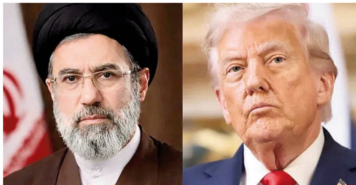
Teherán consideró "excesiva" la propuesta de Donald Trump.

Teherán calificó de "excesiva" la sugerencia de EEUU y exigió cinco puntos clave, incluido el control sobre Ormuz.