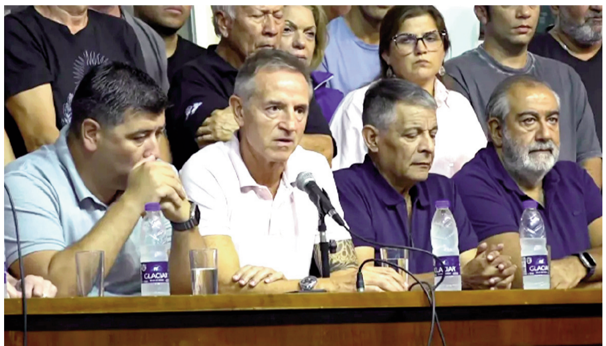
La Justicia no le dio lugar al reclamo de la CGT.

En paralelo, la central obrera analiza nuevas presentaciones judiciales y otras acciones políticas para in-