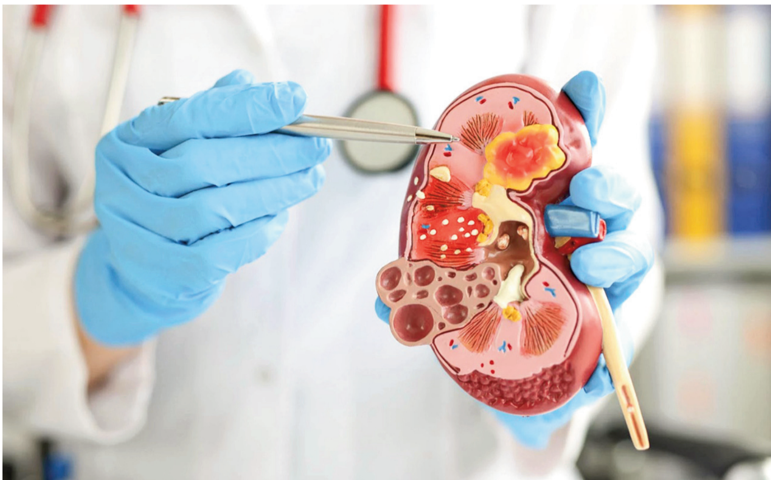
El 12 de marzo se recuerda el Día Mundial del Riñón.

“La mayoría de las enfermedades renales avanzan de manera silenciosa –sostiene Cantarutti–. En sus etapas iniciales no suelen dar síntomas, por eso el chequeo es fundamental. Tienen mayor riesgo las personas con diabetes, hipertensión, enfermedad cardíaca o antecedentes familiares de insuficiencia renal”.