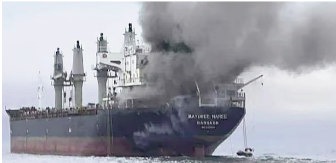
La Armada Real de Tailandia mostró humo elevándose desde el buque de carga tailandés 'Mayuree Naree'.

El mando militar conjunto de Irán anunció que comenzará a apuntar a bancos e instituciones financieras en Medio Oriente, una amenaza que pondría en riesgo especialmente a Dubai, en Emiratos Árabes Unidos, sede de muchas instituciones financieras internacionales, así como a Arabia Saudita y al reino insular de Bahrein. El régimen islámico agregó que las personas de