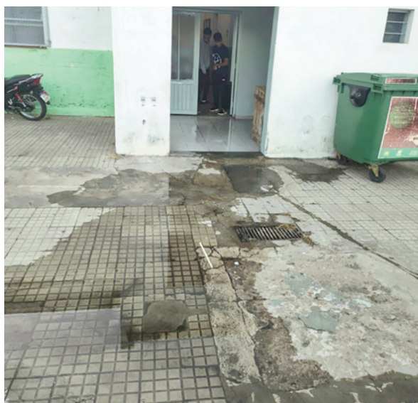
El edificio en el que funcionan la Primaria y la Secundaria N° 16, situado en Terrasson y Almafuerde..

El miércoles 18 de febrero, delincuentes forzaron ventanas de la Escuela Primaria N° 34 "Fray Luis Beltrán" para ingresar y robar tres ventiladores y ollas que se encontraban en la cocina. Además, provocaron daños importantes en distintas instalaciones, tales como la bacha del baño de docentes, algo similar a lo que ocurrió en el esta-