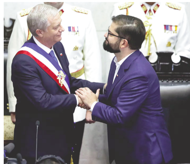
Jose Antonio Kast saluda al presidente saliente, Gabriel Boric.

Gobernará hasta 2030. Es el primer mandatario abiertamente "pinochetista" desde la recuperación de la democracia en el país.