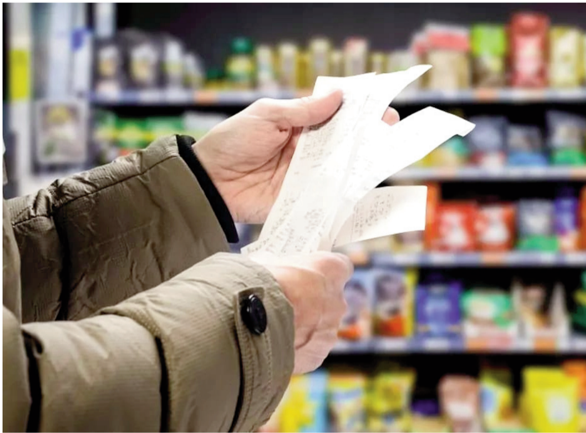
El REM del Banco Central elevó la proyección de inflación para 2026 al 26,1%, con expectativas de 2,7% para febrero.