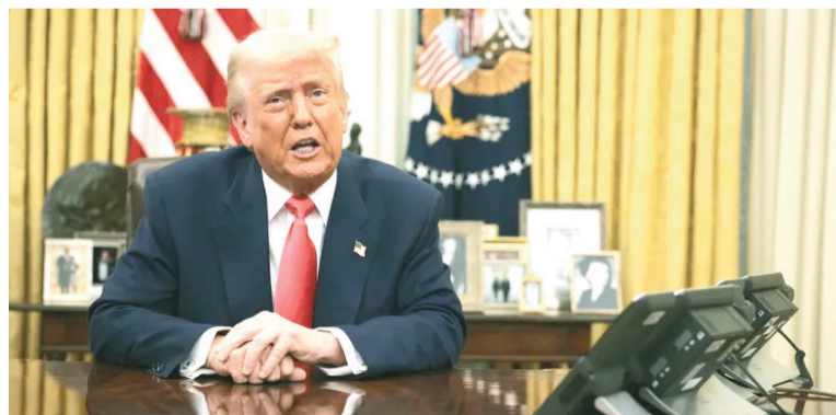
Donald Trump, dos veces presidente de Estados Unidos.

Según el mandatario, el objetivo ahora es concluir la campaña militar antes de considerar una retirada. «No queremos irnos antes de tiempo,