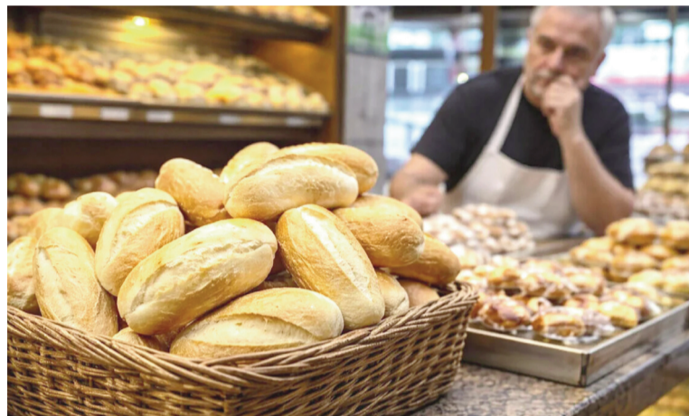
Panaderías en crisis.

A la caída del consumo se suman aumentos constantes en insumos y servicios. La harina, principal materia prima, subió entre un 5 y un 8% en