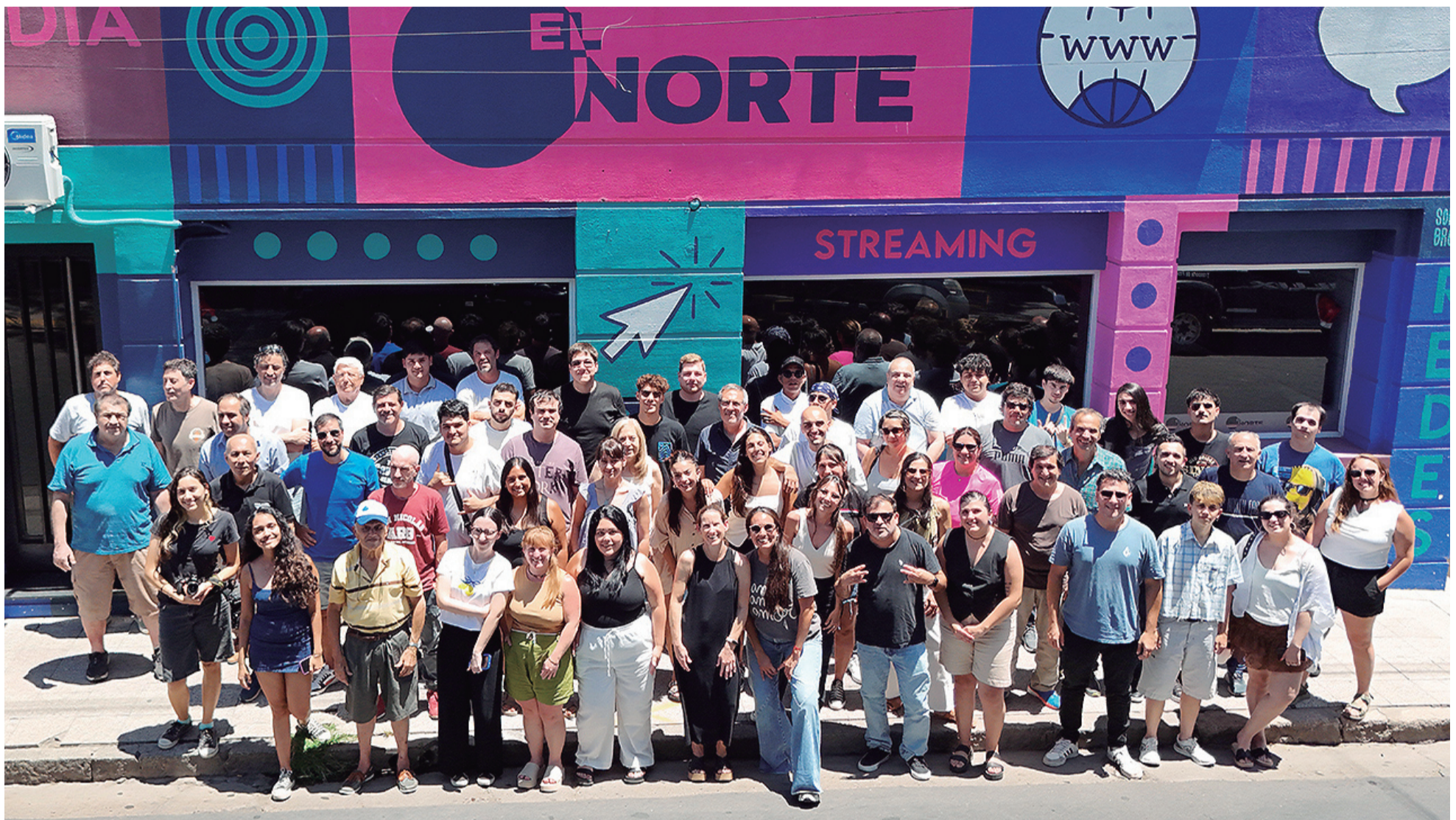
Diario EL NORTE hoy, un siglo después; más de 60 personas trabajando todos los días por cumplir con la misión de siempre: informar.