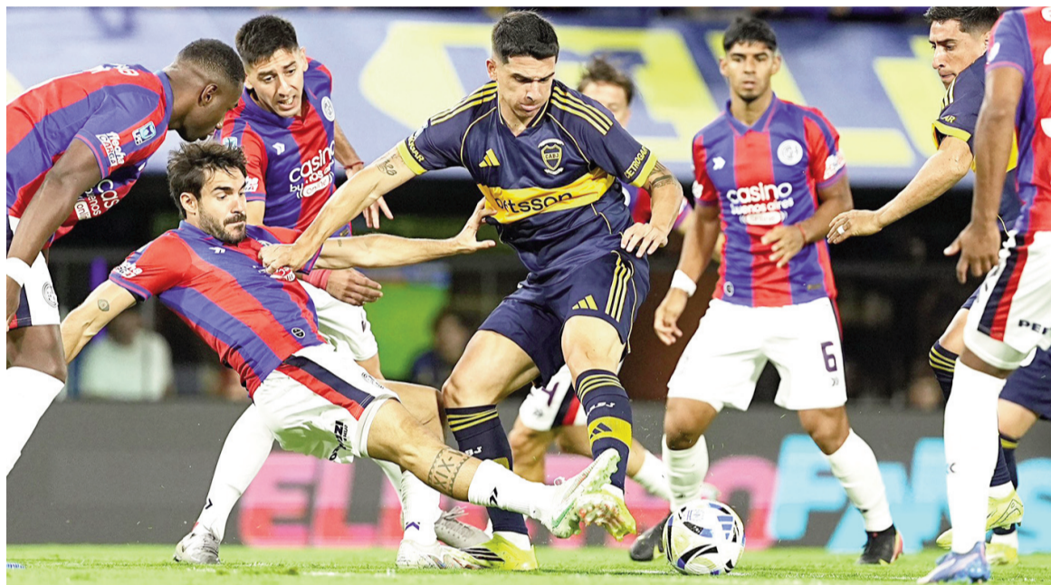
Boca y San Lorenzo repartieron puntos en La Bombonera.