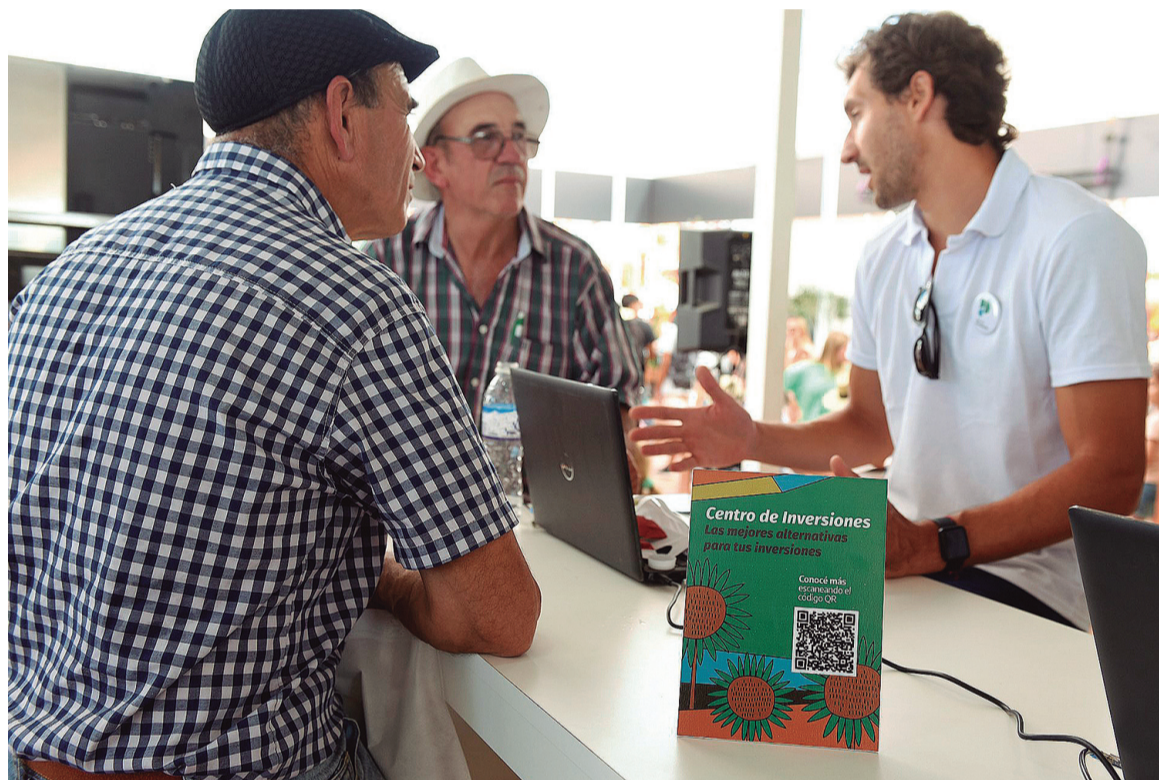
Banco Provincia presentó créditos para el agro con tasas competitivas y líneas digitales para insumos y maquinaria.

Además, a través de Procampo Digital, ofrecerá financiación en dólares desde tasa 0% y en pesos desde 25% para la compra de insumos, con plazos de hasta 360 días. La posibilidad de operar en moneda extranjera amplía