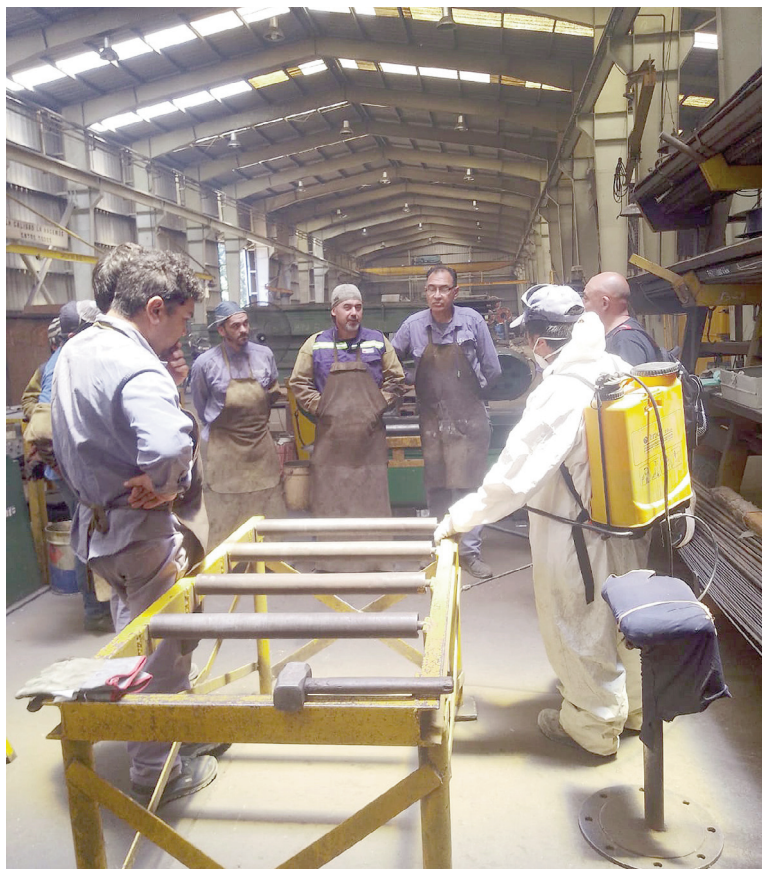
A través de la UOM los trabajadores de Leval denunciaron la situación ante el Ministerio de Trabajo de la provincia de Buenos Aires.

Quienes estén interesados podrán acercarse a la Oficina de Per-