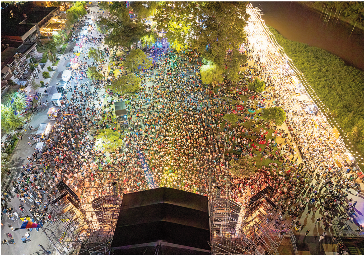
● EVENTOS DE «DESCUBRÍ SAN NICOLÁS» MOVILIZARON A MÁS DE UN MILLÓN DE PERSONAS

En 2007 fue víctima de abuso sexual. Tenía entonces apenas 12 años de edad. Diecinueve años más tarde, la joven rosarina busca resolver un interrogante impostergable: ¿está su abusador tras las rejas o sigue moviéndose libremente? Cree que su atroz victimario puede ser un nicoleño condenado en 2019 por otros hechos de similar naturaleza cometidos en Rosario. Se trata del resonante caso de un locutor sentenciado a 48 años de prisión, una condena inédita para casos sin muertes de por medio. "Quiero estar segura de que no voy a volver a cruzarme con él", expresó la mujer a EL NORTE. Policiales 6