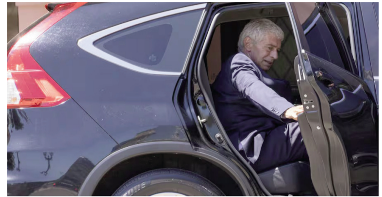
Comenzó la danza de nombres para ver quién podría ser el reemplazante del ministro.