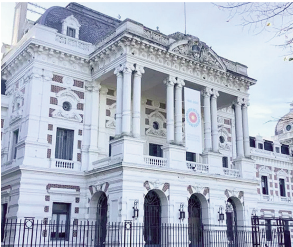
Las transferencias de Nación bajan en la provincia de Buenos Aires.

La dispersión fue de cinco puntos porcentuales entre la jurisdicción con mayor caída y la de menor retroceso. La Ciudad Autónoma de Buenos Aires encabezó las bajas con -8,6%, mientras que Salta mostró la menor contracción, con -3,6%.