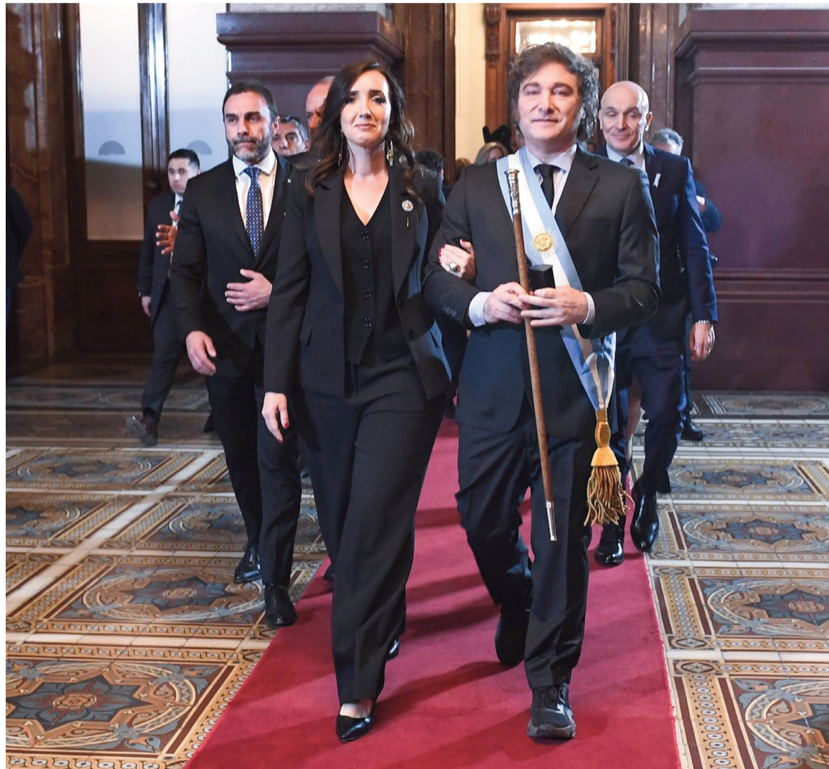
El presidente Javier Milei y la vice Victoria Villarruel, en otros tiempos.

Ese vacío no opaca el apoyo transversal de una decena de mandatarios provinciales que le permiten al Gobierno apoyo para sus proyectos en las dos Cámaras y acercarse a los dos tercios en el Senado, clave para completar los cargos sensibles en la Justicia, uno de los temas a los que hará alusión el Presidente en un dis-