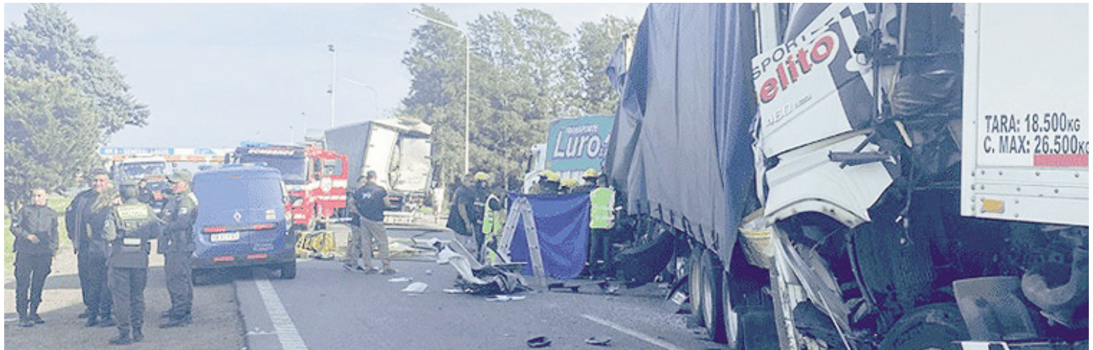
Los vehículos involucrados en el siniestro fatal.

En el choque participaron dos camiones semirremolque, uno marca Volvo y otro Iveco; un ca-