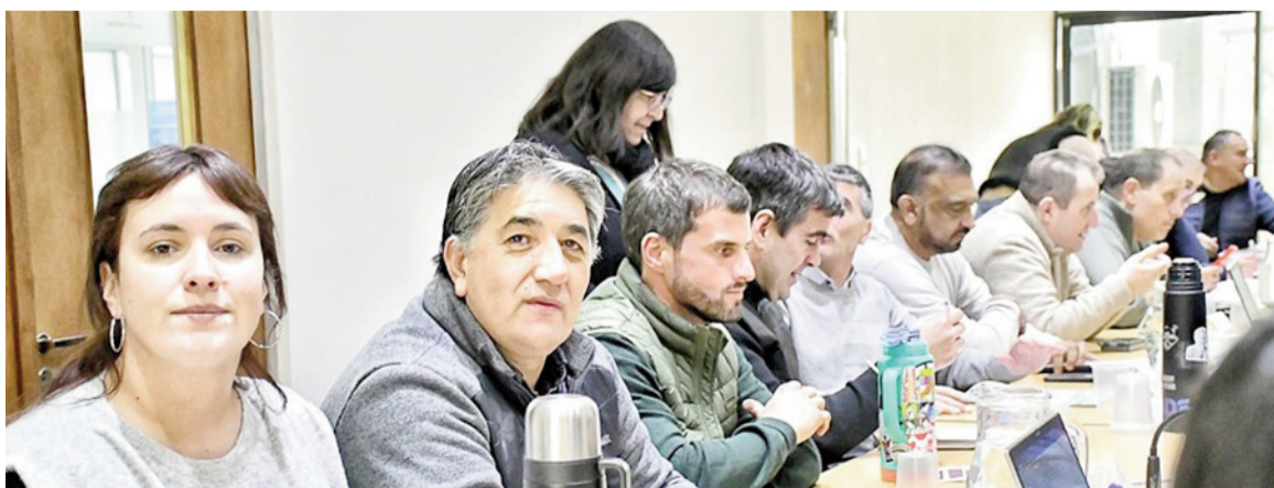
Estatales resolvieron parar a pesar de ser convocados a paritarias.

La decisión fue adoptada en una reunión del Consejo Directivo provincial del sindicato, que definió avanzar con la huelga y una movilización hacia el Puente Pueyrredón mientras exige la continuidad urgente de las negociaciones salariales para evitar una mayor pérdida del poder adquisitivo de los estatales bonaerenses.