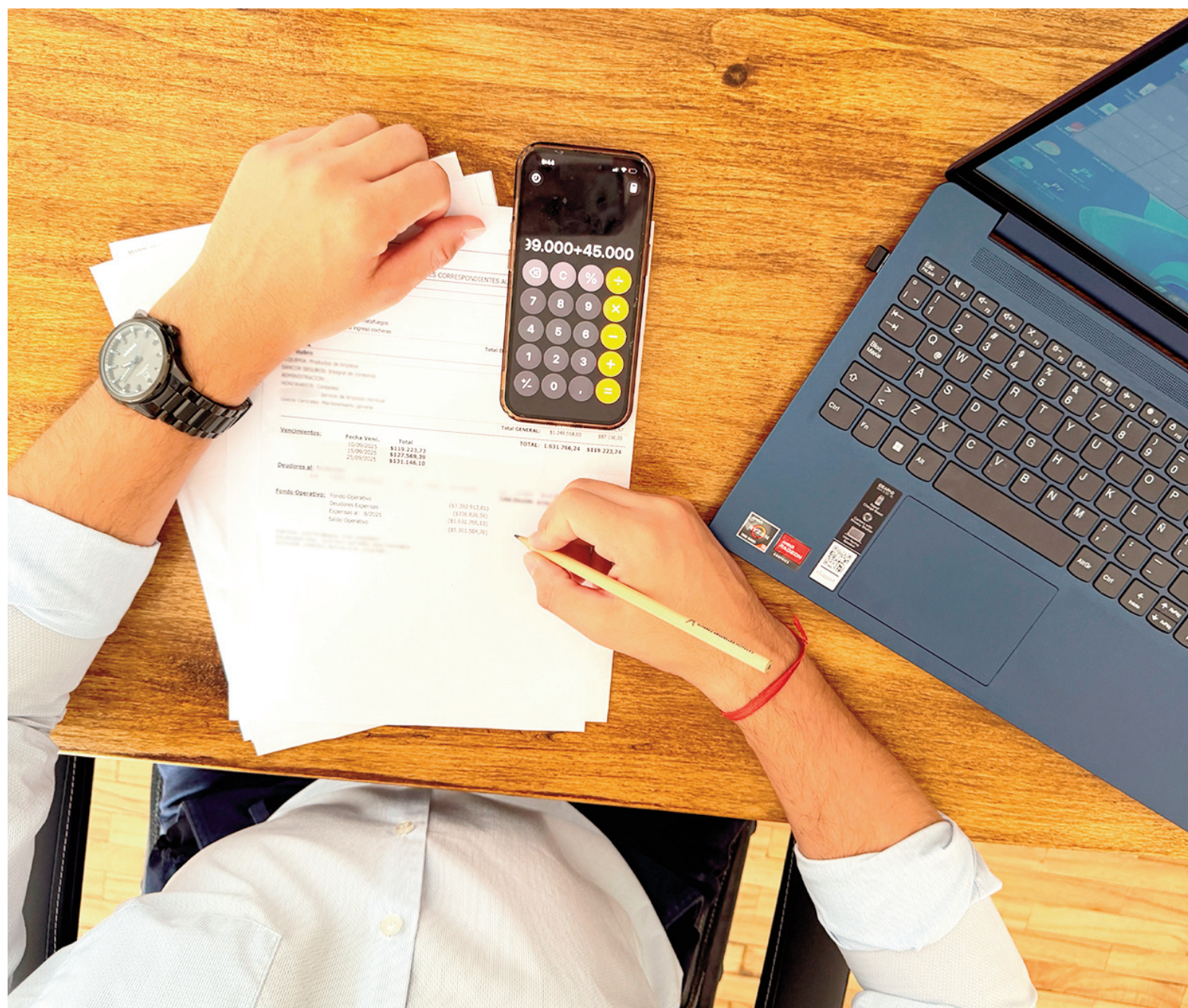
El aumento de costos laborales, la quita de subsidios en servicios públicos, los seguros y el mantenimiento general impulsan los incrementos.

“Cuando las expensas no se abonan en término, la administración no cuenta con recursos para financiar esos faltantes. Los gastos deben cumplirse en tiempo y forma”, explicaron desde una de las firmas consultadas. En la práctica, esto implica que los atrasos de algunos vecinos terminan afectando a quienes sí cumplen, ya que el consorcio debe sostener su