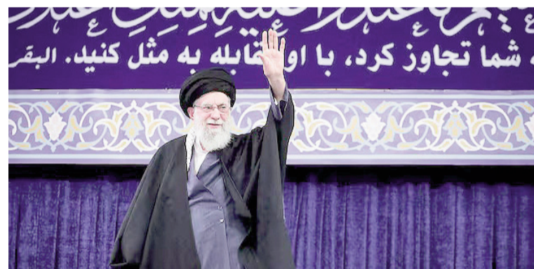
El ataque a Irán dejó la muerte del líder Alí Khamenei.

nistro israelí, Benjamin Netanyahu, afirmó que la ofensiva busca eliminar lo que definió como una “amenaza existencial” para su país. El dirigente señaló que la operación fue coordinada con Washington y aseguró que el objetivo es debilitar las capacidades militares del régimen iraní, además de generar condiciones para un eventual cambio político en la república islámica.