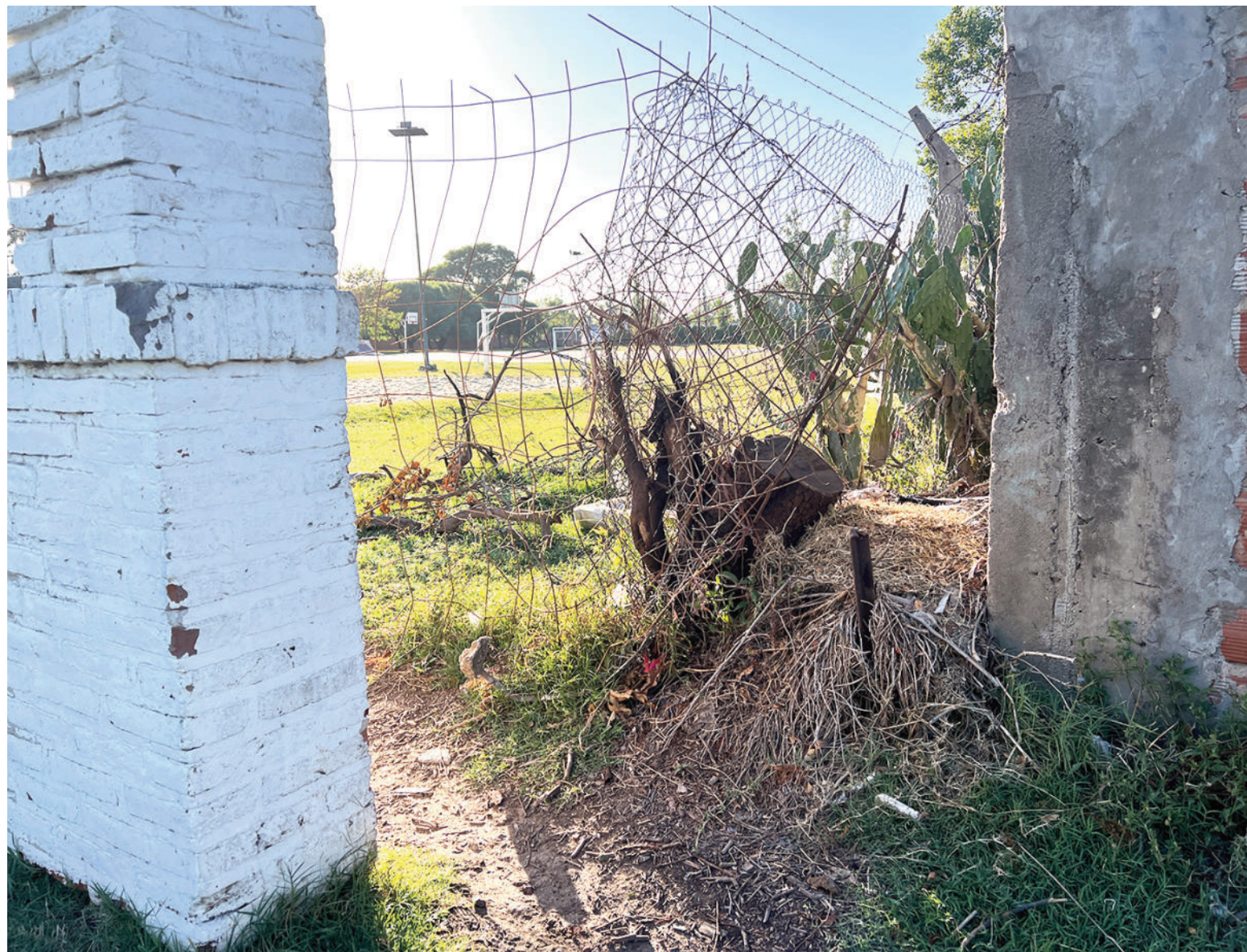
Delincuentes rompieron el alambrado perimetral del CEDyC, para ingresar a robar y vandalizar el predio de zona norte.

El Cedyc del barrio Moreno volvió a ser blanco de robos y destrozos de sus instalaciones. Eso mismo había ocurrido tiempo atrás en el Polideportivo de Garetto. Lo robado se repone y lo roto se arregla, sólo para que al poco tiempo vuelva a ser un objetivo de los delincuentes. Los establecimientos escolares también padecen el repudiable accionar de estas personas incapaces de respetar siquiera los bienes que son de uso comunitario. ¿Hasta dónde puede llegar el desprecio por lo público? Local 3