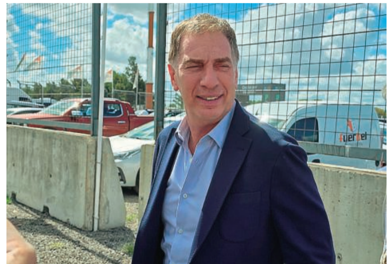
El ministro del Interior, Diego Santilli, dijo presente en Expoagro 2026.

Por otra parte, Santilli se refirió a la posibilidad de nuevas reducciones impositivas para el sector y remarcó que la orientación del Gobierno es evidente. "Lo que se viene es una política clara del presidente de bajar impuestos. Obviamente, todo en su medida, pero esa es la posición del presidente, una posición clara y contundente", indicó.