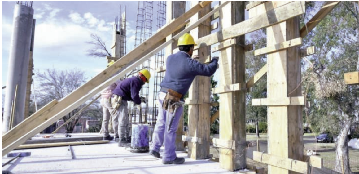
La reforma laboral tuvo su primera traba judicial.