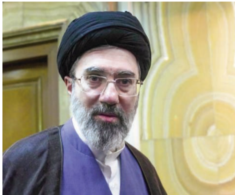
El nuevo líder supremo de Irán, Mojtaba Khamenei.

Jamenei expresó sus condolencias por el “desgarrador martirio” de su padre, el ex Líder Supremo Ali Jamenei, sigue el informe de Xinhua. Y afirmó que se enteró de la decisión de la Asamblea de Expertos de ele-