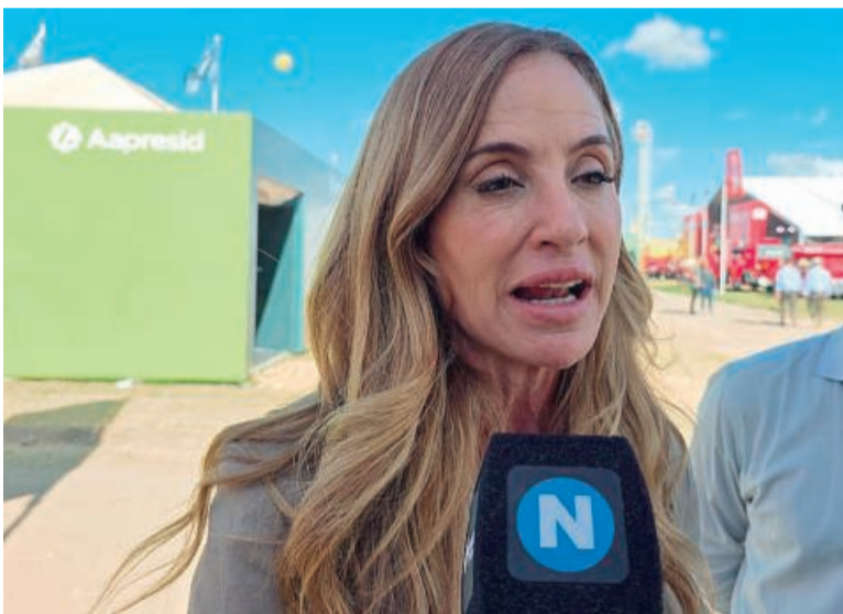
Victoria Tolosa Paz, diputada nacional.

“Las industrias se expresan en esta exposición que ya es un clásico argentino, donde año a año van atrayendo más público y donde también hay un contacto con cada una de las localidades que tienen esta impronta de corte productivo. Necesitamos tener una política pública que construya certidumbre”, sostuvo a EL NORTE la diputada nacional Victoria Tolosa Paz.