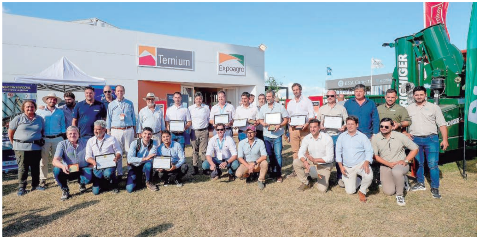
El certamen distinguió innovaciones de empresas de distintas regiones del país.

Los ganadores de la medalla de oro fueron Computing Management S.R.L., Drops Agro y Crucianelli (cliente de Ternium). Las medallas de plata distinguieron los desarrollos de Crucianelli (cliente de Ternium) y de Don Osvaldo, mientras que la medalla de bronce fue otorgada a Agroindustrias y a Servicios G y G S.R.L. Además, se