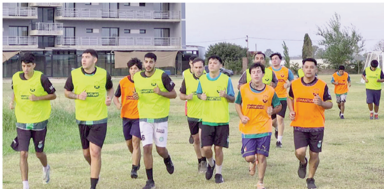
Argentino Oeste se entrena en el complejo "Estrella de Belén".

«El objetivo es el mismo que el del año pasado: tratar de pelear en todos los frentes. Tenemos que mejorar lo que hicimos el año pasado; ya con una base de jugadores que vienen jugando, creo que va a ser un poco más fácil. De igual