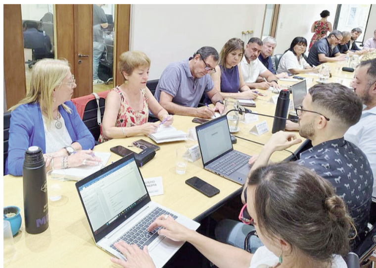
Docentes y estatales rechazaron el aumento ofrecido por Kicillof.

fue el turno de los estatales. El gobierno bonaerense realizó la misma propuesta de suba salarial del 2% que también fue rechazada por los sindicatos. Desde ATE explicaron que la oferta fue declarada como “insuficiente” junto “al resto de los