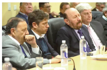
Gobernadores peronistas buscan frenar las reformas.

A poco del inicio del debate en el Congreso que, según la senadora libertaria Patricia Bullrich tiene un 95 por ciento de adhesión, el cosecretario Sola expuso que la intención de la reunión con gobernadores es “que nos entendieran y escucharan” porque “no se tiene que discutir solamente las cuestiones de las coparticipaciones”. En diálogo con Batalla Cultural, valoró haber tenido “muy buenas recepciones de muchos”.