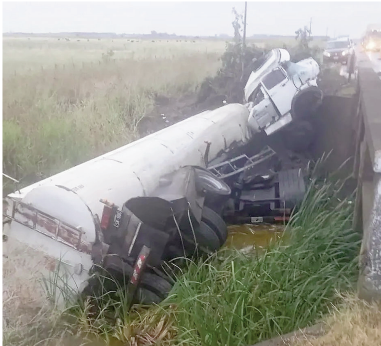
El chofer murió al llegar al Hospital San José. LA OPINIÓN

tido en el lugar y trasladado de manera preventiva por una ambulancia del servicio de emergencias al Hospital San José de Pergamino. Sin embargo, pese a los esfuerzos médicos, se confirmó su fallecimiento poco después de su ingreso al centro de salud.