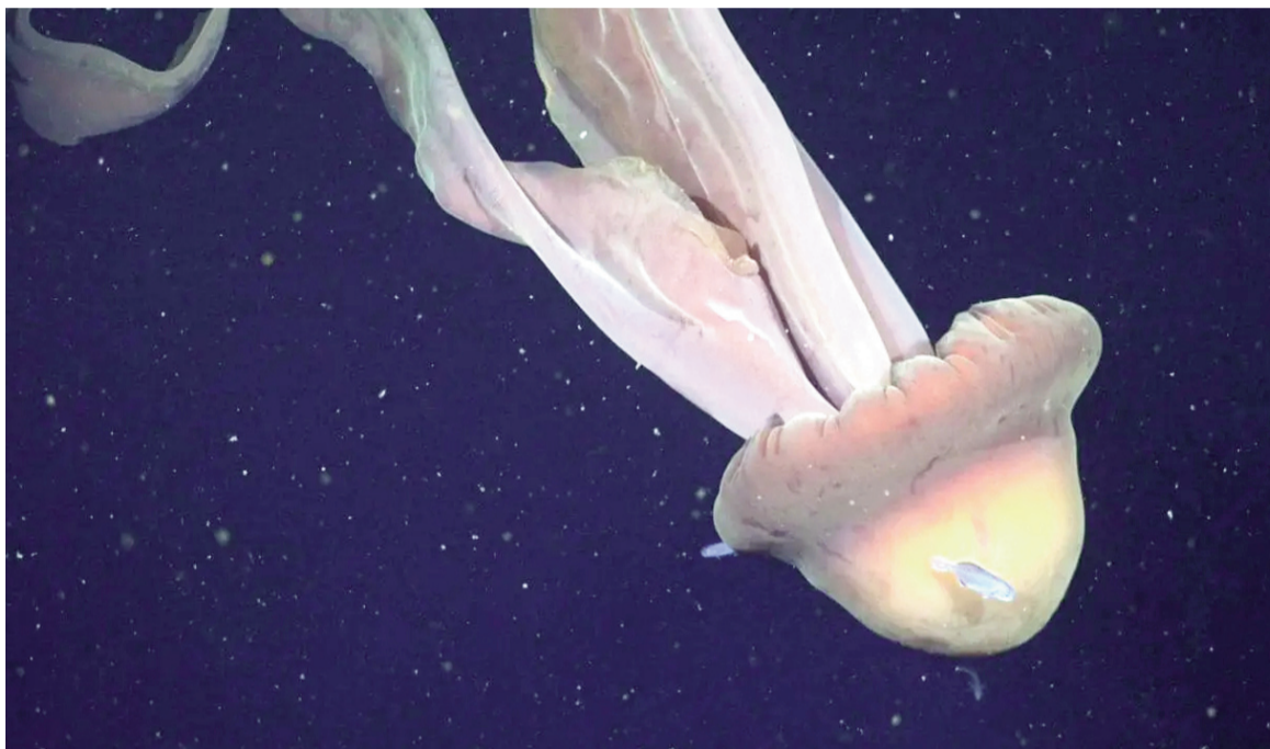
Se la conoce como “medusa fantasma de aguas profundas”.

tasma de aguas profundas, extremadamente rara, que puede crecer hasta dimensiones similares a las de un autobús escolar”, explicaron los investigadores en un comunicado.