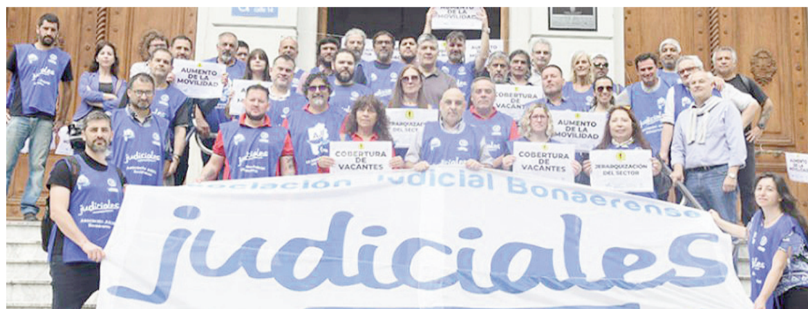
Los judiciales bonaerenses paran el próximo lunes.

Otros reclamos giran en torno a un aumento salarial y los si-