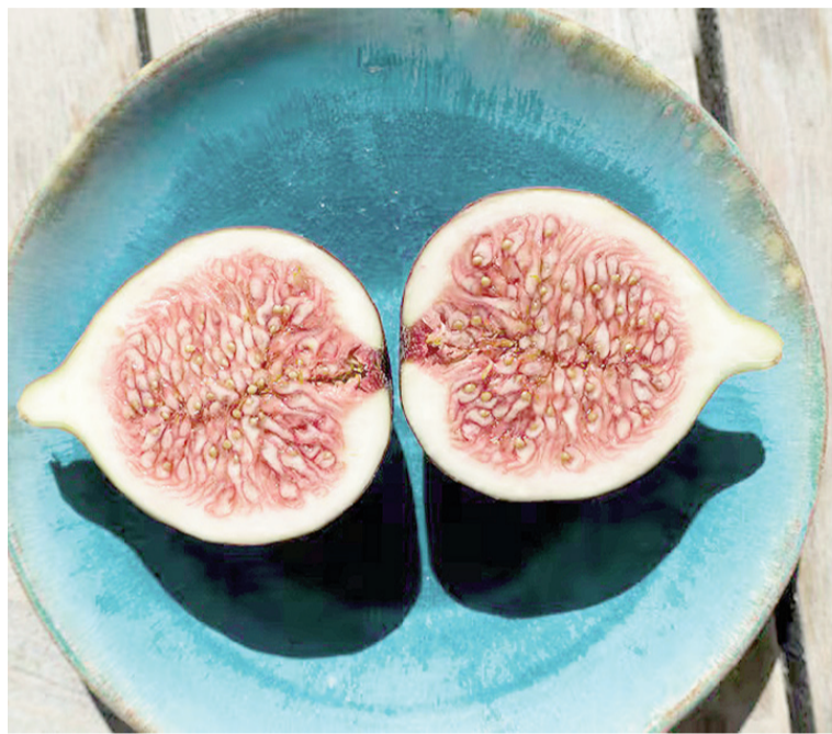
Frescos, aportan cerca de 74 calorías cada 100 gramos y un alto contenido de agua.

Cubiertos de una piel fina que da color a su exterior y varía entre el verde, morado y negro, su pulpa es carnosa, de un dulce que se intensifica conforme madura. Son estacionales y se pueden encontrar entre los meses de agosto y septiembre en el hemisferio norte, o entre febrero