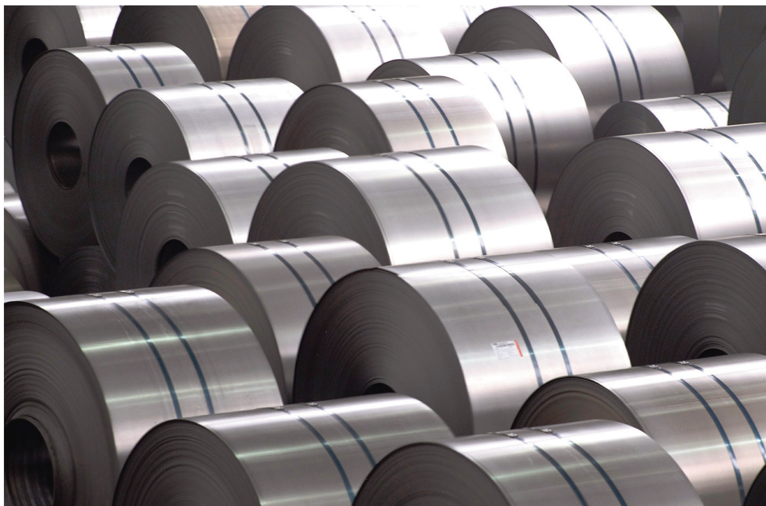
Los siderúrgicos consideraron que “el país transita una fase de normalización monetaria y fiscal con equilibrio financiero sostenido”.

En cuanto a las perspectivas a mediano plazo, trazadas para el primer semestre de 2026, el informe señaló: “Con la estabilización de la economía, se espera que el crédito privado comience a ser el motor de la recuperación del consumo y que las inversiones en el agro, la energía y la minería puedan dinamizar la actividad en la cadena de valor metalmeccánica asociada. La eficiencia de costos junto con la baja de la carga tributaria en todos los niveles del