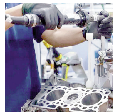
La industria de autopartes sufrió una fuerte caída en 2025.

En el segmento de mercado de reposición, al considerar la venta de combustible como un indicador aproximado del nivel de actividad del mismo, se observó un aumento del 1,2% interanual, y del 8,3% con relación a noviembre de 2025.