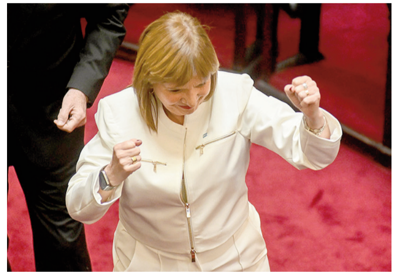
Patricia Bullrich se prepara para darle al Gobierno otra doble victoria.

Además, el Gobierno tuvo que definir el presupuesto que destinará a la reforma, unos $ 23.000 millones, ante las presiones de los gobernadores que necesitarán fondos para los cambios estructurales que de-