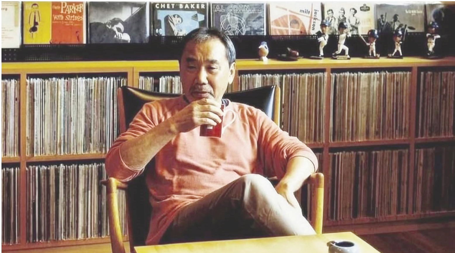
Haruki Murakami, de las novelas de ficción al itinerario personal de la mano del jazz y la música clásica.

El autor ha dicho en más de una ocasión que le debe al jazz su estilo