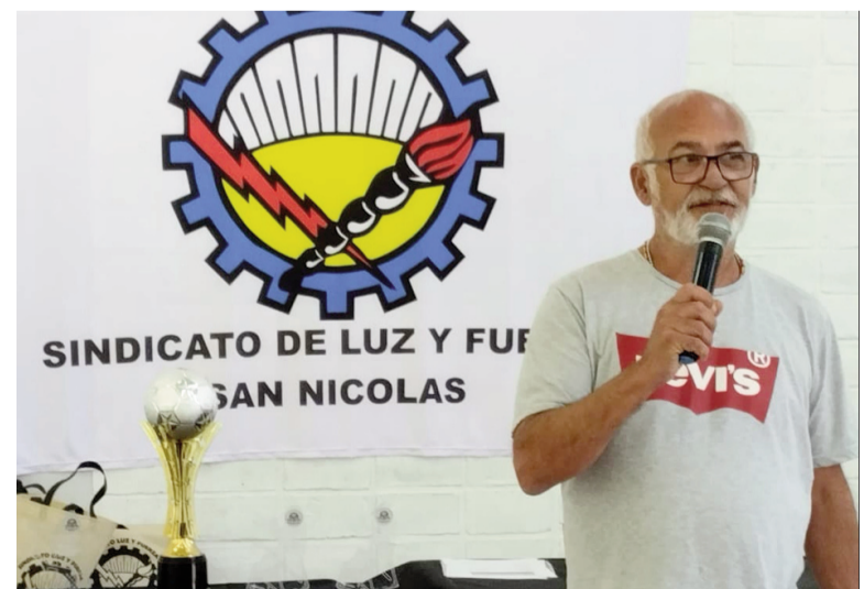
Noguera había asumió interinamente la conducción del gremio tras el fallecimiento de Guillermo Mansilla.

La primera sede del Sindicato de Luz y Fuerza San Nicolás funcionó en Ameghino 67. Posteriormente se trasladó a Pellegrini 68, para llegar a mediados de 2015 a Garibaldi 221 donde funciona actualmente.