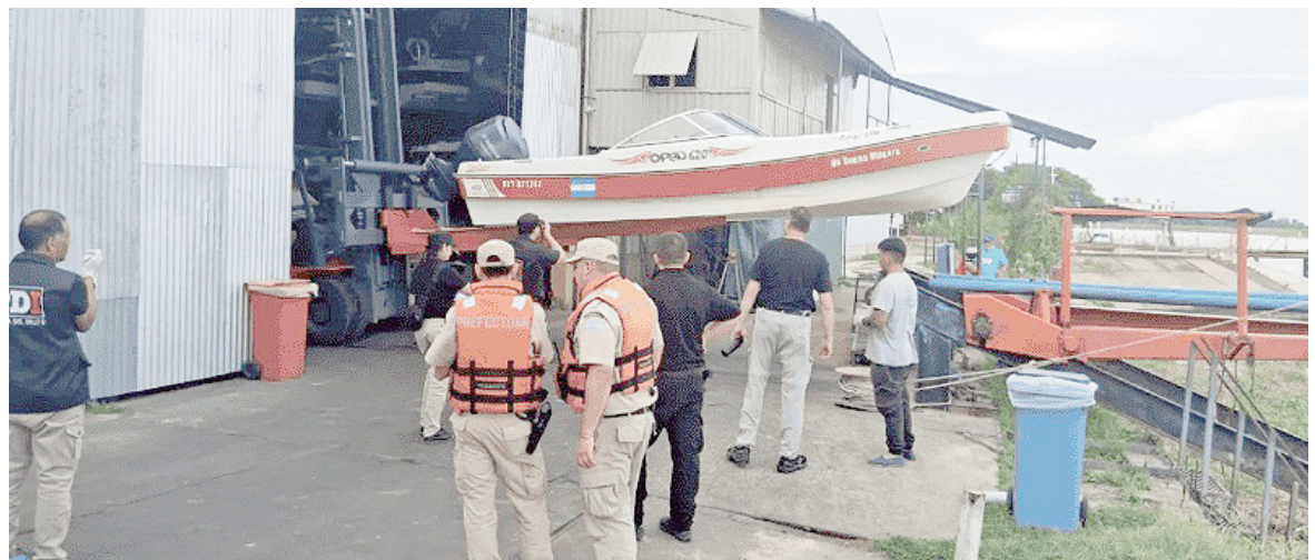
La embarcación que había quedado a la deriva.

A las 5.55 fue visto navegando lentamente aguas arriba frente a una casilla ribereña. Minutos después de las 6, otro testigo lo observó en su