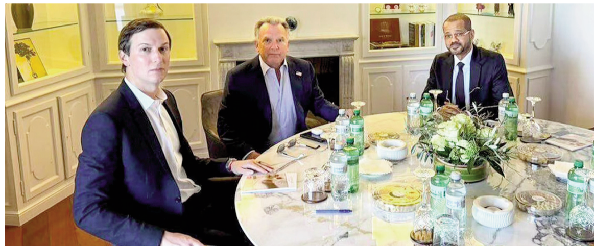
Referentes de ambos países reunidos en Ginebra.

Ambos países sostendrán conversaciones a nivel técnico la próxima semana en Viena. El argentino Rafael Grossi participó en las negociaciones.