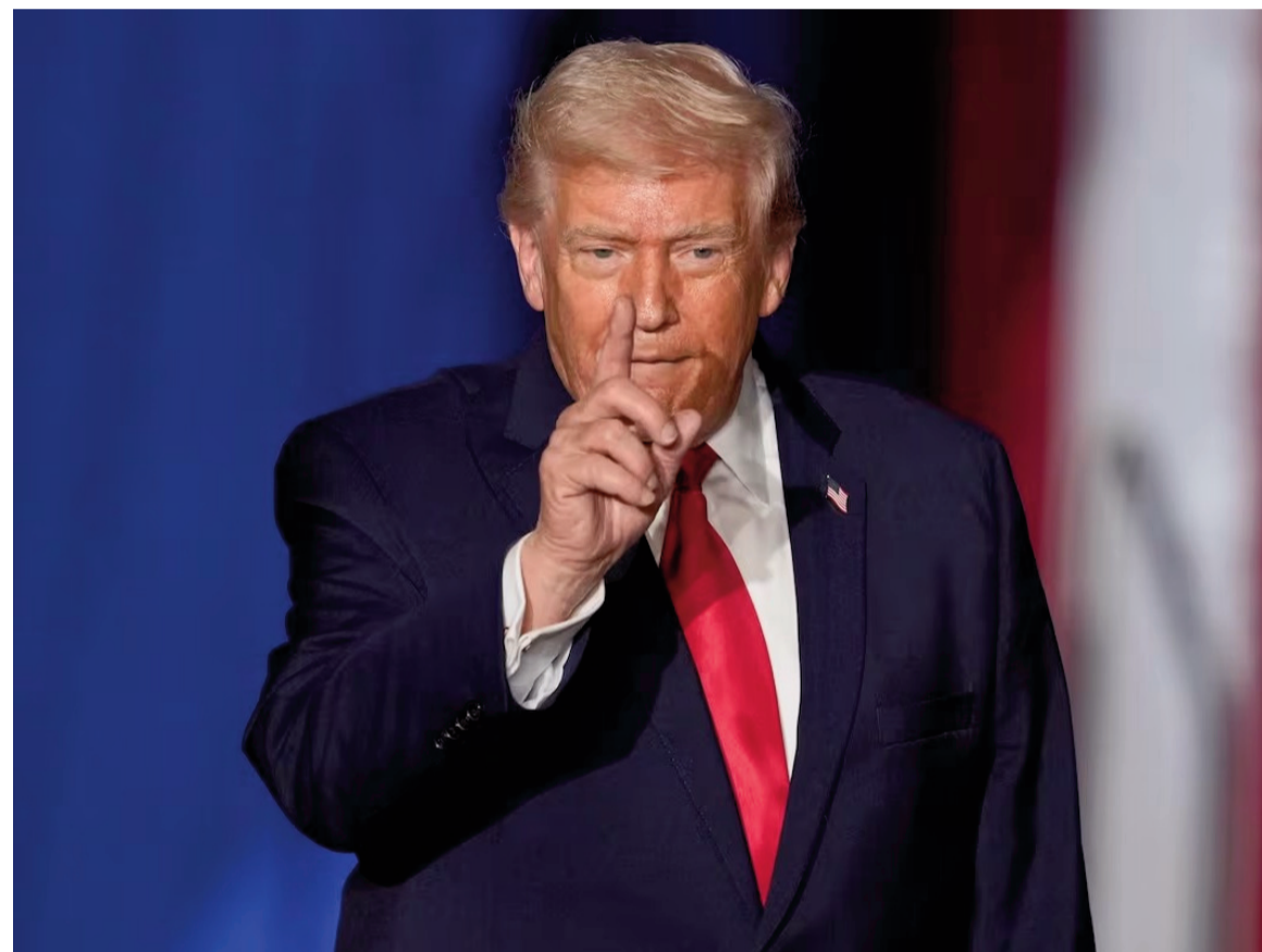
Trump decidirá un eventual ataque si no hay acuerdo nuclear.

El ejército estadounidense está preparado para empezar el ataque este mismo fin de semana.