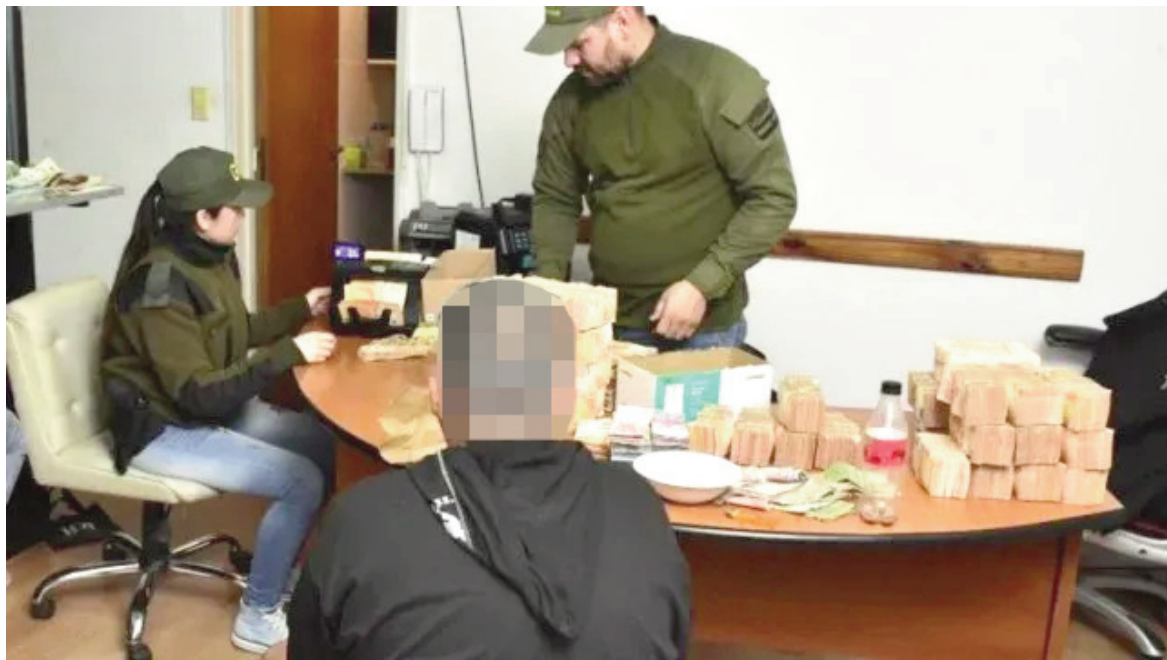
Gendarmería Nacional había arrestado a los sospechosos en la provincia de Buenos Aires.

● La fiscalía ha afirmado que los integrantes de la organización traficaban cocaína desde países limítrofes, distribuyéndola en varios puntos de la Ciudad de Buenos Aires y el conurbano.