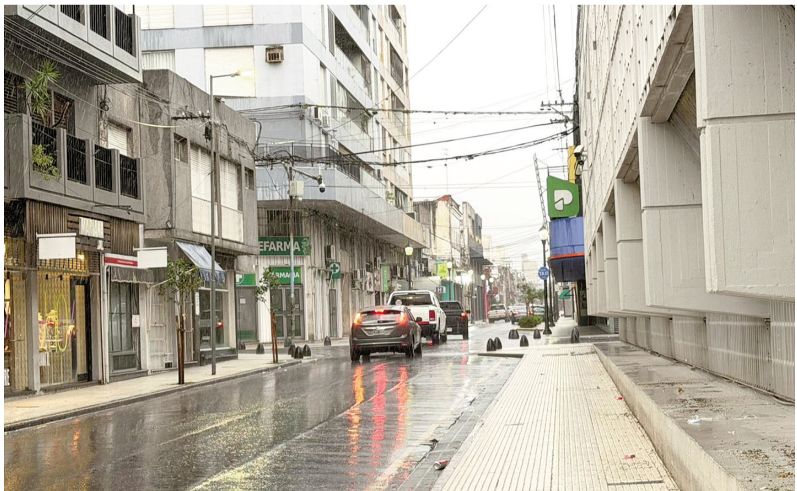
El paro de la UTA de ayer jueves vació de colectivos las calles de San Nicolás.

“El Ministerio de Capital Humano informa que, a través de la Secretaría de Trabajo, Empleo y Seguridad Social de la Nación, ha intimado a los gremios La Fraternidad y la Unión Tranviarios Automotor (UTA) a abstenerse de llevar adelante toda medida de acción directa que tuvieran previsto implementar, en violación a las normas legales que rigen la Conciliación Laboral Obligatoria, estando dicha instancia en pleno trámite. La adopción de cualquier medida de fuerza configuraría un incumplimiento de la conciliación laboral obligatoria oportunamente dispuesta y actualmente en