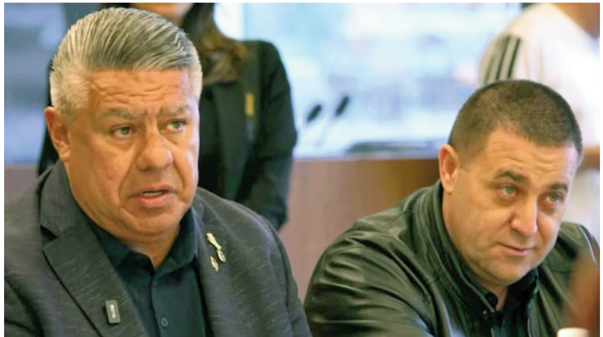
El presidente de la AFA, Claudio Tapia y el tesorero Pablo Toviggino.

Según la acusación, los importes retenidos se desglosan de la siguiente manera: más de $663 millones en IVA; casi $2.000 millones en Ganancias; más de $8.016 millones bajo el régimen del artículo 79; y $8.675 millones en aportes previsionales. Julio de 2025 apa-