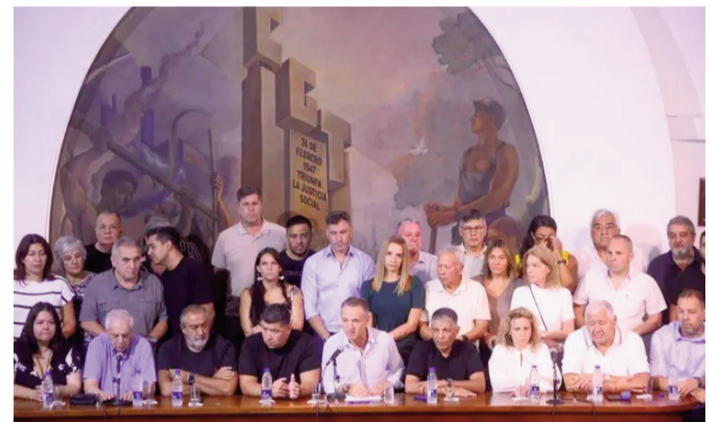
La CGT destacó el acatamiento al paro convocado.

100 años, en derechos individuales, en derechos colectivos y en una búsqueda que tiene como corazón la transferencia de recursos de los trabajadores hacia el sector empleador», confrontó por su parte Sola, que es-