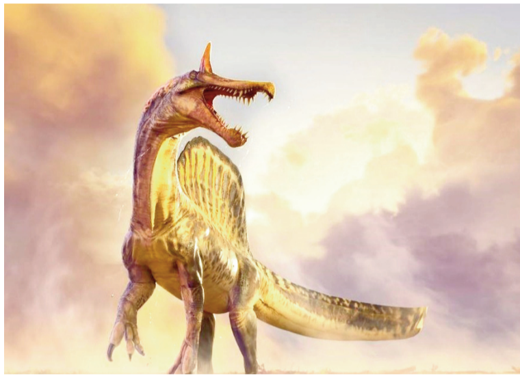
Representación artística del Spinosaurus mirabilis.

Se trata del primer descubrimiento de un Spinosaurus en más de cien años. Hasta ahora, los restos conocidos de ese dinosaurio gigante —considerado uno de los más grandes que caminaron sobre la Tierra— habían aparecido en zonas cercanas a antiguas costas. Por eso, durante años ganó fuerza la idea de que era un animal fuertemente adaptado a la vida acuática, capaz incluso de bucear en mar abierto para cazar. El nuevo hallazgo, en pleno continente africano, choca