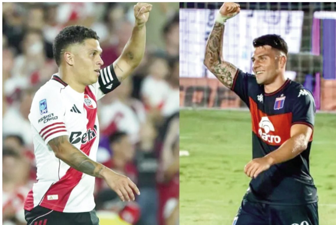
El equipo de Gallardo buscará ganar para ser líder.

El Millonario será local ante el Matador en duelo de escoltas de la Zona B, mientras que Racing chocará ante Argentinos en el Cilindro. Además, Aldosivi se medirá ante Central en Mar del Plata, Newell's enfrentará a Defensa y Justicia en el Parque Independencia y, en Córdoba, jugarán Belgrano y Banfield.