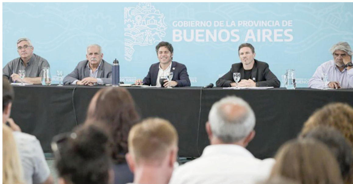
El gobernador se sigue encontrando con distintos sectores productivos.

Ante más de 200 personas, el gobernador volvió a cuestionar el rumbo del gobierno: "Atravesamos una situación económica muy compleja en la cual, después de dos años, la actividad y los salarios siguen planchados. Si algo tenemos en claro es que el modelo de país del Gobierno nacional no es federal ni productivo y no le sirve al comercio ni al turismo".