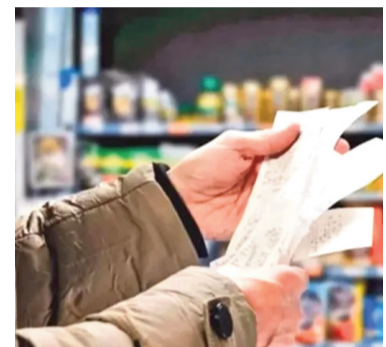
Suba importante de los alimentos durante febrero.

de la inercia inflacionaria. Si esta tendencia se sostiene en lo que resta del mes, sumará una fuerte presión al IPC mensual, que ya de por sí sentirá el impacto de los fuertes aumentos en las tarifas por la quita de subsidios (aunque no se reflejará en toda su magnitud por el bloqueo del nuevo índice).