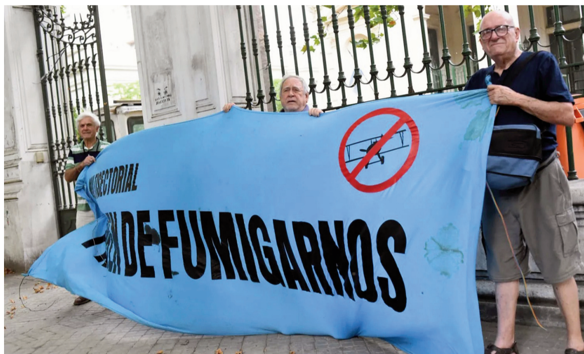
Este jueves se desarrolló la segunda audiencia. A lo largo del mes habrá tres jornadas más: el jueves próximo, 12 de febrero, y los días 24 y 25.