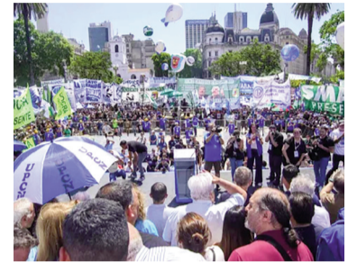
La CGT apuesta a una movilización «fuerte» frente al Congreso.