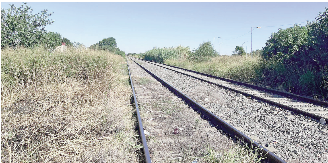
Un cadáver fue hallado sobre las vías del ferrocarril.

Al arribar al lugar, los efectivos constataron que los restos se encontraban en avanzado estado de descomposición y presentaban indicios de llevar varios días en el sitio. La víctima tenía 35 años. Según las primeras actuaciones, no se habrían detectado elementos que indiquen la hipótesis de un suicidio,