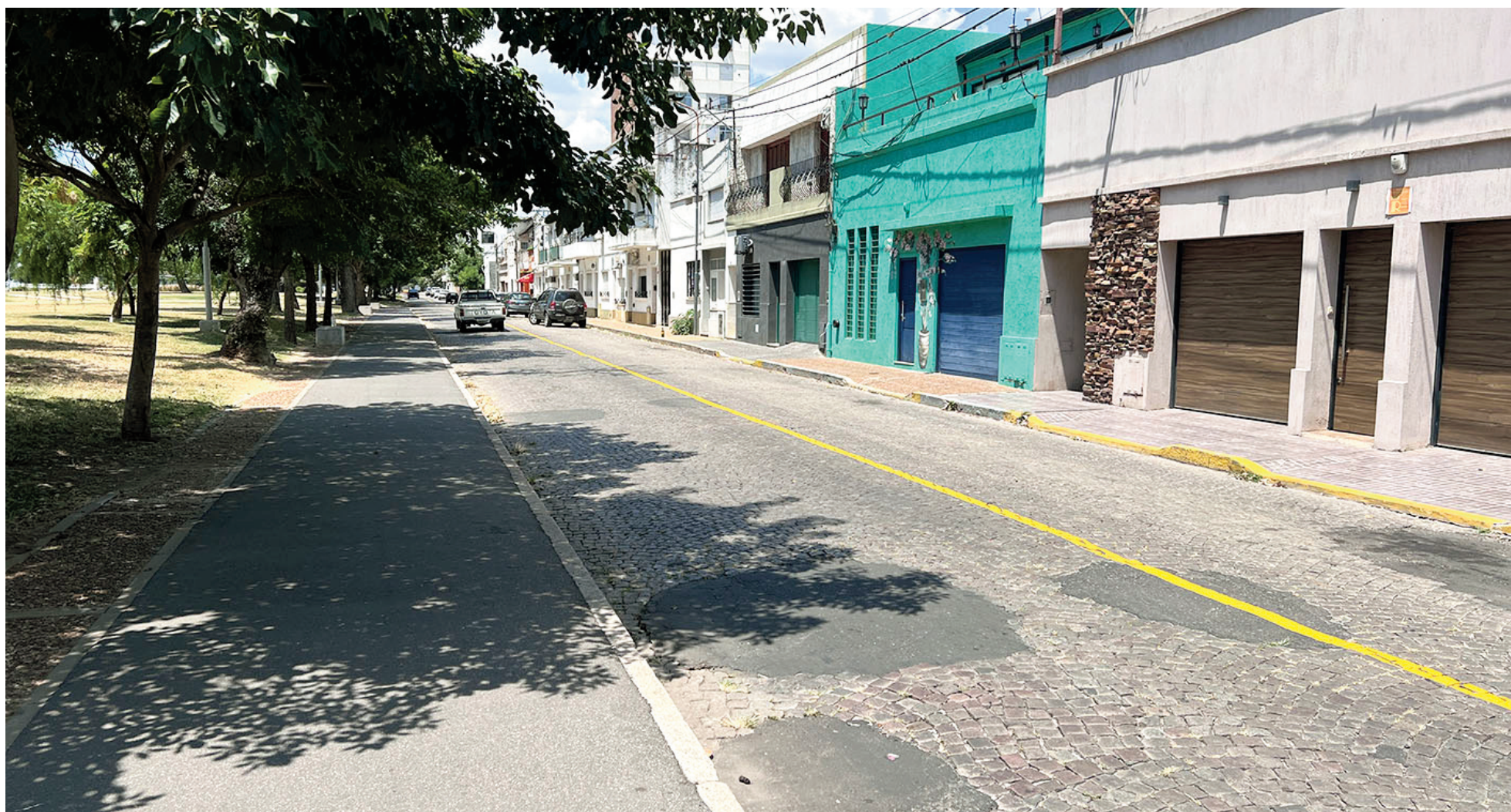
De cara a las nuevas disposiciones, el municipio avanzó con las demarcaciones correspondientes sobre las calles Colón y Aguiar.