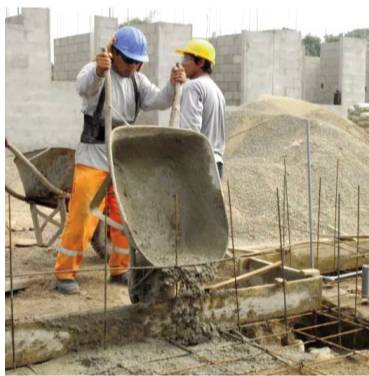
El sector de la construcción creció el último año.

En el desglose de compras de insumos para la construcción, los indicadores mostraron una mayoría de bajas. En enero el Índice Construya (IC), que mide la evolución de los volúmenes vendidos al sector privado de los productos para la construcción que fabrican las empresas que lo conforman, registró una caída del 11,6% mensual desestacionalizada, al tiempo que se ubicó 1,1% por debajo de enero 2025.