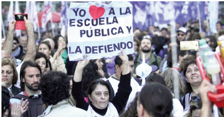
Los docentes van al paro el 11 de febrero.

La medida, impulsada por el Frente de Unidad Docente Bonaerense (FUDB), que agrupa a los principales sindicatos de maestros, se enmarca en el rechazo contundente al proyecto de reforma laboral que impulsa el gobierno nacional y que se discutirá justamente ese día en el Congreso de la Nación. Para los dirigentes gremiales, la protesta sintetiza dos frentes de reclamo que tensionan al oficialismo. Por un lado, la demanda de una recomposición salarial que compense la pérdida de poder adquisitivo de los últimos meses. Por el otro, la crítica al paquete de cambios laborales que impulsa el gobierno libertario. En La Plata, las conversaciones entre los representantes docentes y el Ejecutivo