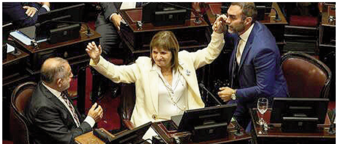
Patricia Bullrich, el alfil libertario, celebró las victorias oficialistas en el Congreso.

De ese modo, el gobierno cerró una jornada con dos triunfos, que se suman a otras tres victorias que obtuvo el jueves. El gobierno ratificó el acuerdo de libre comercio entre el Mercosur y la Unión Europea (UE), consiguió la media sanción a la reforma de la ley de glaciares y aprobó