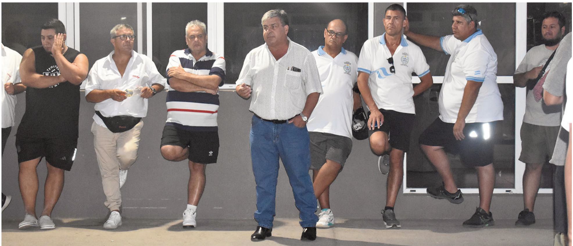
En la última audiencia paritaria la UTA dejó en claro que sin acuerdo salarial retomará la medida de fuerza anunciada oportunamente.

En el marco de la paritaria para los colectiveros de todo el interior del país, la Unión Tranviarios Automotor (UTA) ratificó que adoptará medidas de fuerza una vez concluida la conciliación obligatoria dictada por el Gobierno. El nuevo encuentro oficial se producirá el jueves de la semana próxima. Empresarios piden a las provincias y los municipios que adopten medidas para “reestablecer la ecuación económico – financiera” de los servicios de transporte locales.