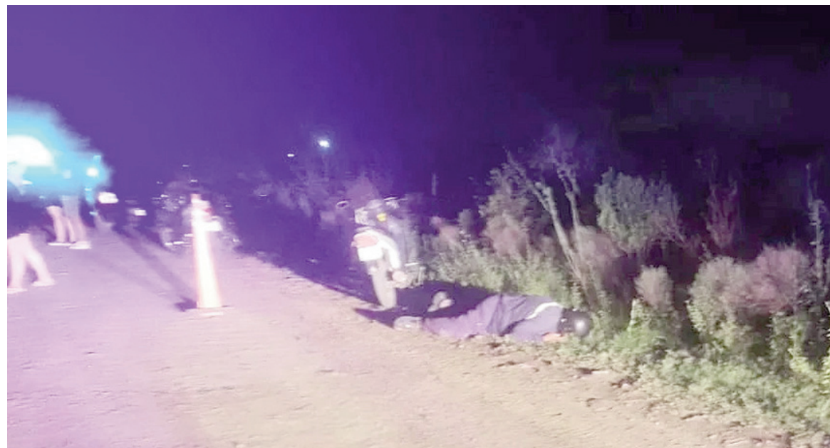
La víctima fue un hombre de 58 años.

El cuerpo estaba en inmediaciones de ruta 18 y calle Crespo. Según trascendió, junto al cuerpo de la víctima la policía halló su moto