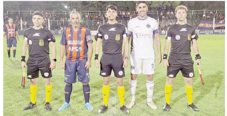
En el Barrio no hubo fútbol ni goles.