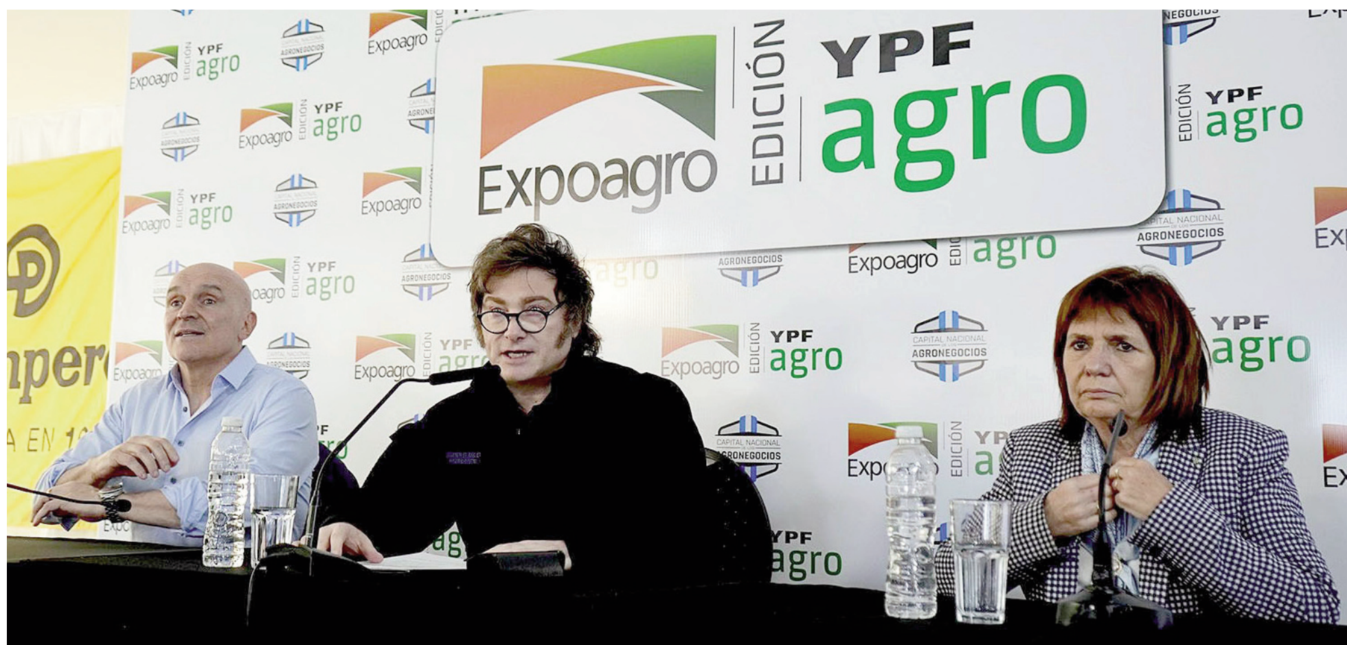
“A medida que se siga consolidando el sendero virtuoso, continuaremos bajando las retenciones hasta que lleguen a cero”, prometía Milei en Expoagro 2025.

Productores agropecuarios albergan la esperanza de que la inminente nueva edición de Expoagro sea la plataforma elegida por el Gobierno nacional para anunciar nuevas bajas en las retenciones a los granos. Sin embargo, desde la Sociedad Rural Argentina, Nicolás Pino descartó la posibilidad de que el presidente Javier Milei comunique una medida de ese tipo desde el Predio Ferial y Autódromo San Nicolás. La misma advertencia fue lanzada por el economista Salvador Di Stefano.