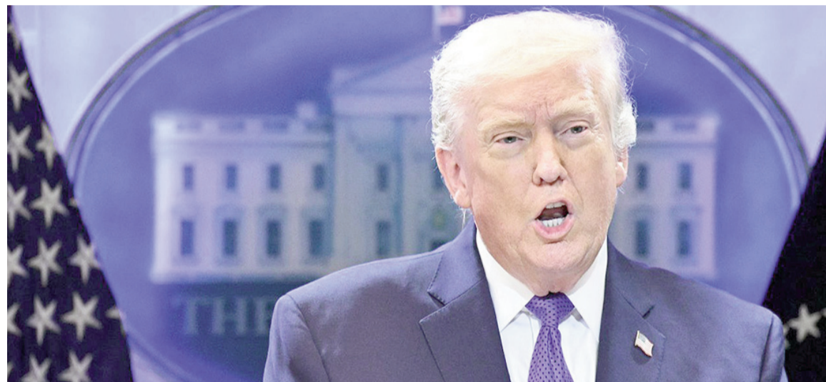
Trump no descarta tomar "amistosamente" a Cuba.

El mandatario no precisó cómo sería esa "toma de control" ni ofreció un cronograma para alguna acción potencial contra la isla.