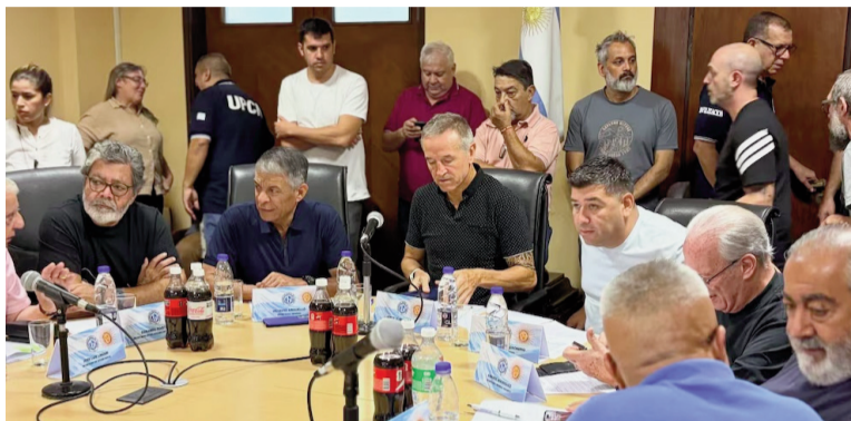
La CGT define la estrategia legal contra la reforma laboral.

Ese antecedente, sin embargo, no significa que los asesores legales de la CGT piensen en seguir el mismo camino: en este caso, el eje de la denuncia es una ley sancionada por ambas cámaras parlamentarias y no un decreto de necesidad y urgencia, por lo que no tiene peso, como interpretó la justicia laboral cuando