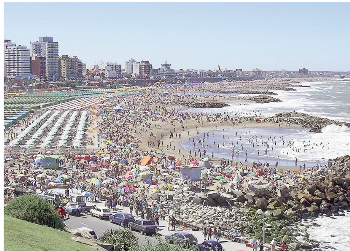
Mar del Plata más caliente.

El verano 2026 marcó un antes y un después en la costa: el mar en Mar del Plata alcanzó la temperatura más alta en 20 años, con picos de 22,9 °C en enero y 23,4 °C en febrero en Punta Mogotes, siempre por encima del promedio histórico.