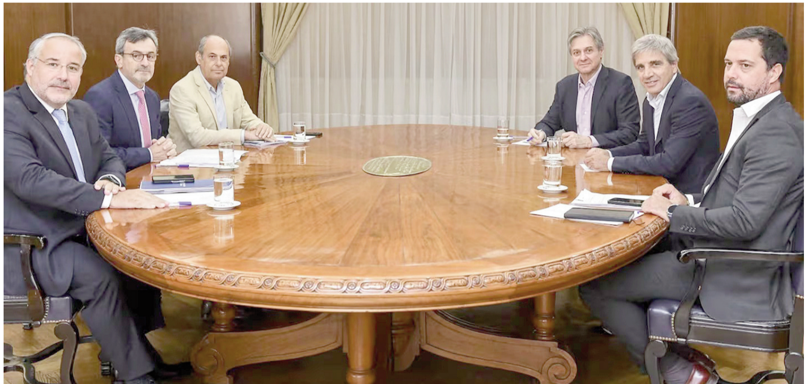
El ministro de Economía, Luis Caputo, recibió a la cúpula de la UIA.

Caputo aclaró que existe una “gran relación con la UIA, y continuaremos trabajando juntos para que la gente tenga finalmente acceso a mejores productos, a mejores precios”. El encuentro se produjo en el marco del fuerte retroceso de la actividad manufacturera y de tensiones dentro del