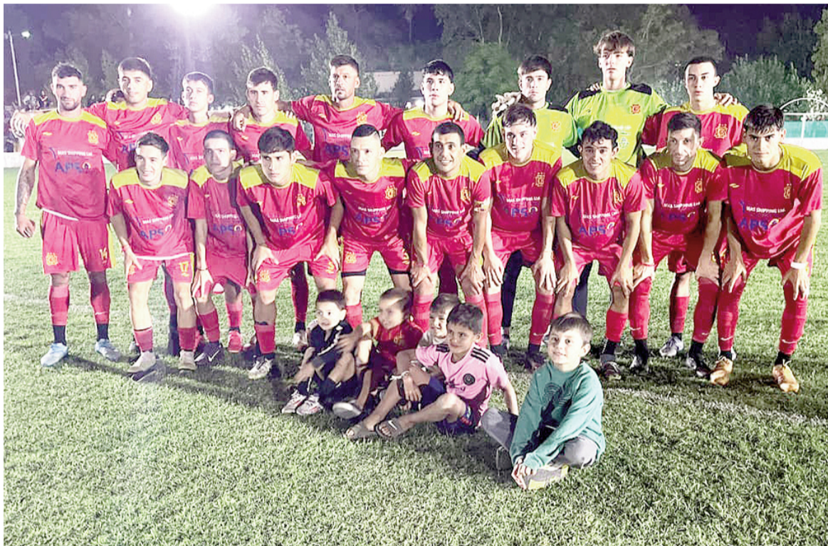
El conjunto de Emiliano Capella fue superior y se impuso con justicia. ÁLVARO RODRÍGUEZ

El Rojo de calle Pellegrini derrotó por 3 a 1 a Defensores Unidos de San Pedro en el camping y selló su pasaje a la próxima instancia. Fabricio Lenci fue el autor de los tres goles del equipo nicoleño.