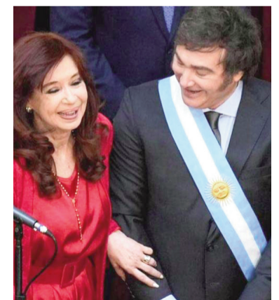
El Gobierno apeló el beneficio de Cristina.

Ayer se conoció la resolución por la que los jueces de la Cámara revocaron una resolución y avalaron que hasta que se re-