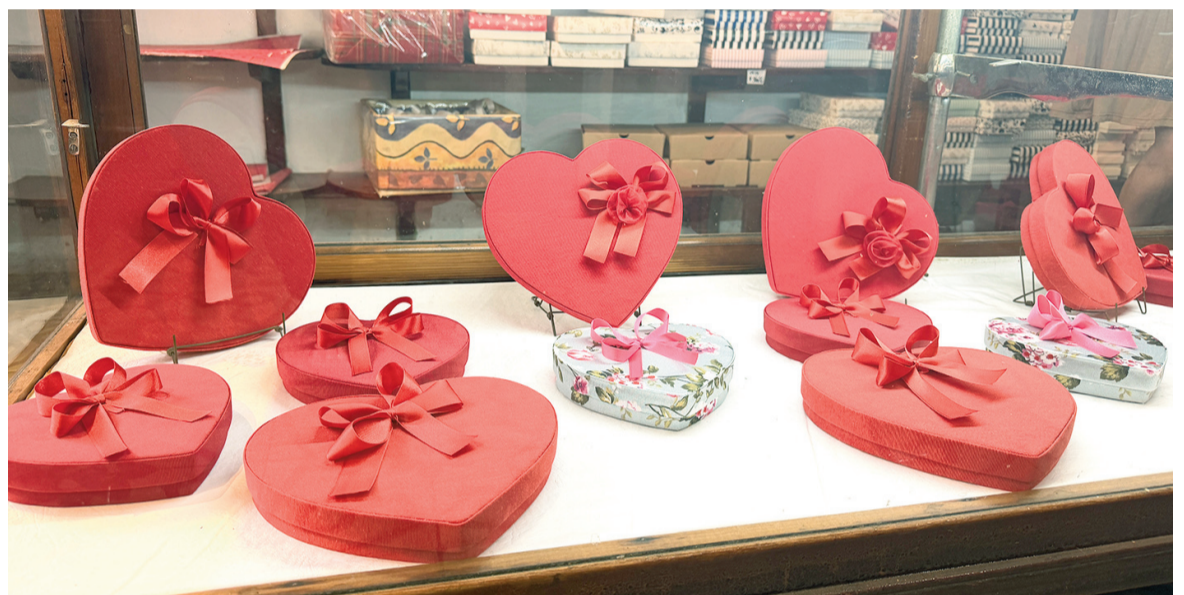
Los hombres, en su mayoría, buscan el regalo ideal para su pareja en el Día de los Enamorados. Perfumería, gastronomía y bombonería lideran las preferencias.

Los bares y restaurantes también aparecen como una alternativa para