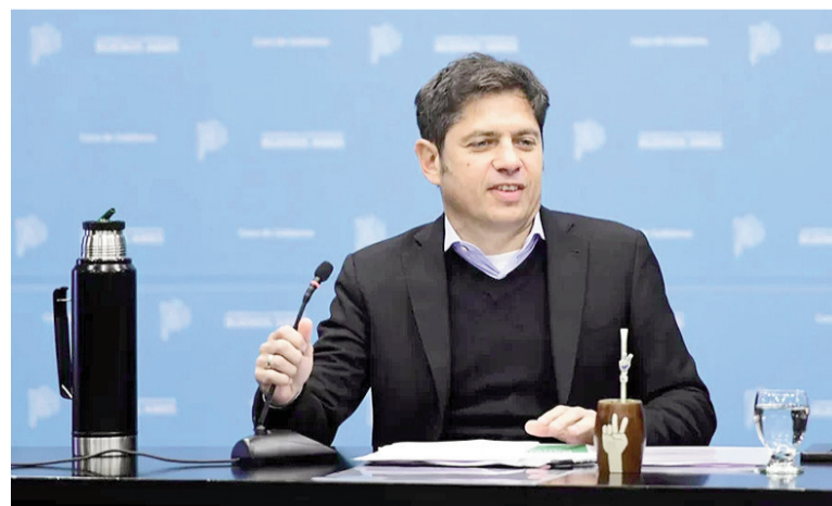
El gobierno de Axel Kicillof activó el RIGI bonaerense.

El Ministerio de Producción, Ciencia e Innovación Tecnológica aprobó el Reglamento Operativo del Régimen Provincial de Inversiones Estratégicas, creado por la Ley N° 15.510, y puso en marcha el esquema administrativo para la adhesión, evaluación y control de los proyectos que aspiren a beneficios fiscales. La medida se dictó en el marco del expediente EX-2025-40253744-GDEBA-DTAYLDLIMPCEITGP y se sustenta en la Ley N° 15.510, la Ley N° 15.477, los Decretos N° 54/20 —texto según Decretos N° 90/22 y N° 208/24— y el Decreto N° 2731/25.