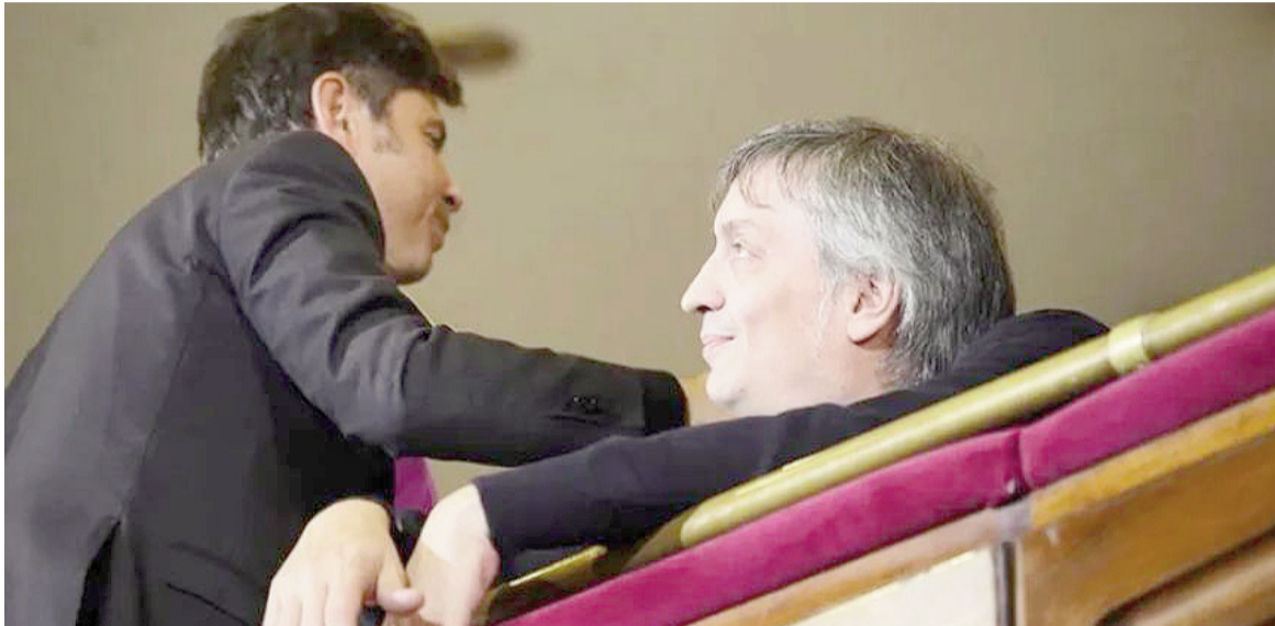
Máximo Kirchner propone a Axel Kicillof como presidente del PJ bonaerense.

La discusión por la conducción del Partido Justicialista (PJ) bonaerense continúa abierta y todavía no hay un horizonte que augure un consenso entre las partes. No obstante, hubo una reunión este martes entre el kicillofismo y el cristinismo en busca de la unidad. El Movimiento Derecho al Futuro (MDF) avanza con el armado de candidatura distritales. La incertidumbre se apodera del escenario a días de la presentación de listas.