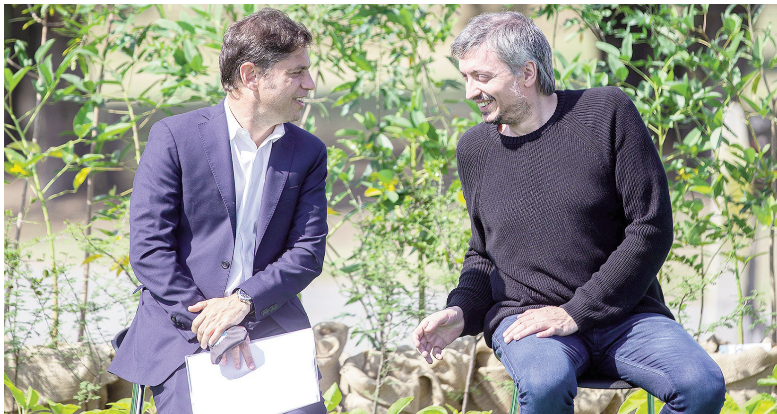
La renovaci n de autoridades en el Partido Justicialista bonaerense tiene dos polos: Axel Kicillof y M ximo Kirchner.

Trabajando fuerte en la revisi n del padr n local de afiliados y, sobre todo, en la reuni n de avales, aparecen varios sectores que en una hi-