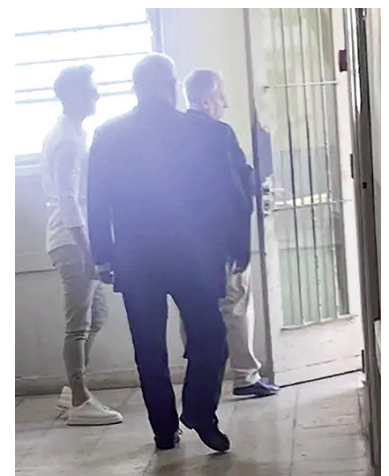
El acusado participó de la audiencia.

La audiencia del artículo 338 del CPPBA constituye una etapa clave del proceso penal, ya que permite al juez analizar si la acusación cuenta con sustento suficiente, filtrar prueba inconducente y evitar dilaciones innecesarias en el juicio, garantizando mayor eficiencia y celeridad en causas de alta complejidad como la que se investiga.