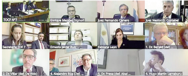
Se retomó el juicio por los Cuadernos.

Por su parte, el ex ministro de Planificación Julio de Vido también se sumó al pedido de anulación, ya que es otro de los imputados que se encuentra acusado principalmente de ser el organizador de una asociación ilícita y es señalado como "pieza clave" en una estructura jerárquica destinada a la recaudación de fondos ilegales provenientes de empresarios, además de recibir sobornos en reiteradas oportunidades. Beraldi calificó como una "estafa" el accionar de los arrepentidos y argumentó que las declaraciones fueron