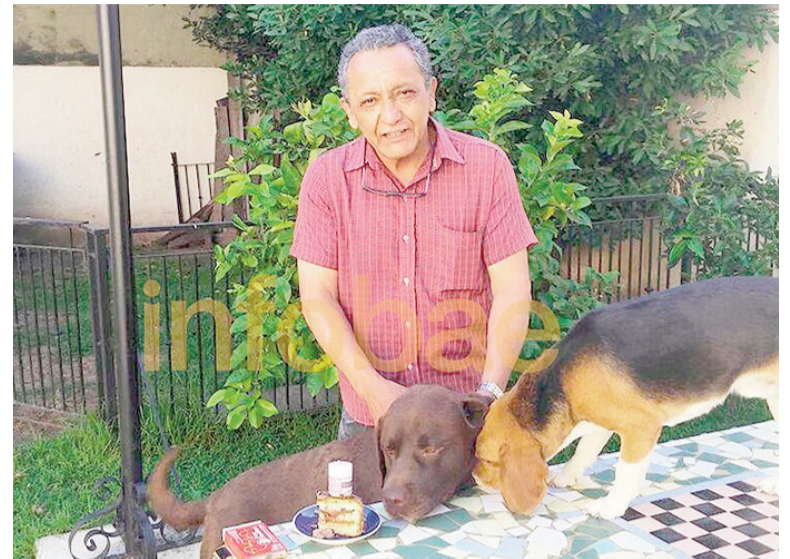
Centeno dijo que quemó los cuadernos que luego aparecieron.

La siguiente audiencia por la Causa Cuadernos será el próximo jueves 12 de febrero y se retomará el 24 del mismo mes, pasados los feriados de Carnaval.