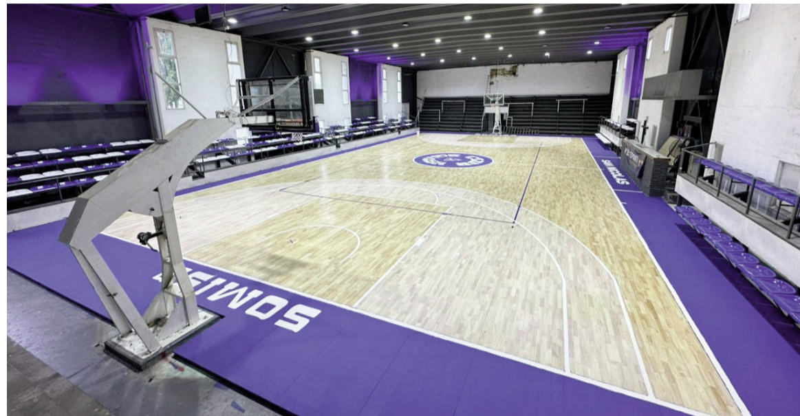
Somisa estrenará su flamante piso de parquet de última generación.

Los somiseros estrenarán hoy su nuevo piso cuando reciban desde las 21.00 a Náutico Sportivo Avellaneda de Rosario. Por su parte, el equipo de Dastugue visitará a Provincial a las 21.30.