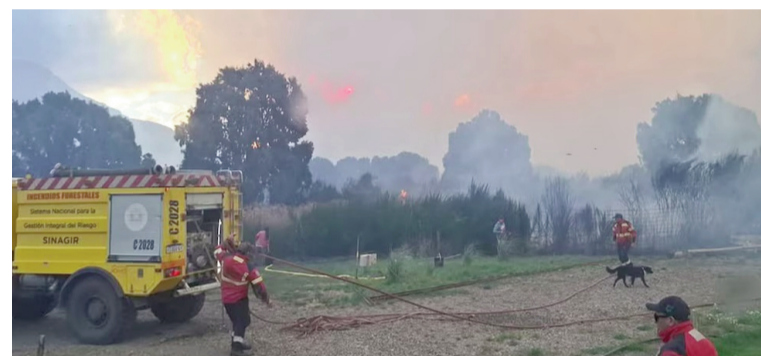
Nuevos focos de incendio en el Parque Nacional Los Alerces.

"Está la mano del hombre, no hay dudas", sostienen referentes de Parques Nacionales, de acuerdo a la localización y dispersión del fuego. Hay una investigación judicial en curso.