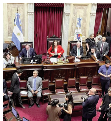
El Senado llevó adelante la primera de las sesiones que tendrá esta semana.