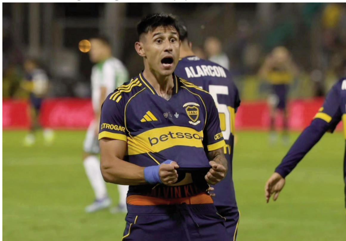
El Xeneize fue netamente superior y se impuso en Salta. WEB

El equipo de la ribera derrotó a Gimnasia de Chivilcoy por 2 a 0 con dos goles de Adam Bareiro en su estreno. El arquero nicoleño Nicolás Dormisch se erigió en figura en el equipo bonaerense.