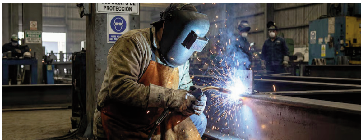
Las consultoras habían anticipado un número de crecimiento de actividad económica similar al del Indec.

Las proyecciones de consultoras privadas diferían sobre la tendencia del dato de diciembre. En ambos escenarios, la magnitud de los registros genera obstáculos para los planes oficiales y aumenta las expectativas ante un indicador que será central