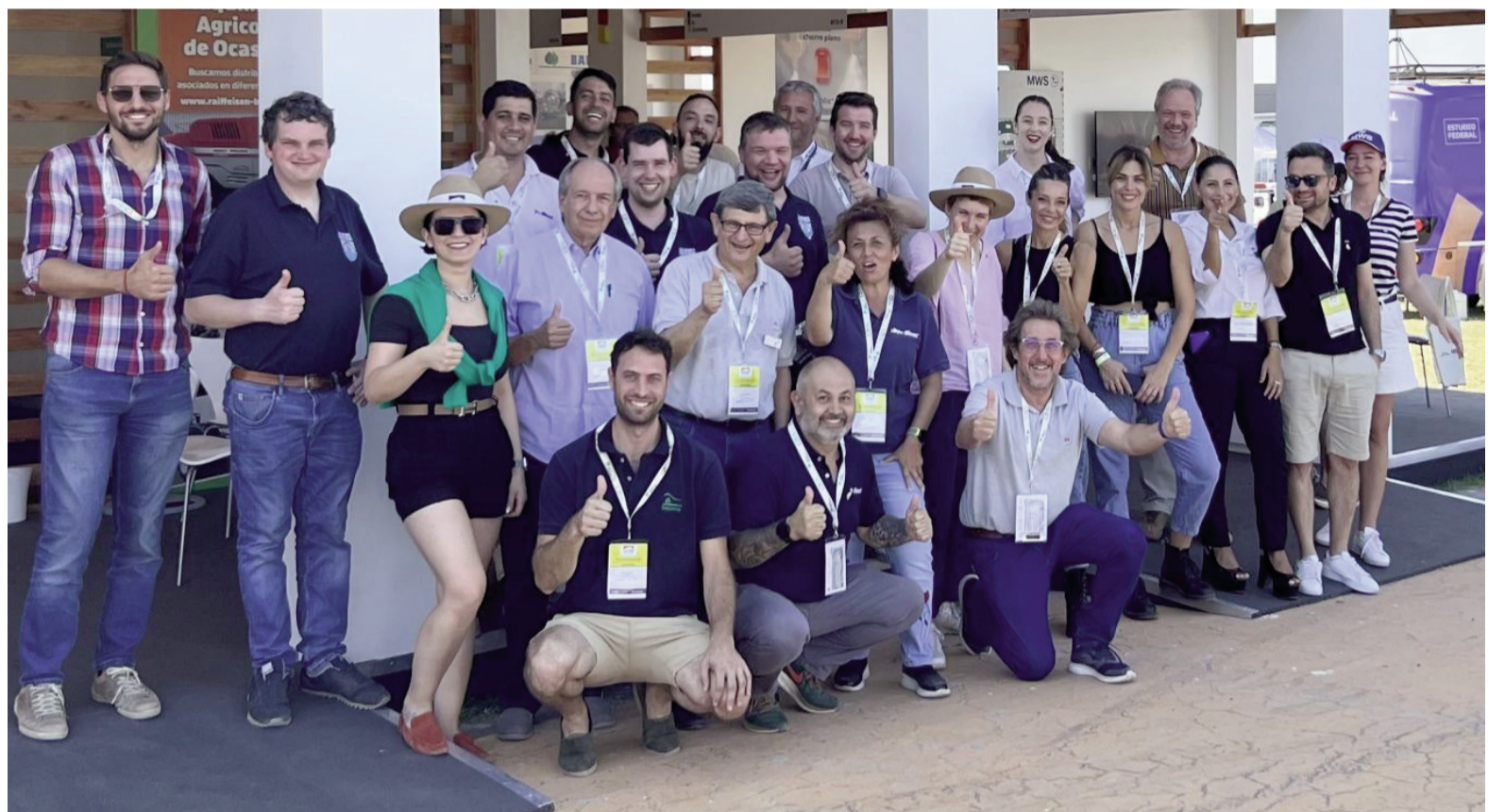
En Expoagro 2026 habrá un Pabellón Alemán, dedicado exclusivamente a firmas de ese país vinculadas a la agroindustria.

excelencia y de vanguardia tecnológica en sus desarrollos vinculados al agro. En el marco de una mayor apertura de mercados y de oportunidades puertas afuera, PromArgentina tendrá un stand propio en la “Capital Nacional de los Agronegocios”. “Las rondas de negocios son espacios estratégicos para facilitar el diálogo entre las empresas argentinas y los importadores internacionales, con el objetivo de promover oportunidades comerciales concretas en el sector agroindustrial a nivel global», agregó Diego Sucalesca, presidente ejecutivo de PromArgentina. Cabe destacar que en 2025 se llevaron a cabo 31 rondas internacionales de negocios, lo que marcó un crecimiento de 130% en comparación con el año anterior. En estos encuentros participaron más de 1700 empresas argentinas y más de 250 compradores internacionales de dife-