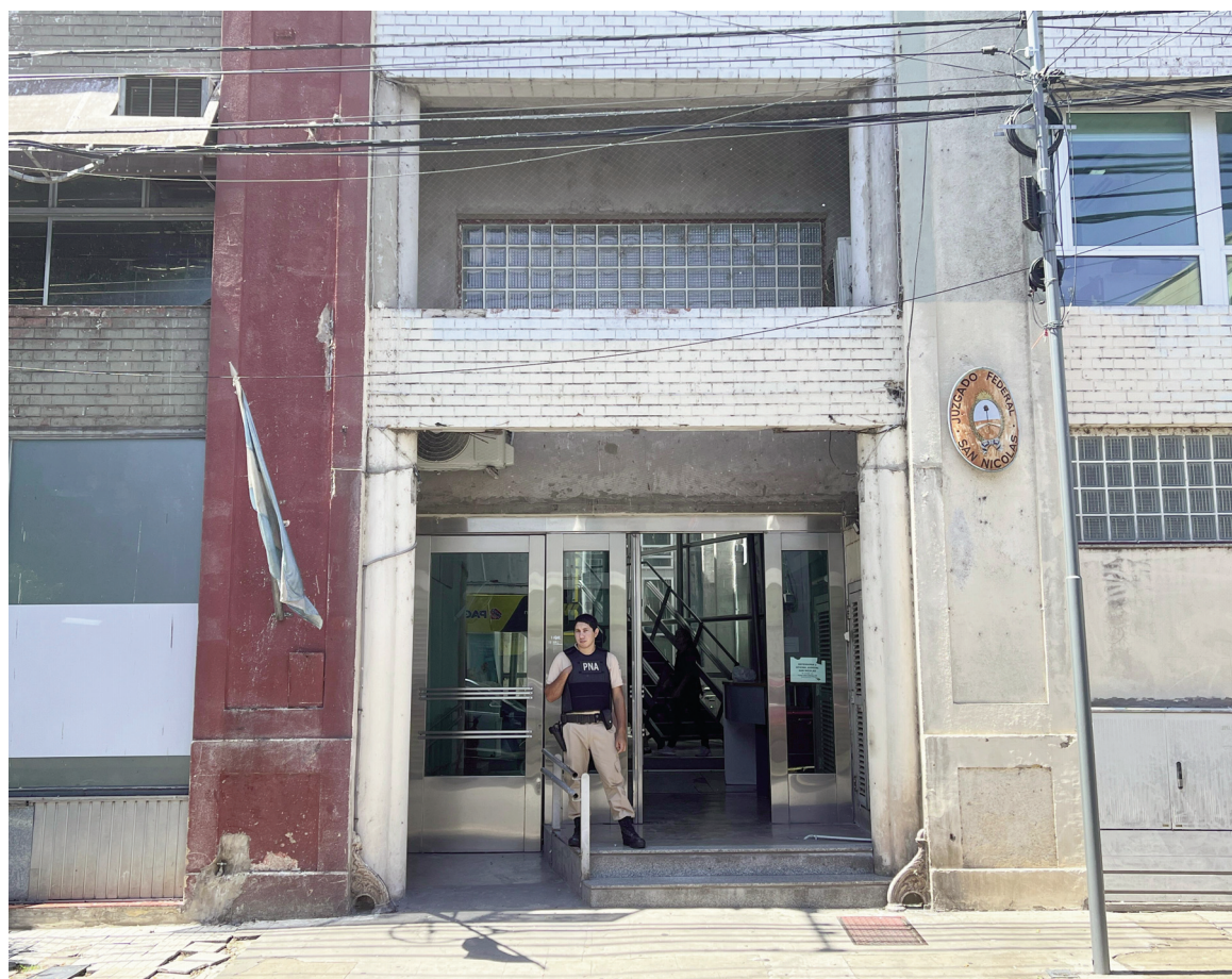
El N°1 de San Nicolás, con asiento en Garibaldi 214, es uno de los cinco juzgados del distrito federal Rosario que no tienen magistrados titulares a cargo.

Ningún pliego llegó al Congreso. No lo mandó Macri en aquel momento. Y tampoco los posteriores gobiernos: ni el de Alberto Fernández entre diciembre de 2019 y diciembre de 2023; ni el de Javier Milei desde su asunción en diciembre