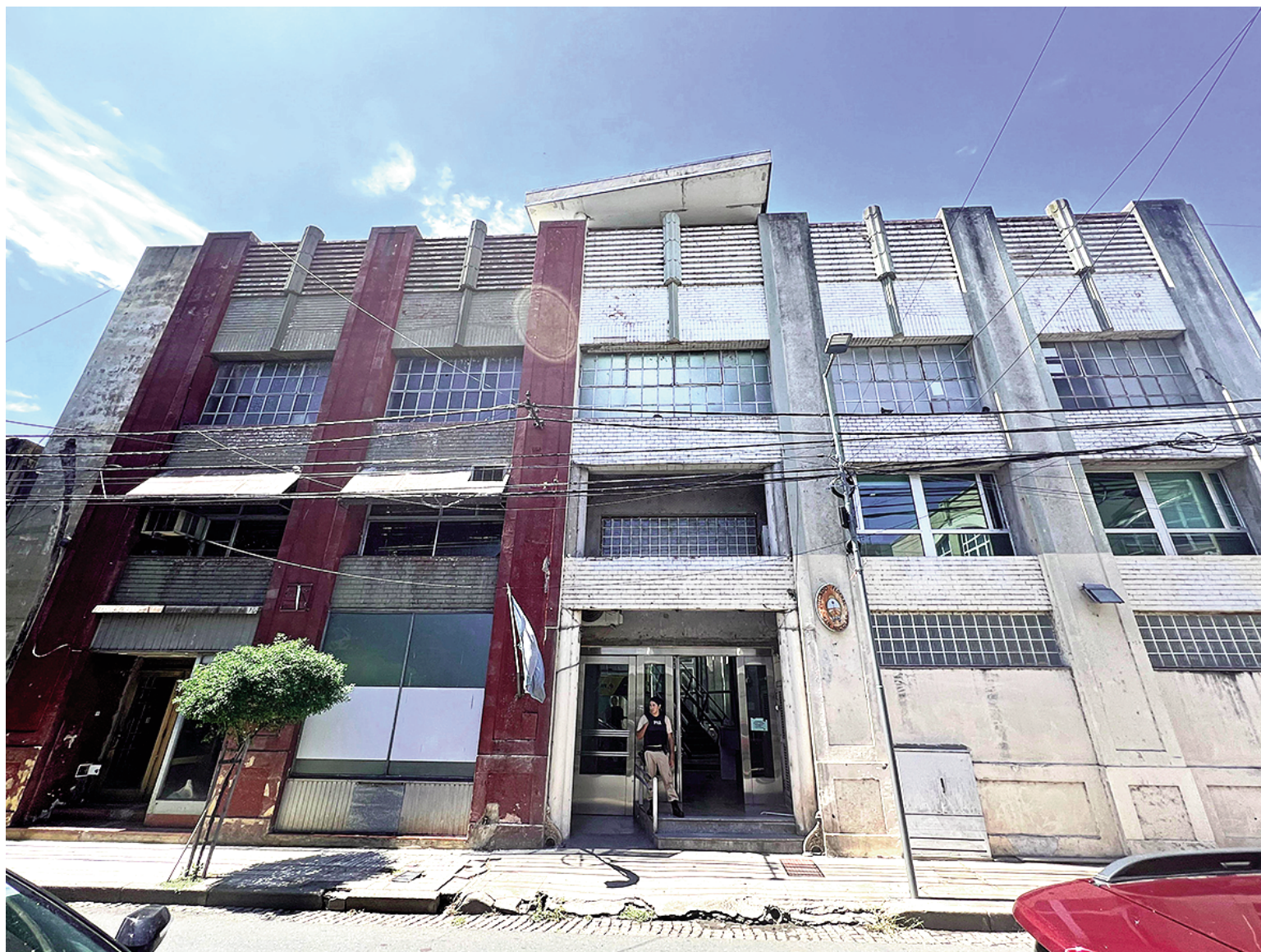
SIN JUEZ TITULAR. El N°1 de San Nicolás, con asiento en Garibaldi 214, es uno de los cinco juzgados del distrito federal Rosario que no tienen magistrados titulares a cargo.