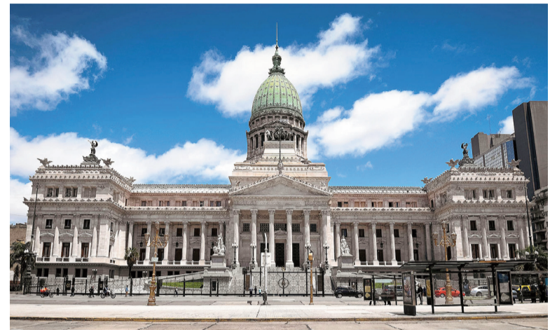
Apuran los tiempos para aprobar la reforma laboral.

Los libertarios integrantes del Senado y de Diputados vienen reuniéndose desde hace varios días, pero ayer martes se terminó de diagramar la estrategia parlamentaria. Para ello fue fundamental la reunión del lunes en la Quinta de Olivos entre la presidente del bloque de La Libertad