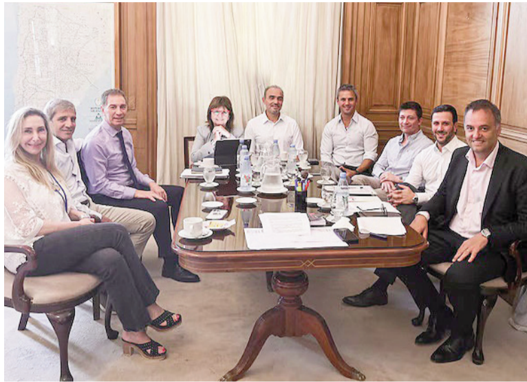
Reunión de la mesa política del Gobierno en Casa Rosada.

En una decisión tomada contra reloj, el Gobierno resolvió retirar el polémico artículo 44 del proyecto de reforma laboral, luego de la fuerte presión ejercida por los bloques aliados que rechazaban la limitación de las licencias médicas aprobada en el Senado. El giro expuso las tensiones internas de la coalición parlamentaria y obligó al oficialismo a recalcular su estrategia para evitar un traspie en Diputados.