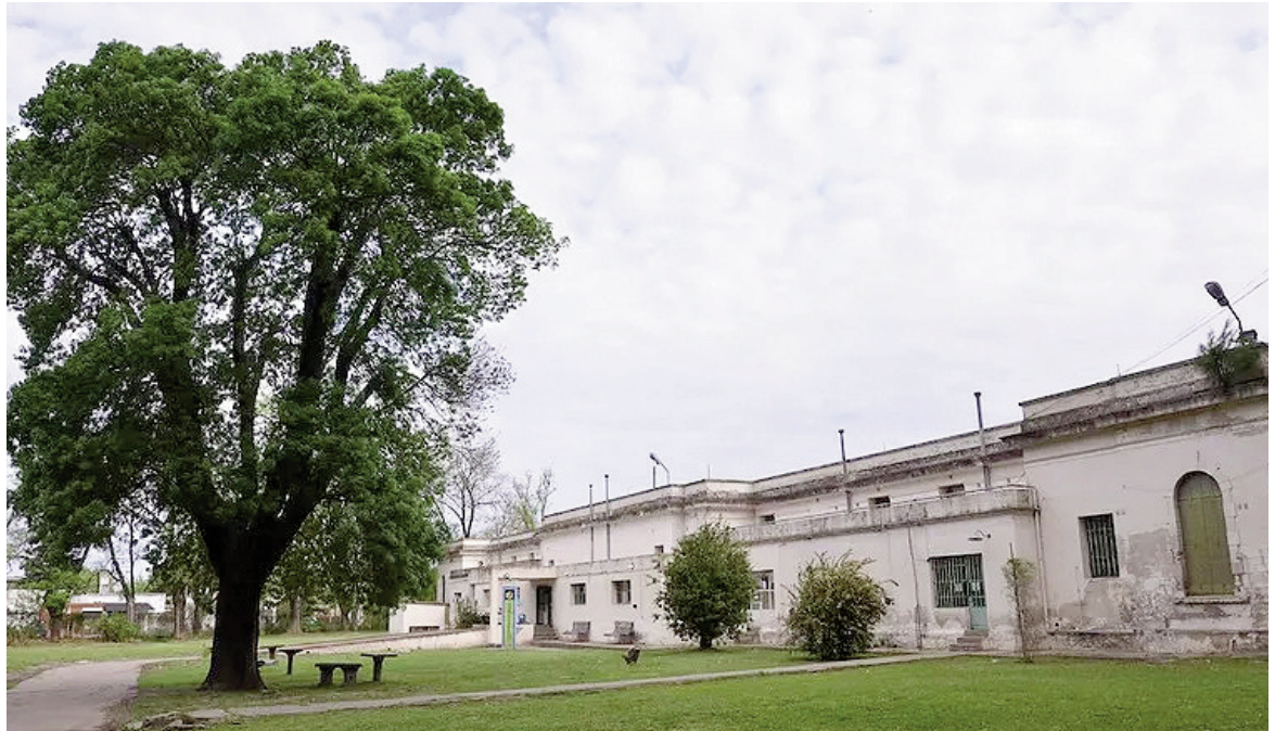
El pabellón de salud mental del Hospital San José fue escenario del violento incidente.

Una trabajadora del sector de salud mental del Hospital San José de Pergamino sufrió quemaduras leves luego de que un paciente ambulatorio le arrojara agua caliente y la amenazara con un cuchillo. El episodio ocurrió al mediodía del jueves y derivó en actuaciones judiciales.