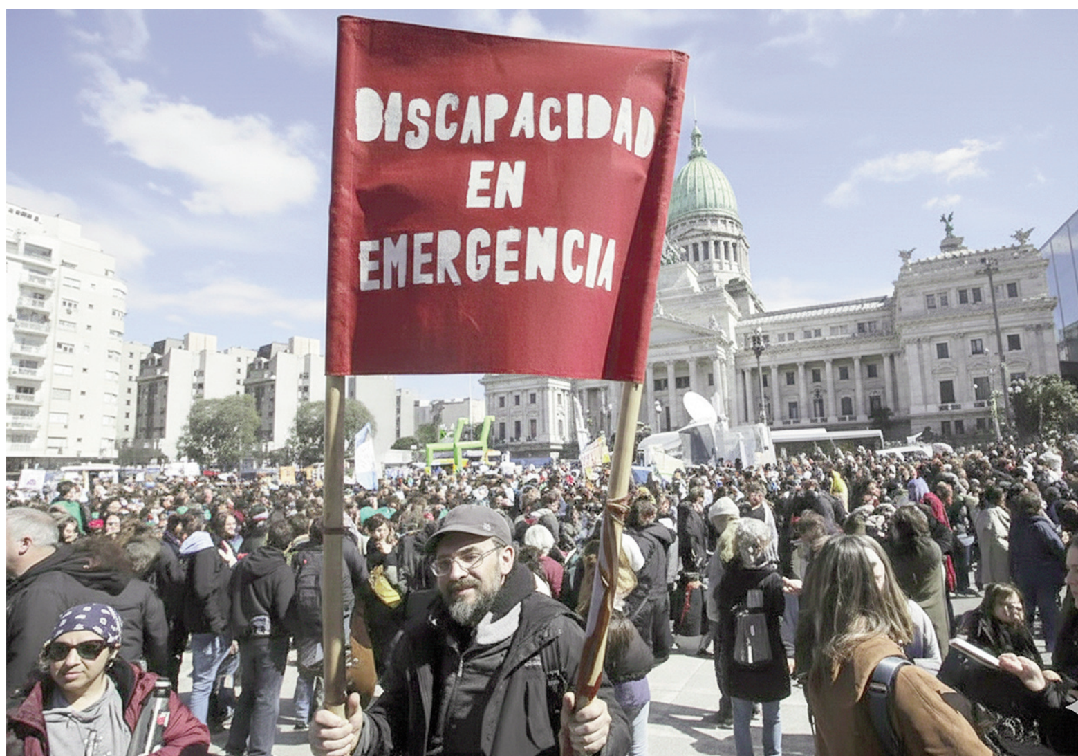
El sector de discapacidad se movilizó en reiteradas oportunidades en 2024 y 2025.

Desde el Foro Permanente hicieron notar que uno de los ejes de la norma aprobada en 2025 era "re-