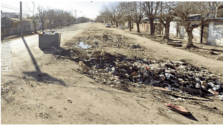
La zona donde se produjo el ataque.