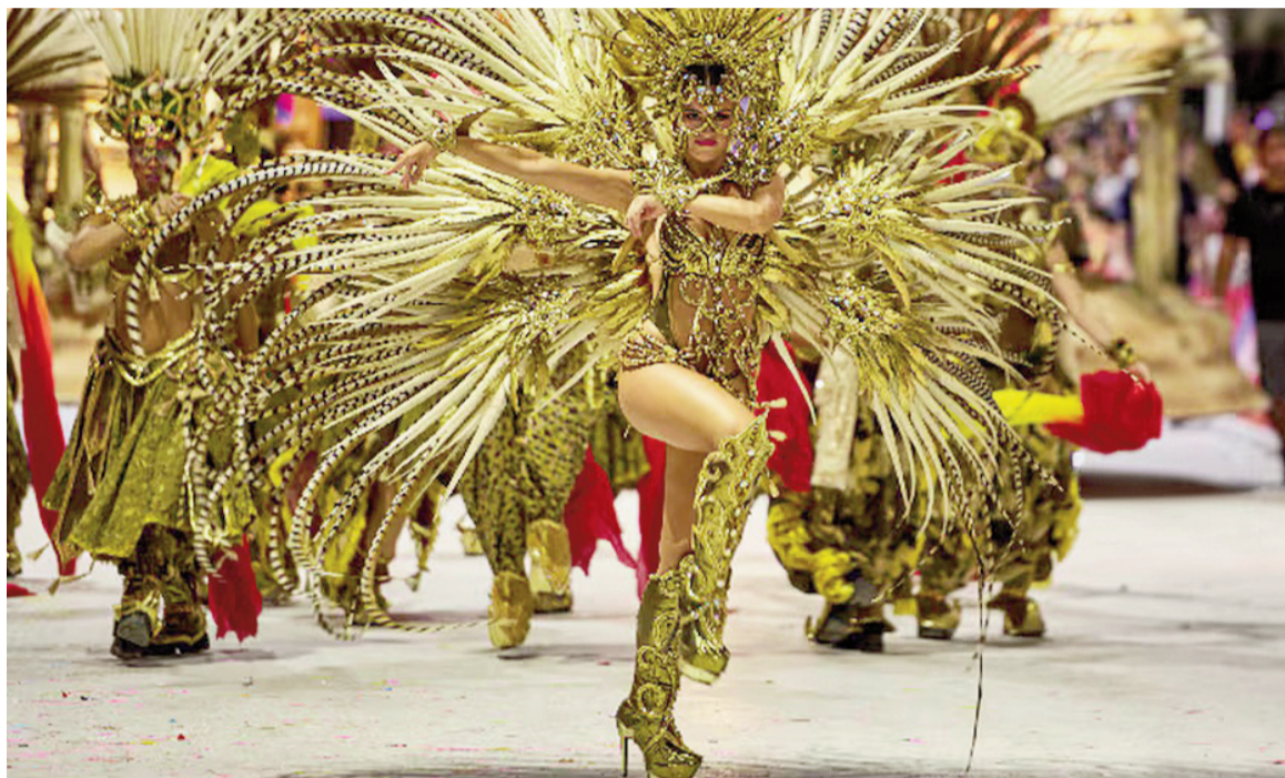
El carnaval dejó un saldo de 3 millones de turistas.

Sin embargo, y a pesar del aumento en el gasto total (6% superior al 2025), los turistas redujeron sus consumos: se promedió un desembolso de $111.605 por viajero, lo que significó un 7,7% menos que el Carnaval del año anterior. Un informe del INECO-UADE estimó que una familia tipo necesitó $1.265.013 para vacacionar dentro del país, equivalente al 74% del salario promedio RIPTE (Remuneración Imponible Promedio de los Trabajadores Estables).