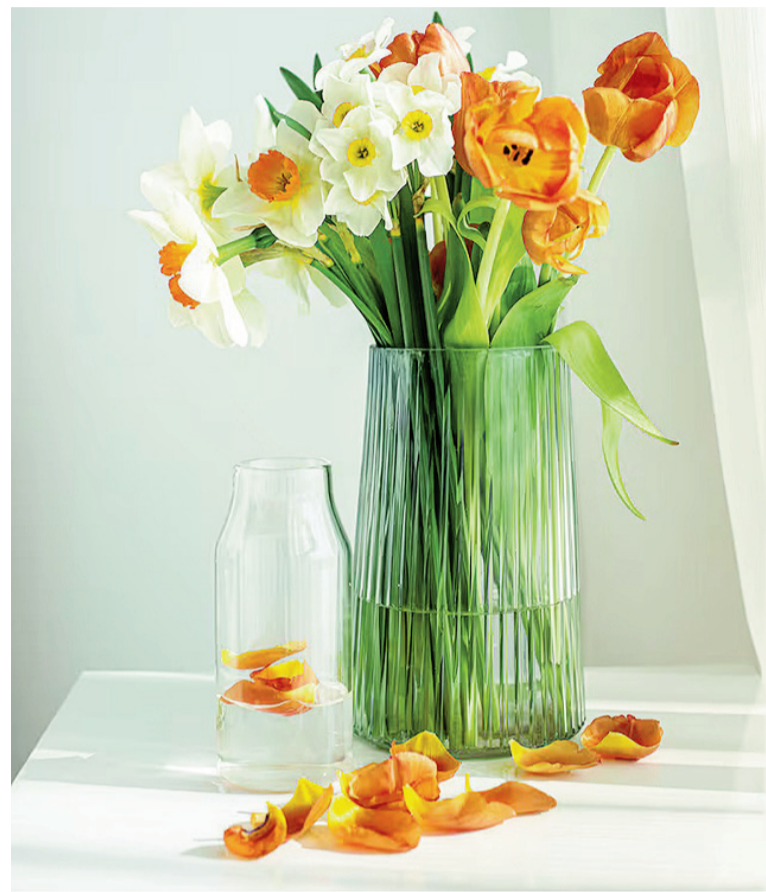
Añadir una aspirina en el agua de nuestro florero evitará que las flores se marchiten.

● Directamente en el suelo: colocar una pastilla entera a unos 15 o 20 centímetros de la planta y regar con normalidad, lo que permite que el