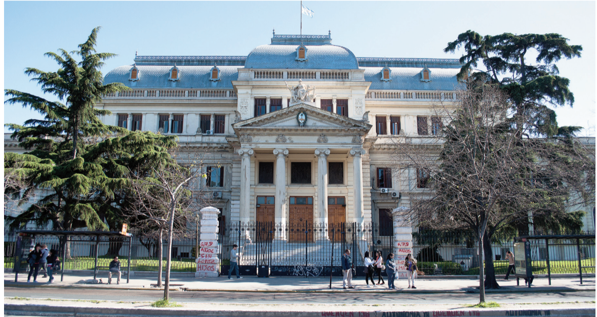
El próximo 24 de febrero retoma la actividad en la Legislatura bonaerense.

En la última sesión de diciembre, la Cámara baja tomó juramento a nuevos legisladores y formalizó el ingreso de una serie de iniciativas, que incluyen desde proyectos de reconocimiento hasta