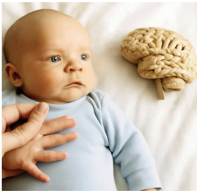
Investigación sobre evolución cerebral y longitud de los dedos.

En su último estudio, el profesor Manning analizó las proporciones de los dedos y el tamaño de la cabeza en un grupo de 225 recién nacidos, compuesto por 100 varones y 125 niñas. Los resultados mostraron un patrón claro en los varones: aquellos con proporciones 2D:4D más altas, que indican una mayor exposición