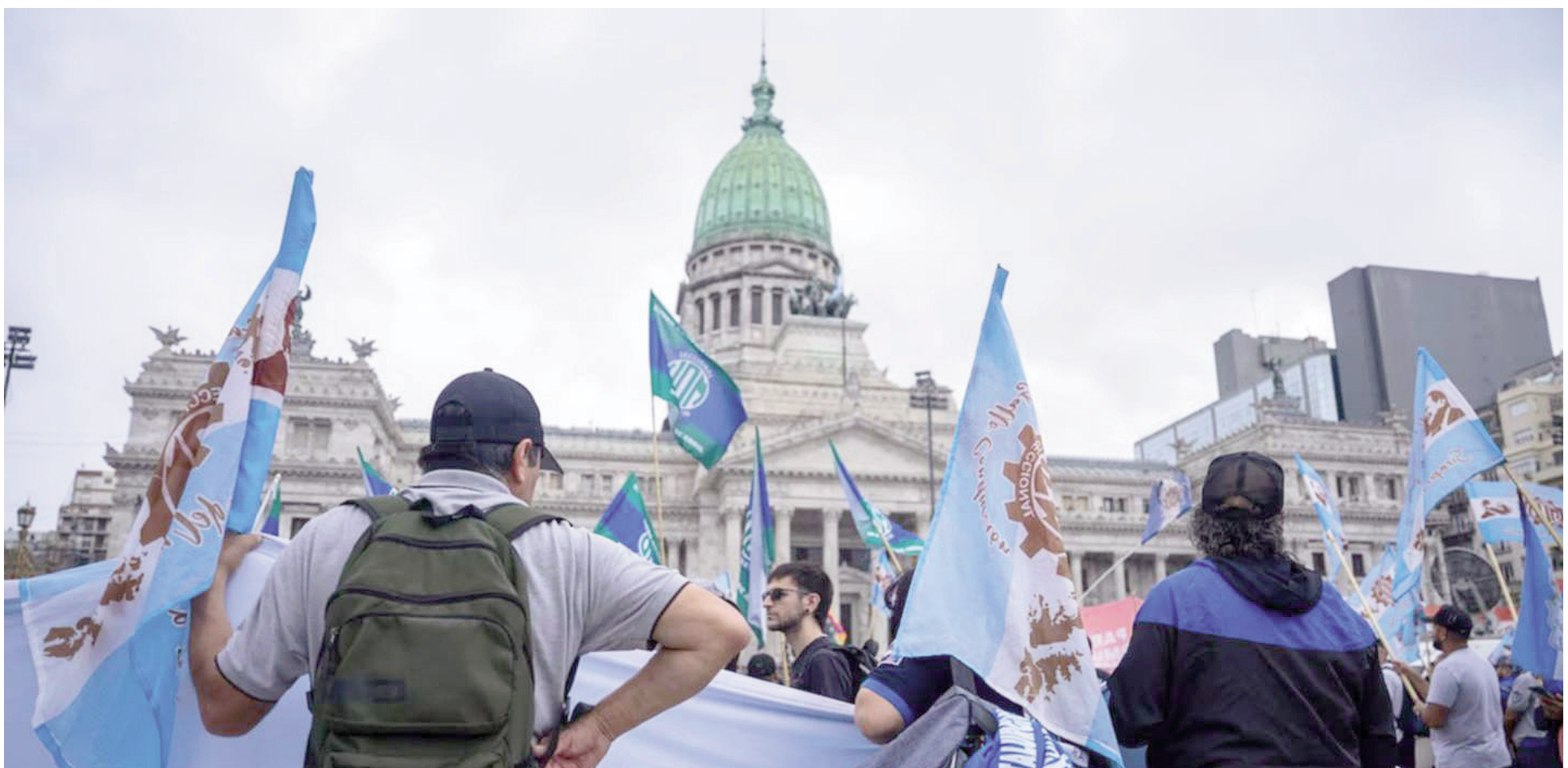
Diversos gremios se movilizan hoy al Congreso contra la reforma laboral y algunos impulsan al mismo tiempo un paro nacional. ILUSTRACIÓN

Diferentes gremios marcharán frente al Congreso para rechazar la iniciativa del Gobierno nacional, al mismo tiempo que muchos acompañarán la movilización con una medida de fuerza. En nuestra ciudad se sentirá mayormente en las escuelas que iban a abrir sus puertas tras el receso y con la adhesión de la Unión Obrera Metalúrgica y los afiliados a ATE, que comprenden varios organismos y espacios como el Hospital San Felipe.