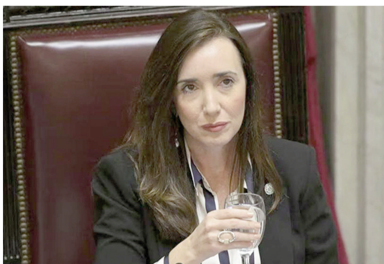
Presidenta del Senado Victoria Villarruel.

La sesión especial convocada para este miércoles a las 11 para debatir la reforma laboral se extenderá unas 12 horas y se votará por capítulo, según se estableció en la reunión de Labor Parlamentaria.