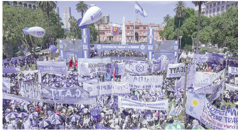
La CGT ya hizo en diciembre una demostraci n de fuerza.