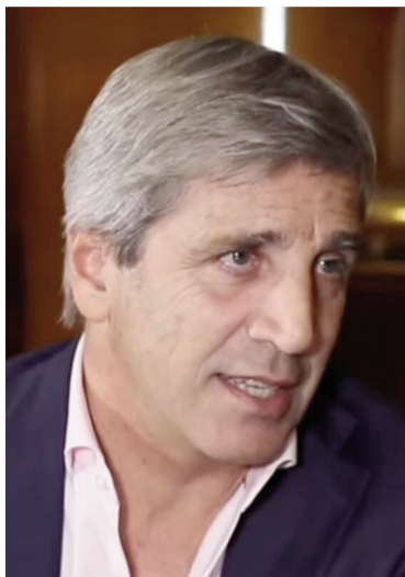
Ministro Luis Caputo.

Esto, según Caputo, por dos razones: “Argentina, a lo largo de su historia tuvo déficit en 113 de los últimos 124 años. La consecuencia de eso es que el Estado terminó absorbiendo todo el crédito disponible para el país, tanto en el mercado local como en el internacional. Eso es lo que se conoce como el efecto crowding out: el Estado se lleva todo el crédito y prácticamente no deja financiamiento disponible para el sector privado, a las empresas para