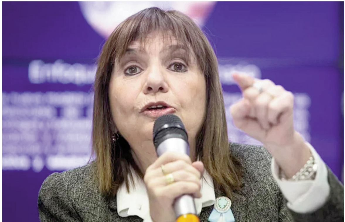
Patricia Bullrich, jefa del bloque de la Libertad Avanza.

El argumento del Gobierno es que el sistema previsional se mantiene mayoritariamente con el aporte de los recursos de rentas generales y que en menor medida de las contribuciones patronales.