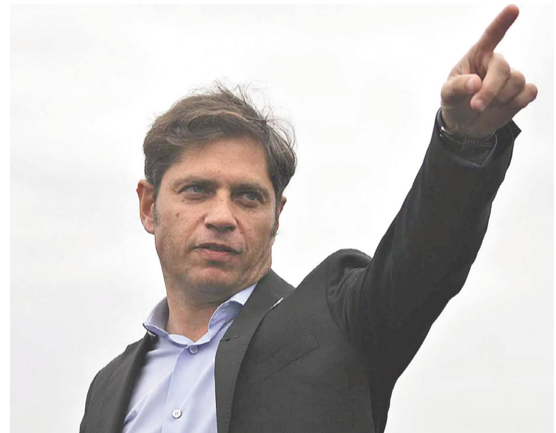
El gobernador analiza postularse a presidir el PJ bonaerense.

deberá ser tomada en escaso tiempo ya que el próximo sábado 8 de febrero vencen los plazos para la presentación de listas.