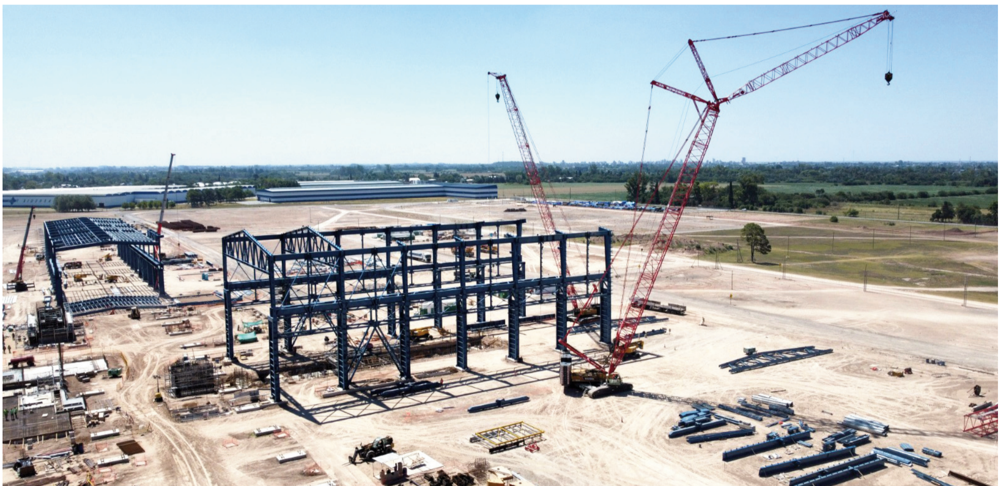
Sidersa avanza con la construcción de una nueva planta que la posicionará como un referente internacional en la producción de acero verde.