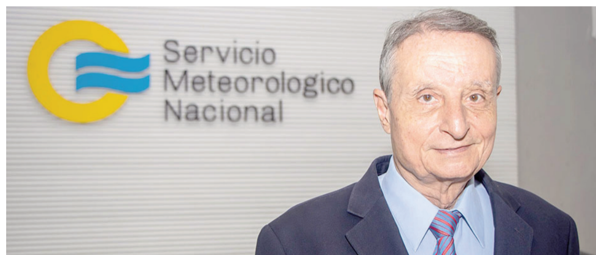
Designan al excombatiente como director del Servicio Meteorológico Nacional.

El héroe de Malvinas vuelve a ocupar el cargo luego de haber renunciado a mediados de agosto de 2025.