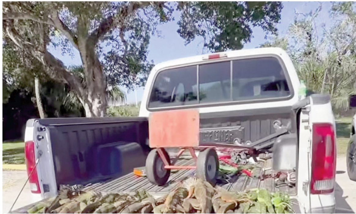
Ciudadanos de Florida atrapan iguanas.

La agencia estatal explicó que los ciudadanos pueden atrapar a los ejemplares aturdidos sin necesidad de un permiso oficial. La orden eje-