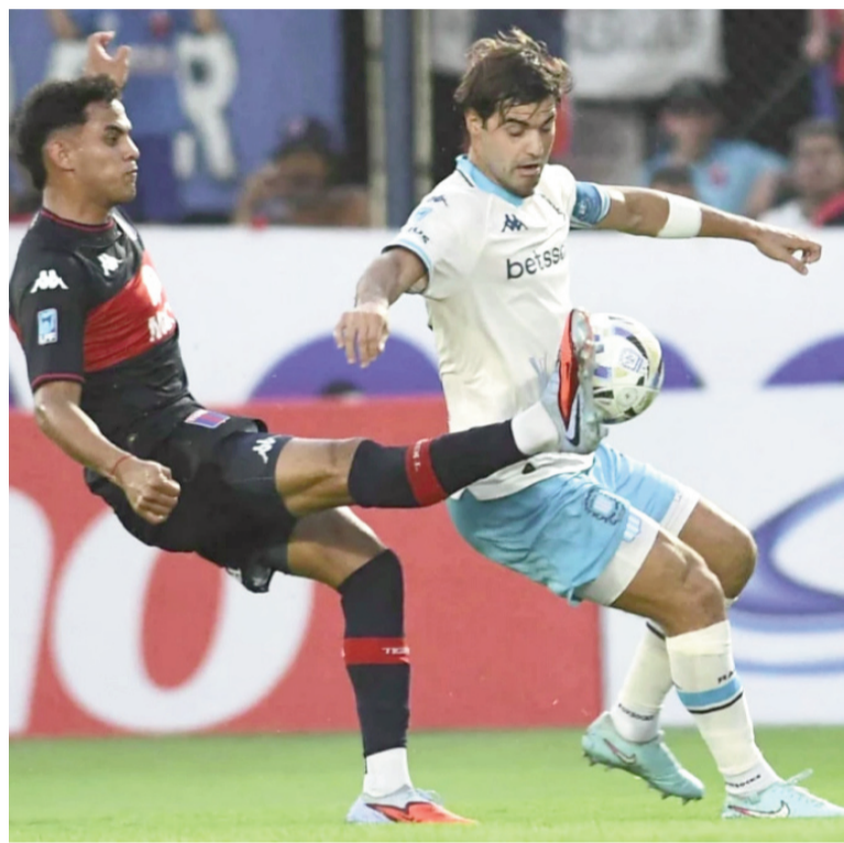
El Matador fue contundente y llegó a la punta de la Zona B.