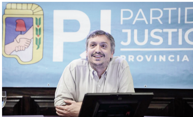
Máximo Kirchner, actual presidente del PJ bonaerense.

Los municipios donde habrá competencia son Morón (2 listas), Navarro (2 listas), San Miguel (3 listas), Tres de Febrero (2 listas), San Antonio de Areco (2 listas), San Nicolás (2 listas), Zárate (2 listas), Magdalena (2 listas), Junín (3 listas), Lincoln (2 listas), General Pueyrredón (2 listas), Lobería (3 listas), Coronel Suárez (2 listas), Tornquist (2 listas), Roque Pérez (2