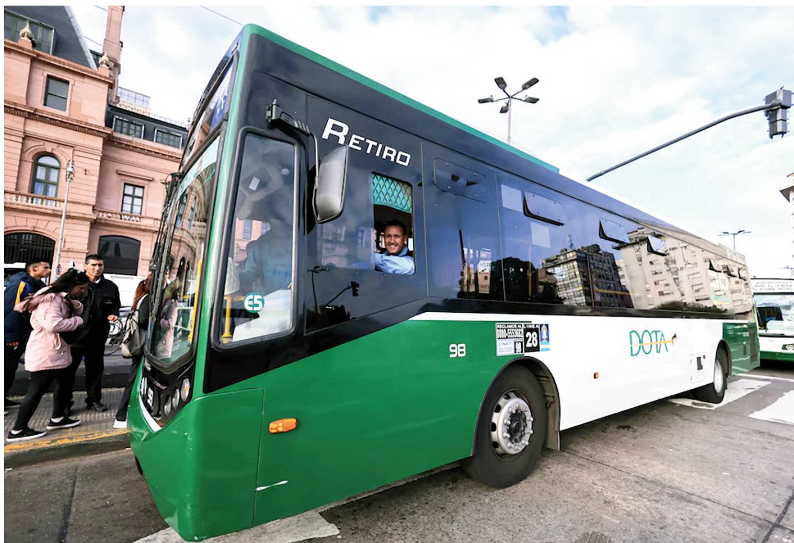
Incluso con el reciente aumento del 31%, viajar en colectivo en el AMBA sigue siendo mucho más barato que en San Nicolás y el resto del interior.

La inequidad tarifaria, que no sólo se verifica en San Nicolás sino en la inmensa mayoría de las ciudades del interior del país, tiene como explicación la inequidad en la asignación de subsidios existentes para el AMBA y para el resto del país. La marcada brecha se había profundizado exponencialmente a principios de 2023 cuando el entonces flamante Gobierno nacional libertario de Javier Milei había suprimido el Fondo Compensador para el Interior, transfiriendo a las provincias la responsa-