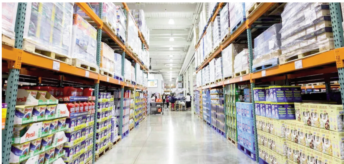
Mayoristas en alerta.

De acuerdo a los supermercadistas, la actividad en el sector mayorista se encuentra limitada por la demanda en un 52,5% y el costo laboral en un 25%, cuando hace tres meses los porcentajes eran de un 55,8% y el 24,7%, respectivamente. El costo del financiamiento fue otro de los factores contemplados, con un 7,5%.