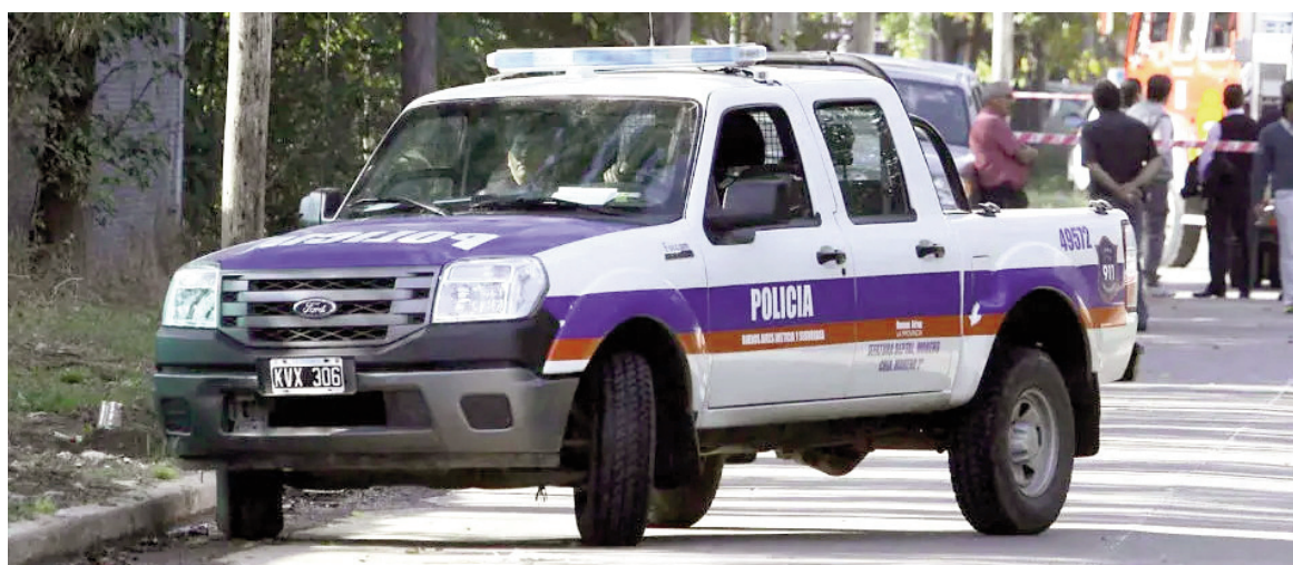
Alarman los hechos de inseguridad que se registran en Pergamino.

ños pequeños, de 5 y 6 años, presenciaron la escena de violencia y las amenazas. "Me dijeron que más tarde iban a volver y que iban a tirotear la casa", sostuvo la joven, quien agregó que uno de los integrantes del grupo envió posteriormente un mensaje intimidatorio a su hermano.