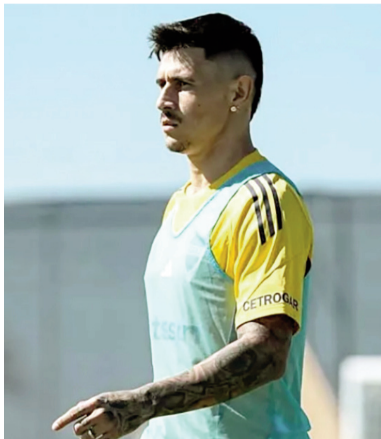
El Xeneize buscará una victoria en su estreno en la Copa Argentina . WEB

La ausencia más destacada en Boca es la de Edinson Cavani. Ante el arribo de Bareiro, que le dio una variante necesaria, el cuerpo técnico