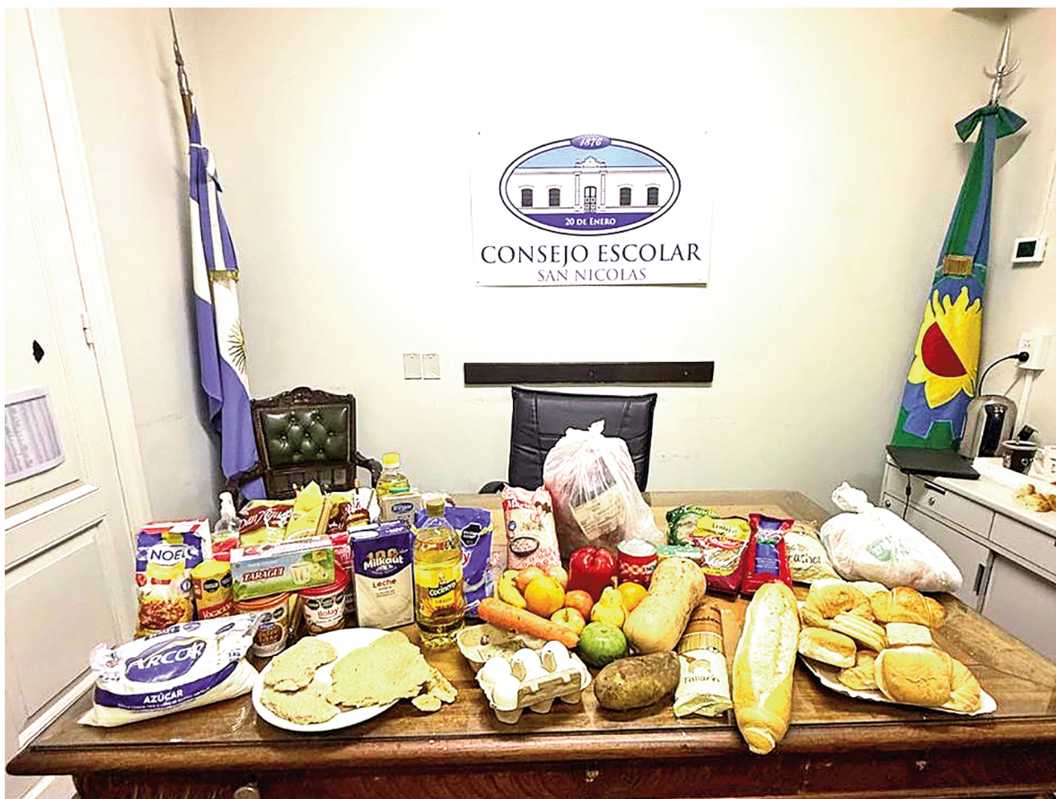
MALABARES PARA ESTABLECER EL MENÚ. Con los escasos recursos disponibles, el Consejo Escolar de San Nicolás diseñó los menús para las escuelas del distrito.

El bloque de Hechos presentó en el Consejo Escolar de San Nicolás una propuesta alimentaria que fue tratada y aprobada por unanimidad. A pesar de contar con recursos insuficientes, el menú para 2026 mejora al del año pasado. Hace casi doce meses que Provincia no actualiza las partidas: envía menos de 1.000 pesos por alumno para el almuerzo, y menos de $500 para el desayuno o merienda. Consejeros de algunos distritos ya elevaron el reclamo al gobierno bonaerense por la falta de actualización del valor de las partidas. En foco 2