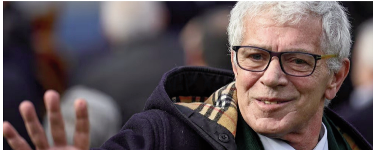
Cúneo Libarona aseguró que la ley que baja la edad de imputabilidad «tiene que salir».

En ese sentido, el funcionario explicó que los menores que delinquen actualmente “tienen conocimiento, tienen comprensión” y que los “requisitos” para imputarlos de un delito penal “tienen que ser conocimiento y voluntad” por lo que “hoy estos chicos lo tienen; tal vez no lo tenían el chico de 1980, pero hoy lo tiene”.