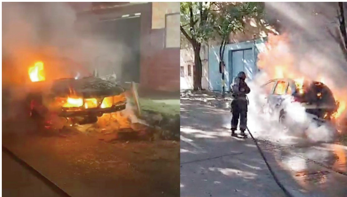
Los incidentes tuvieron lugar en las zonas oeste y norte de Rosario.

El segundo incidente se produjo pasadas las 6.30 y afectó a un auto de la marca Suzuki, mo-