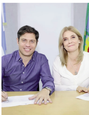
Kicillof y Magario comandarán el PJ.

Máximo Kirchner dejará la presidencia del partido, pero no dejará de tener un rol clave, ya que quedó ubicado como futuro presidente del Congreso partidario, una entidad vital