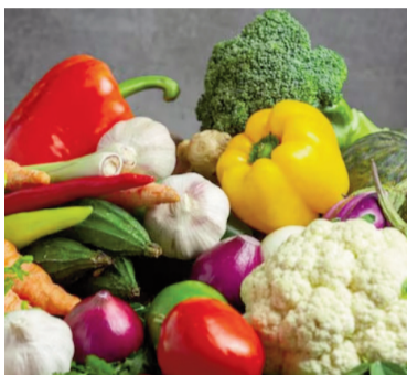
Las verduras presionaron el IPC de enero.

de Mercado (REM), que elabora el Banco Central en base a las estimaciones privadas, previó que la inflación del primer mes del 2026 habría estado en 2,4% y espera que la inflación interanual alcance a fin de año 22,4%.