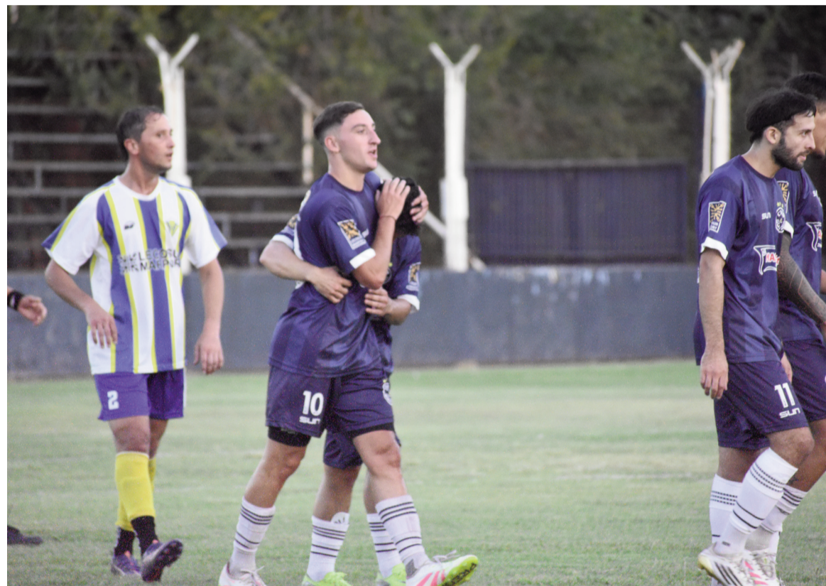
El equipo del Barrio logró una cómoda victoria. EZEQUIEL RUIZ MEMLER

El equipo de Ojeda se impuso por 5 a 1 como local, asegurando su clasificación a la próxima fase. Sawicz (2), Cristian Pérez (2) y Traverso anotaron para el dueño de casa, mientras que Danilo Lemo descontó para la visita.