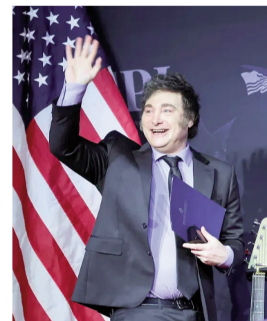
El Presidente no viaja a los EE.UU.

El Presidente canceló la gira prevista para esta semana y delegó la agenda presencial en Federico Sturzenegger.