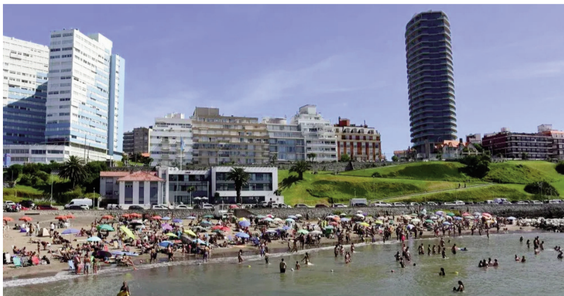
Mar del Plata es sinónimo de turismo todo el año.

En el caso de la provincia de Córdoba se estima que recibirá unos 370.000 arribos en todo el fin de semana XXL, lo que implicaría un incremento de 16% respecto al mismo período de 2025. En el caso puntual del Cosquín Rock, en el Valle de Punilla, hay localidades que tienen ocupación plena. Allí los niveles de re-