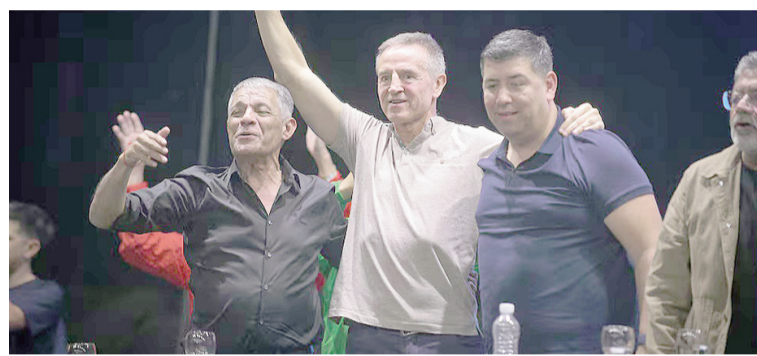
La CGT analiza un paro nacional.

“Están dadas las condiciones y generados los consensos colectivos para ir hacia una huelga nacional”,