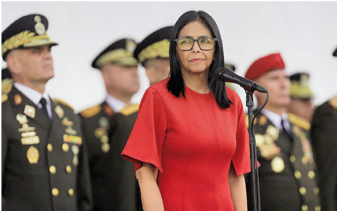
Delcy Rodríguez, la sucesora del dictador narco Maduro.

fue señalado por adjudicar contratos millonarios a empresas sin experiencia y con vínculos irregulares, algunas investigadas por lavado en Colombia y Panamá. Algunas investigaciones revelaron sobreprecios, obras inconclusas y transferencias sospechosas desde el Banco de Venezuela a la fundación. Se estima que parte de los fondos se desviaron a través de con-