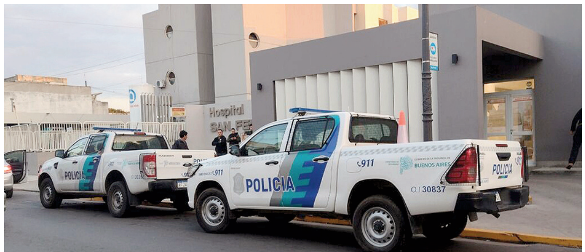
Un hombre permanece internado tras ser baleado en la vía pública.

En el caso interviene personal del Grupo de Tarea Operativa (GTO), que continúa abocado a las tareas investigativas para el esclarecimiento del hecho. La causa fue caratulada como "lesiones agravadas".