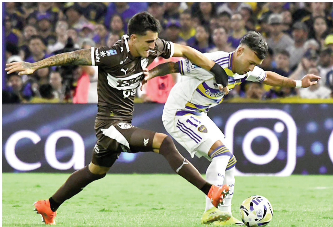
El Xeneize solamente pudo empatar ante el Calamar.

Igualaron 0 a 0 en La Bombonera en otra floja actuación del equipo de la Ribera que, con siete puntos, se metió en puestos de clasificación.