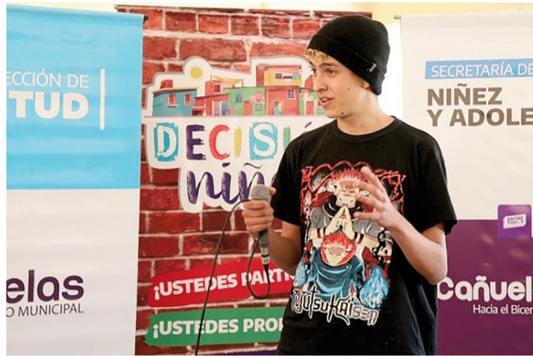
Chicos y chicas de entre 8 y 17 años presentan y votan proyectos en el marco del programa Decisión Niñez.

En la edición 2025 se garantizó un financiamiento de hasta 1.200.000 pesos para cada uno de los 250 proyectos seleccionados, y este año se espera ampliar el alcance tras el crecimiento sostenido del programa desde su creación en 2022.