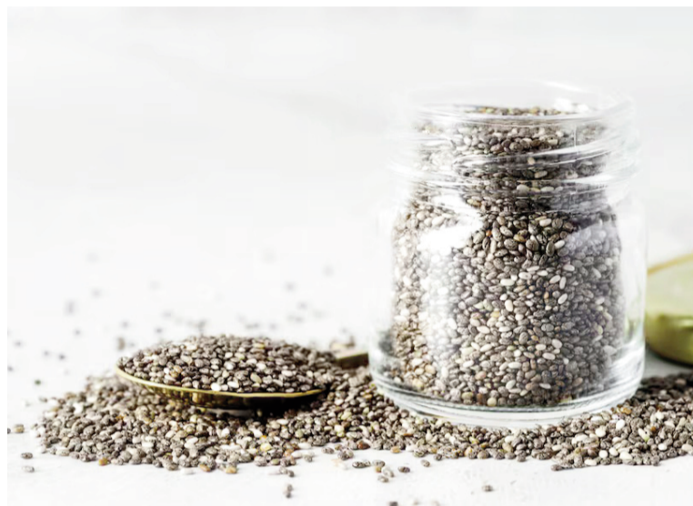
La chía no es recomendable para personas alérgicas a los frutos secos.

Uno de los grupos en riesgo son las personas con hipertensión arterial que están bajo tratamiento farmacológico. El consumo excesivo de semillas de chía puede generar una reducción adicional de la presión sanguínea, lo que podría disminuir la efectividad de los medicamentos prescritos. Las propiedades