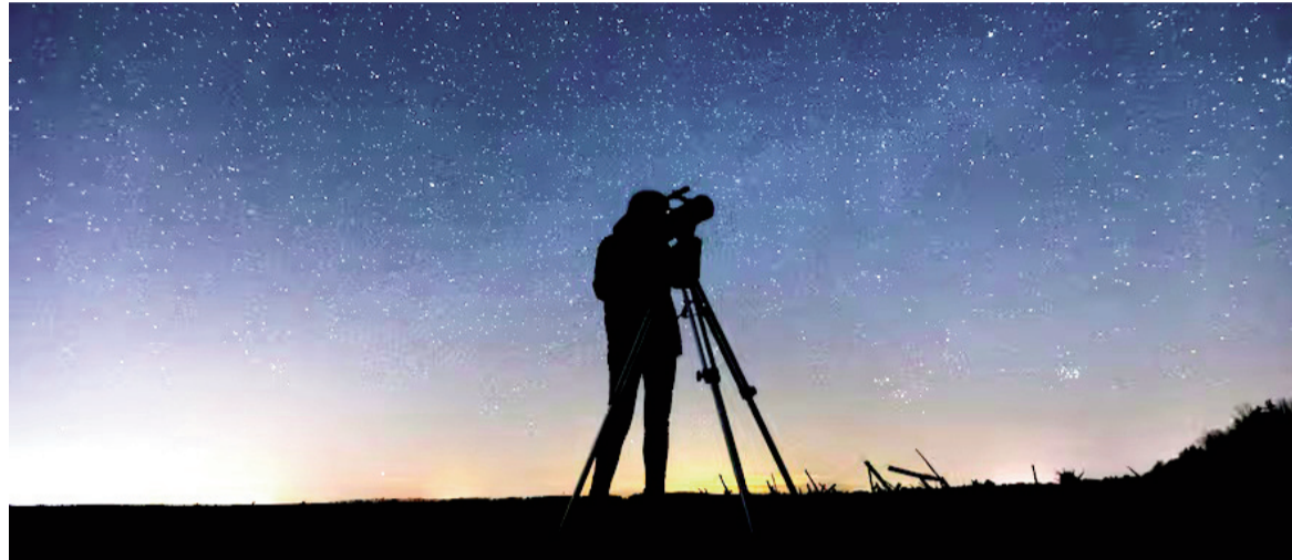
Apenas dos de los seis planetas requerirán de un equipo especial para poder observarlos.

llante, pero bajo en el cielo tras la puesta del Sol.