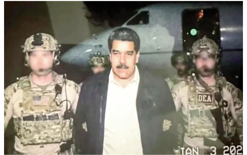
Argentina pide la extradición de Maduro.

Esta doctrina del derecho internacional permite a un Estado juzgar crímenes de lesa humanidad -como torturas, desapariciones forzadas, asesinatos y persecución política- independientemente de dónde se hayan cometido o de la nacionalidad de las víctimas y victimarios, siempre que se demuestre que en el país de origen no existen garantías judiciales para investigar. En el caso de Venezuela, la Justicia argentina consideró que hay pruebas de que