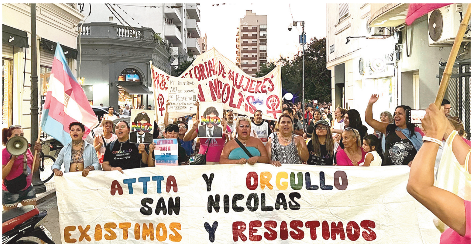
En febrero de 2025, colectivos locales como Orgullo SN y ATTTA marcharon –al igual que ocurrió en distintos puntos del país– tras los dichos contra la diversidad sexual del presidente Milei en Davos.

En el orden local, Orgullo San Nicolás convoca a la manifestación de este sábado desde las 18:30 en la Plaza Mitre con la adhesión de la Asociación de Travestis, Transexuales y Transgéneros.