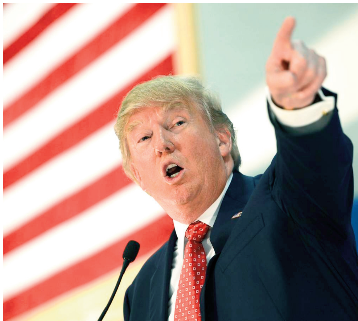
Trump amenazó a Irán en medio de la tensión.

El mandatario estadounidense habló en medio de la tensión entre Washington y Teherán.