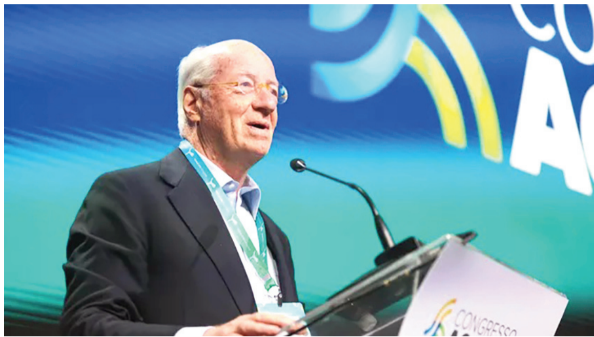
El presidente del Grupo Techint, Paolo Rocca.

«Al ser informados de que había otra oferta a menor precio por parte de un proveedor de origen indio, y siguiendo una práctica absolutamente lícita y habitual en el marco de una relación entre privados, propusimos reducir nuestro precio un