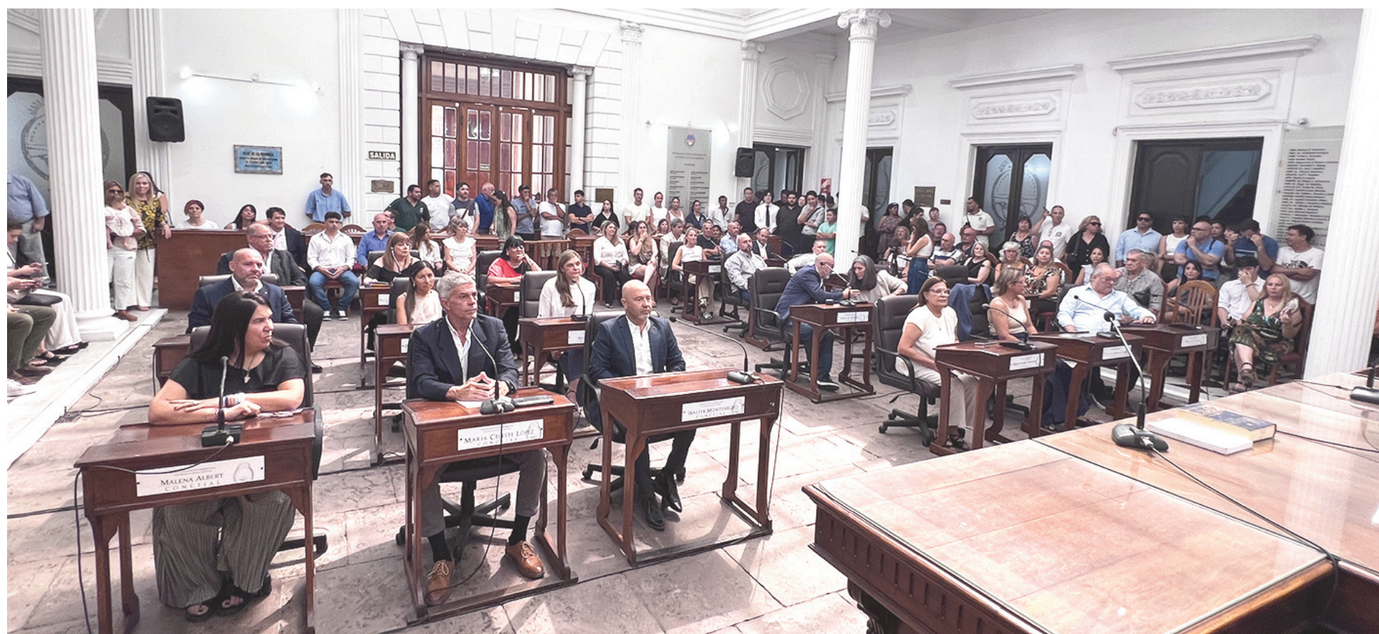
El último encuentro de concejales y concejalas en el recinto se había producido el 5 de diciembre pasado.

El Concejo Deliberante de San Nicolás no sesiona desde el 5 de diciembre pasado, hace ya dos meses. No hubo agenda de extraordinarias en el resto de diciembre ni durante enero. De momento, tampoco la habrá para este mes de febrero. Así las cosas, concejales y concejalas recién volverán al recinto para la ceremonia de apertura del 117º periodo de sesiones ordinarias con la presencia del intendente Santiago Passaglia. Evalúan la fecha del 1º de marzo, que cae domingo.