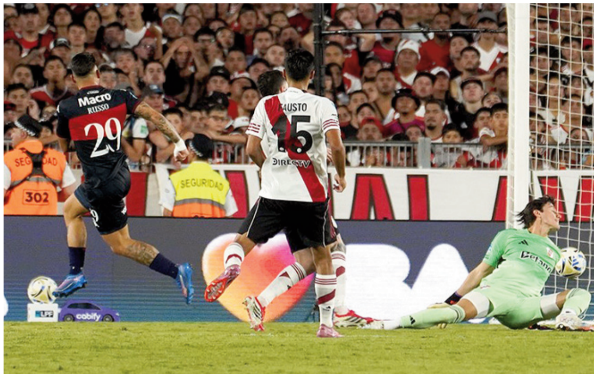
El Matador fue una pesadilla para el equipo de Gallardo.