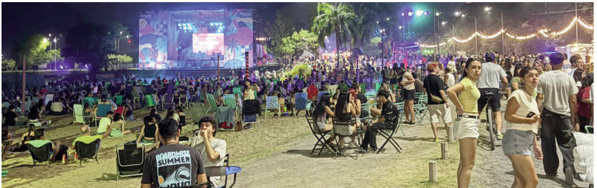
San Nicolás vive "Veranico" en la Laguna Descubrí, la propuesta del municipio para las noches de verano en la ciudad.