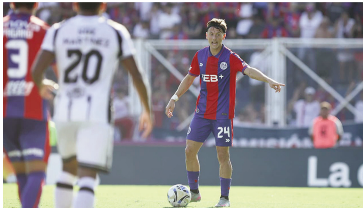
El Ciclón sumó de a tres y subió algunos escalones.

El conjunto dirigido por Damián Ayude derrotó a Central Córdoba de Santiago del Estero por 1 a 0 en el Nuevo Gasómetro y quedó a un solo punto de la cima de la Zona A.