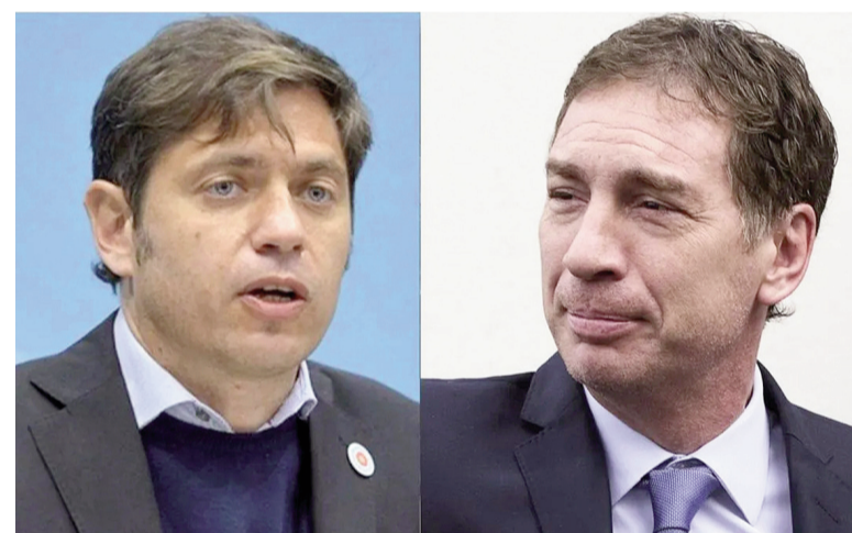
Kicillof y Santilli se cruzaron en las redes.

«Si los trabajadores y las familias argentinas se quedan sin su derecho a descansar y a tomarse las vacaciones que les corresponden, esa libertad no es más que un discurso», había planteado en sus críticas al proyecto libertario.