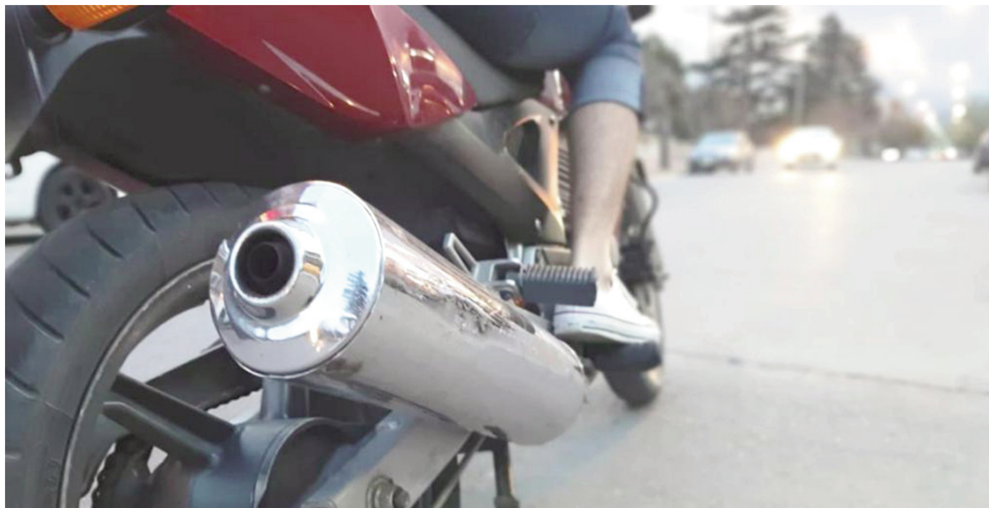
La situación denunciada recuerda lo que anteriormente venía sucediendo en el parque San Martín y sus inmediaciones. ILUSTRACIÓN

Afirman que los grupos permanecen en el espacio público hasta altas horas de la madrugada emitiendo ruidos molestos con sus vehículos y ejecutando maniobras imprudentes. Elevaron un aviso al Juzgado Municipal de Faltas y a las autoridades judiciales. La situación recuerda lo sucedido habitualmente años atrás en el parque San Martín, escenario que terminó en diciembre de 2024 con el secuestro y la compactación de 113 motos.