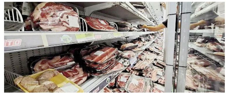
Las verduras, las carnes y los aceites encabezaron los aumentos.

Econviews proyectó una inflación del 2,8%, mientras que LCG la ubicó en torno al 2,5%, impulsada principalmente