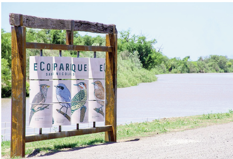
El conductor dio positivo en alcoholemia.

La infracción quedó a cargo del personal de Tránsito municipal y se dispuso el secuestro del rodado, que quedó a disposición del Juzgado de Faltas Municipal. El hecho fue caratulado como "Vehículo sumergido" e intervino la Comisaría Tercera de San Nicolás.