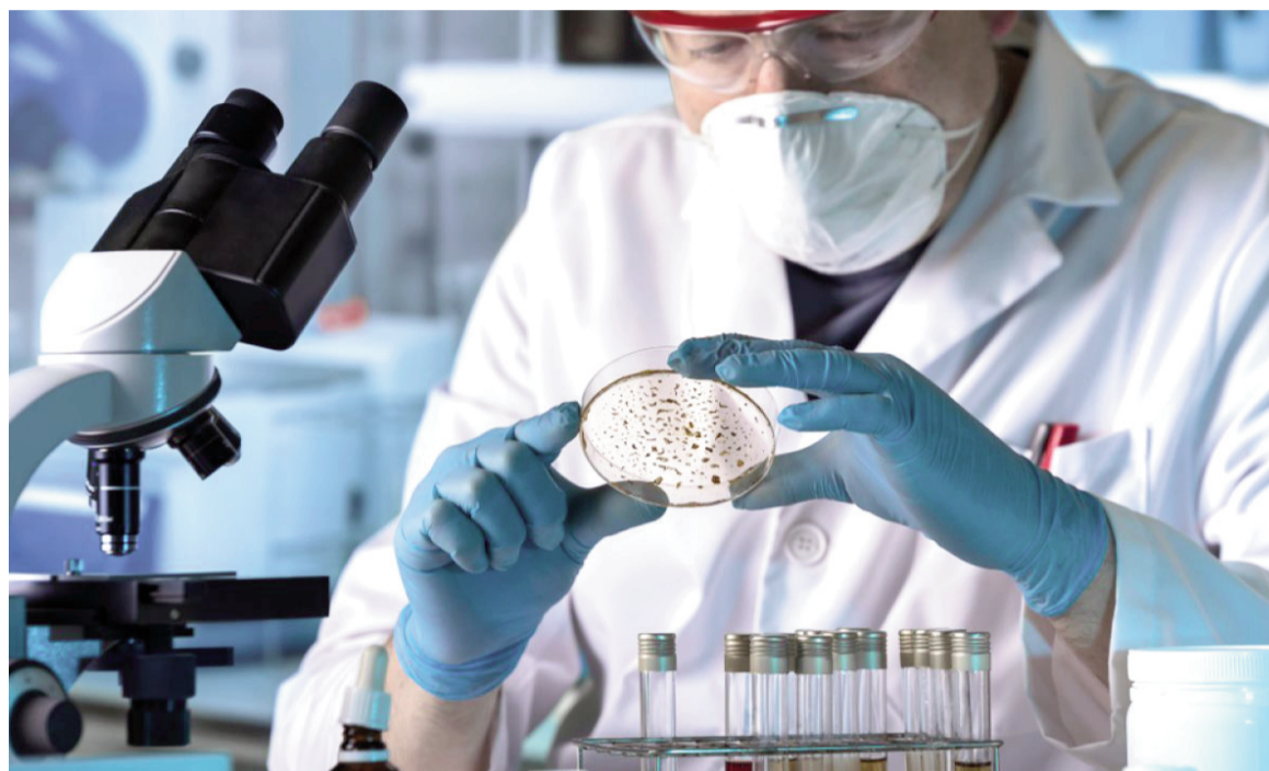
La resistencia bacteriana ya genera miles de muertes cada año y obliga a buscar estrategias innovadoras a nivel global. ILUSTRACIÓN

El trabajo se enfocó en infecciones causadas por micobacterias no tuberculosas, especialmente Mycobacterium abscessus , que afecta a personas con fibrosis quística. Estas bacterias logran sobrevivir a los antibióticos, aun sin re-