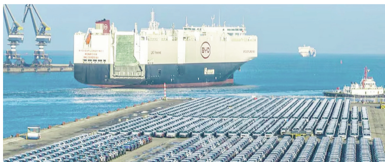
El buque de BYD bajó autos de la marca en el puerto de Zárate.

En tanto la producción total de vehículos se redujo 31,6% y la de utilitarios bajó 4,1% respecto a 2024.