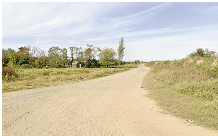
Estanislao del Campo y Tierra del Fuego, inmediaciones al descampado en que hallaron al jubilado maniatado.

dicha situación de vulnerabilidad. Al llegar al lugar indicado, ubicado en Estanislao del Campo y Tierra del Fuego, personal policial encontró al hombre atado de pies y manos. La víctima fue asistida en el lugar y puesta a resguardo, mientras se iniciaban las primeras actuaciones para