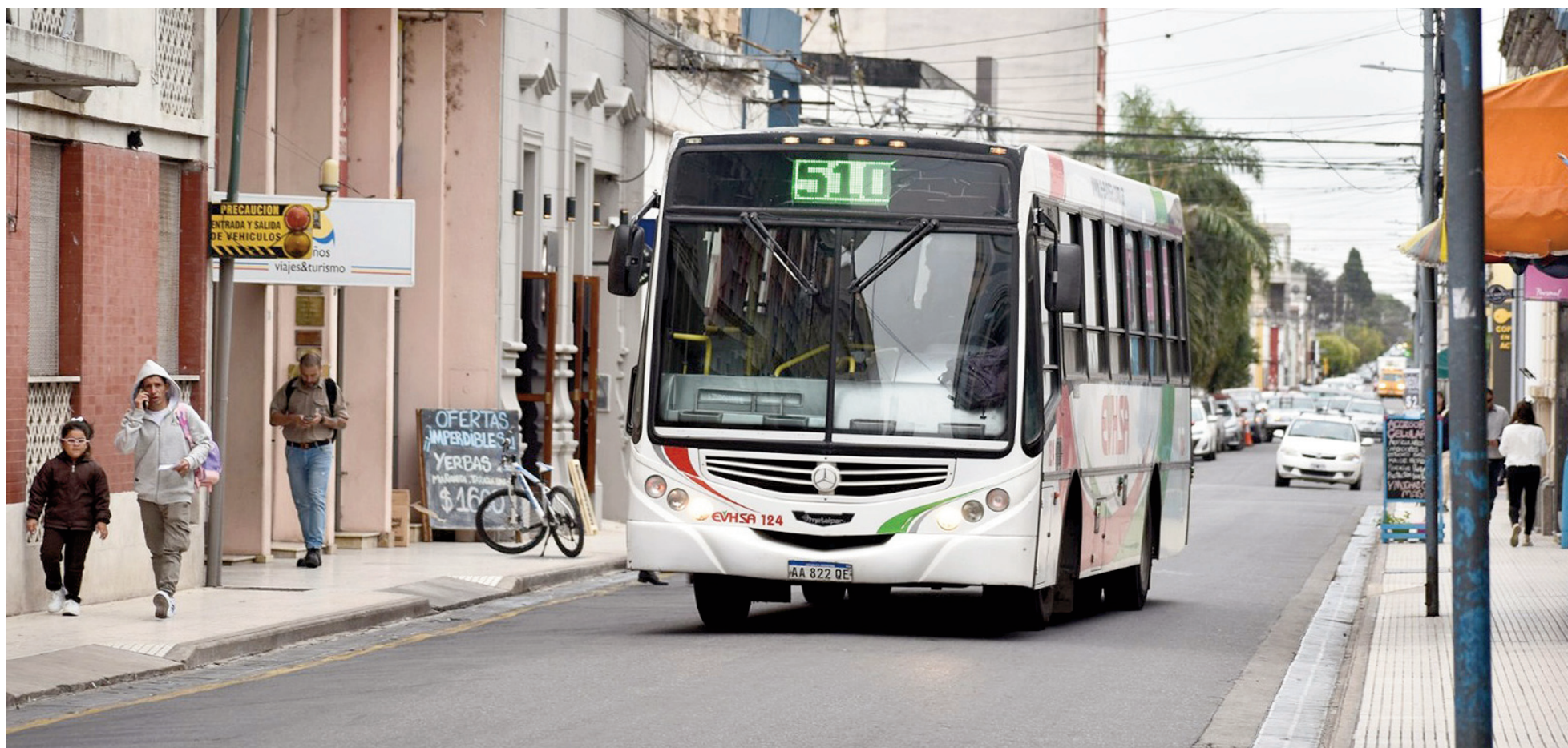
UTA y Fatap vuelven a reunirse a las 16:00 de hoy en audiencia paritaria convocada por el Gobierno nacional.

LAS PARTES VUELVEN A REUNIRSE ESTA TARDE, CONVOCADAS POR LA SECRETARÍA DE TRABAJO DE LA NACIÓN