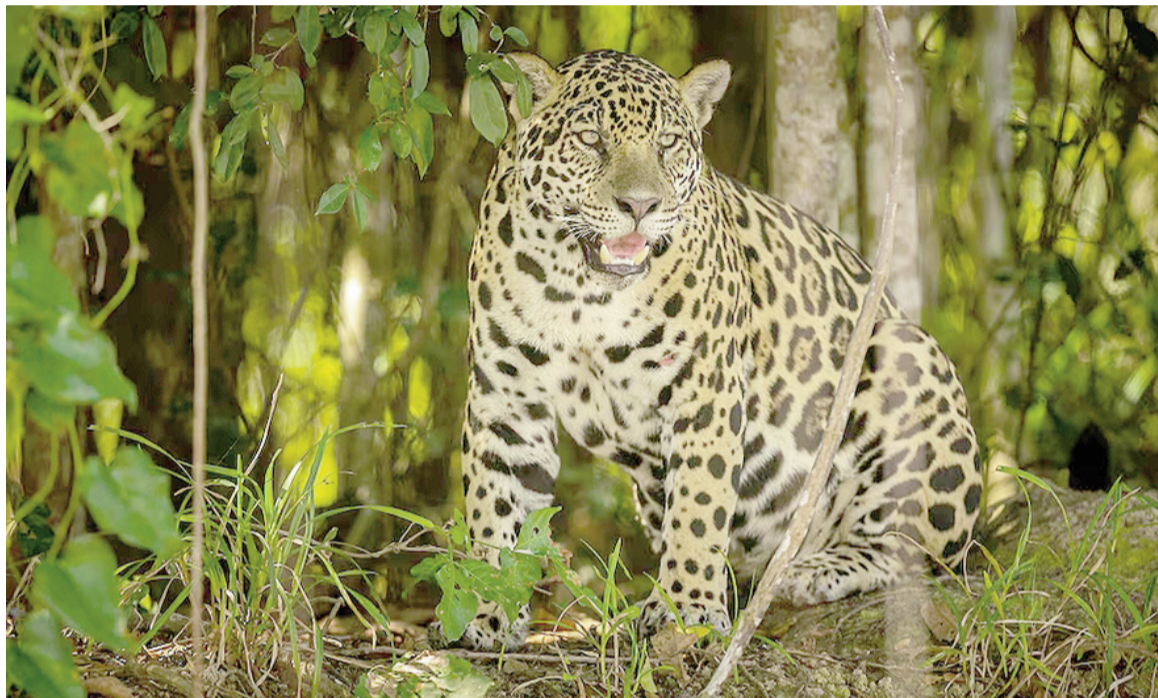
Janaína y sus dos cachorros fueron captados por cámaras trampa en el sector brasileño del Parque Nacional Iguazú.

De acuerdo con el Proyecto Onças do Iguazú, en 2019 tuvo dos o cinco