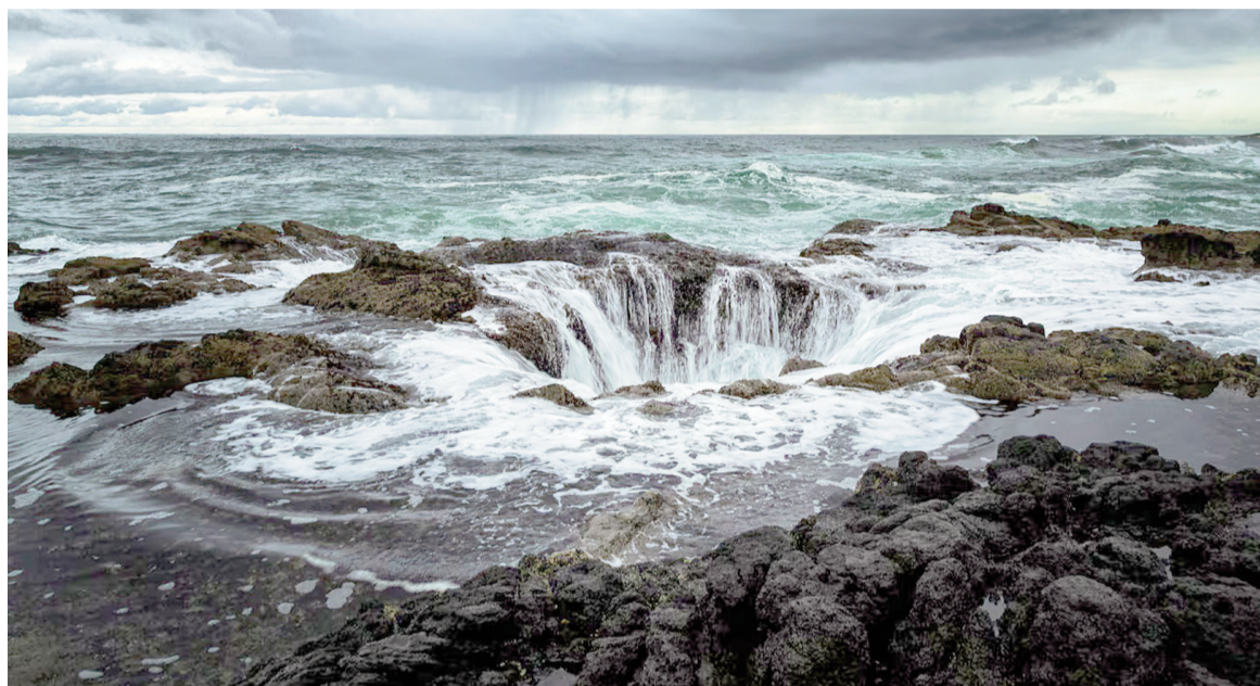
Una de las vistas laterales del imponente Pozo de Thor.

Lejos de ser un vacío infinito, el Pozo de Thor es una cavidad profunda conectada a túneles y grietas subte-