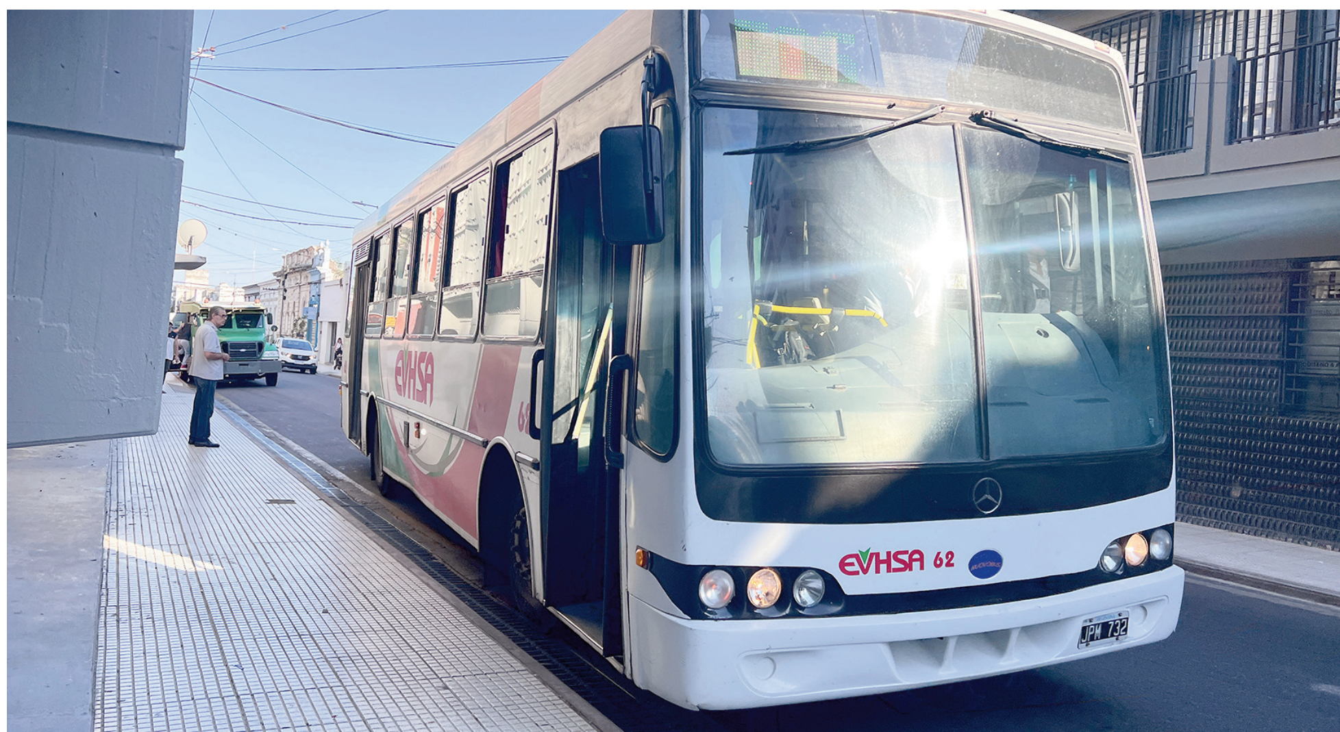
A la espera de la cuarta audiencia paritaria de la actual negociación, la UTA ya se declaró "en estado de alerta".

Al cabo de tres audiencias paritarias por teleconferencia, el próximo encuentro fijado por el Ministerio de Capital Humano está previsto para hoy. Hasta ahora no hay avances en la negociación cuyo objeto es definir una nueva escala salarial para los choferes de colectivos de corta y media distancia del interior del país. La UTA se mantiene en "estado de alerta".