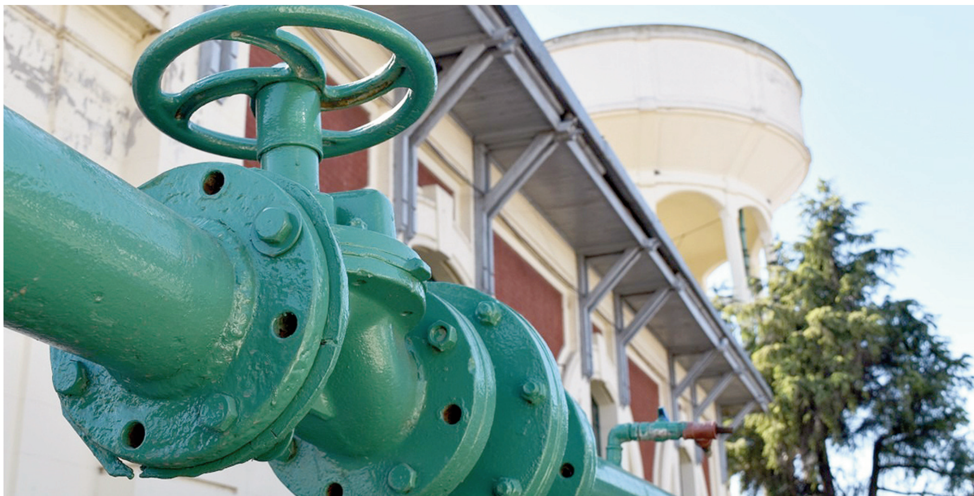
En San Nicolás la cobertura del servicio de agua corriente alcanza a cerca del 98% de los hogares.