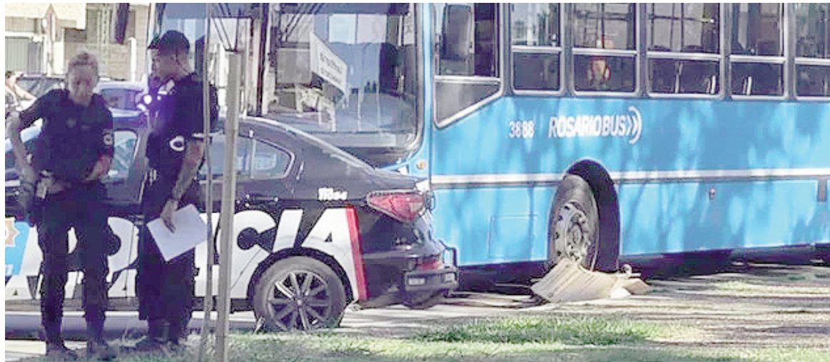
SIES constató que el hombre perdió la vida tras el accidente.

Al llegar al lugar, los efectivos encontraron un colectivo de la línea 128 y a un hombre tendido sobre la cinta asfáltica. La víc-