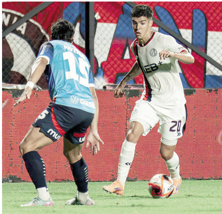
El Ciclón tendrá un compromiso de riesgo ante Lanús. WEB

Las alineaciones de ambos equipos todavía no están confirmadas, pero debido a la amnistía otorgada