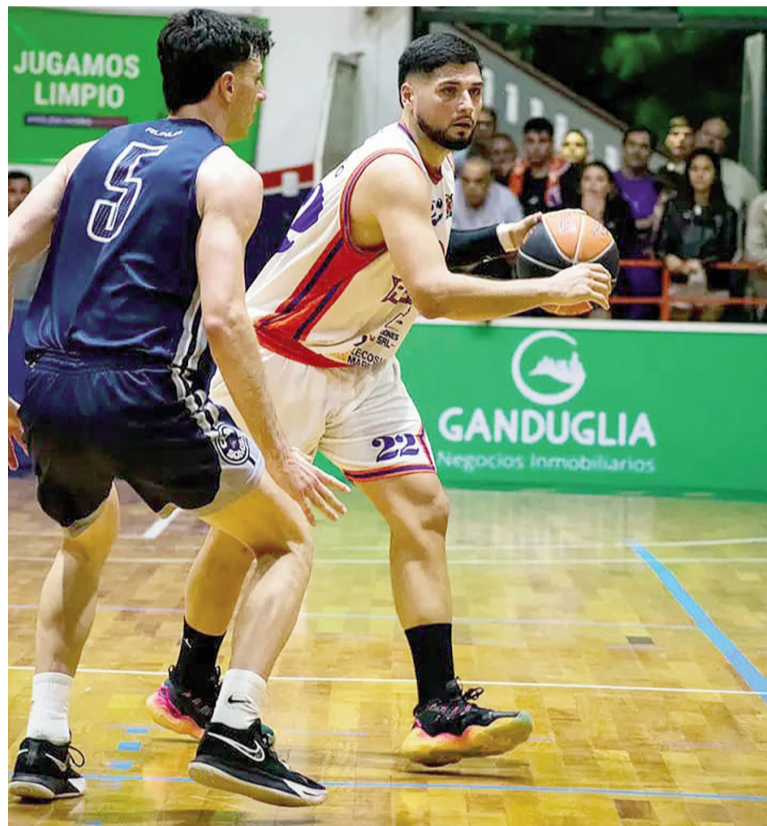
Los nicoleños se preparan para ir por el ascenso en este 2026.