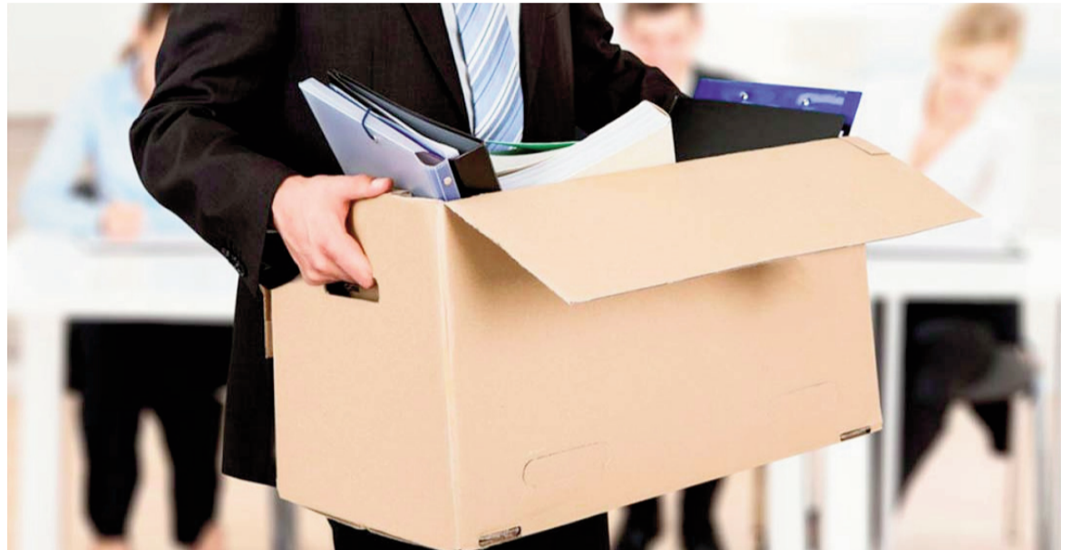
El Gobierno llevó adelante un recorte de casi 60.000 puestos de trabajo públicos.

A su vez, las cuatro instituciones con menores reducciones porcentuales de puestos de trabajo fueron el Instituto Nacional de Servicios