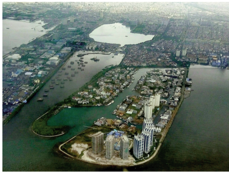
Yakarta enfrenta un proceso de hundimiento acelerado que afecta a millones de habitantes y desafía la infraestructura urbana.

Como urbe costera, la capital sufre de inundaciones cada vez más