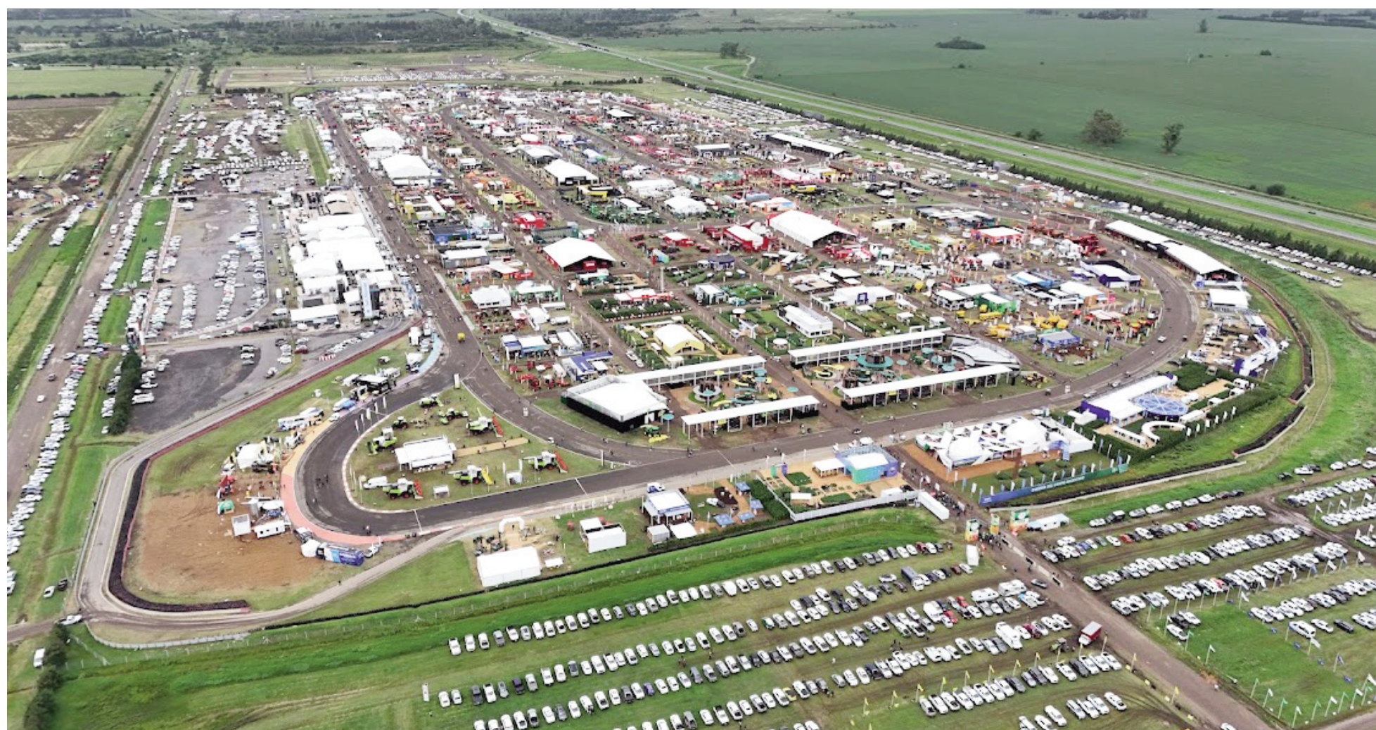
En 2017, Exponenciar y la Municipalidad de San Nicolás suscribieron un convenio por 15 ediciones de Expoagro en el Predio Ferial y Autódromo de nuestra ciudad.