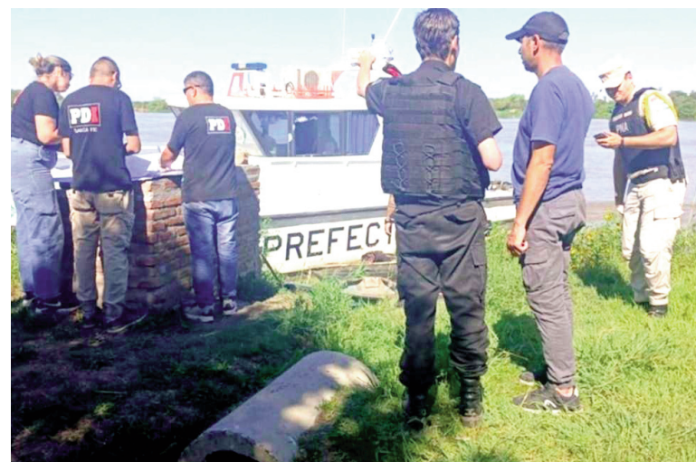
Además de los cuerpos, se hallaron un arma y un animal vacuno sin vida dentro de la embarcación.

nisterio Público de la Acusación (MPA) tomó intervención en el caso, ordenando el traslado de los