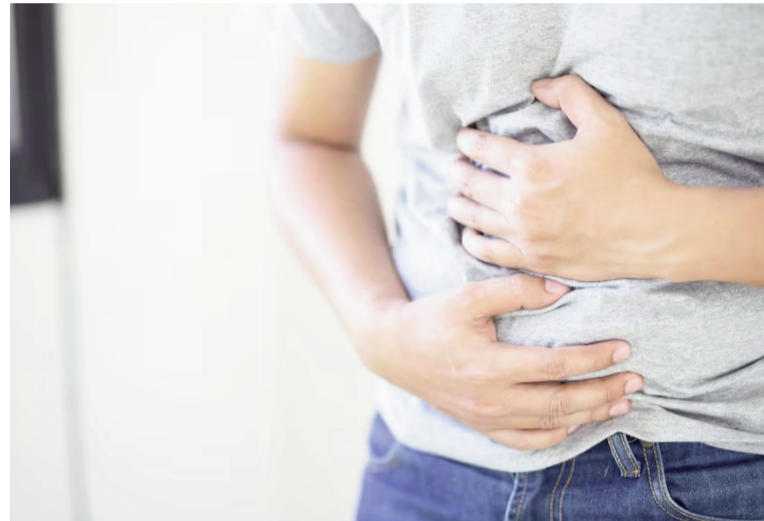
Los trucos para aliviar la pesadez tras las comidas de Año Nuevo.

esenciales son antiespasmódicos y ayudan a expulsar los gases.