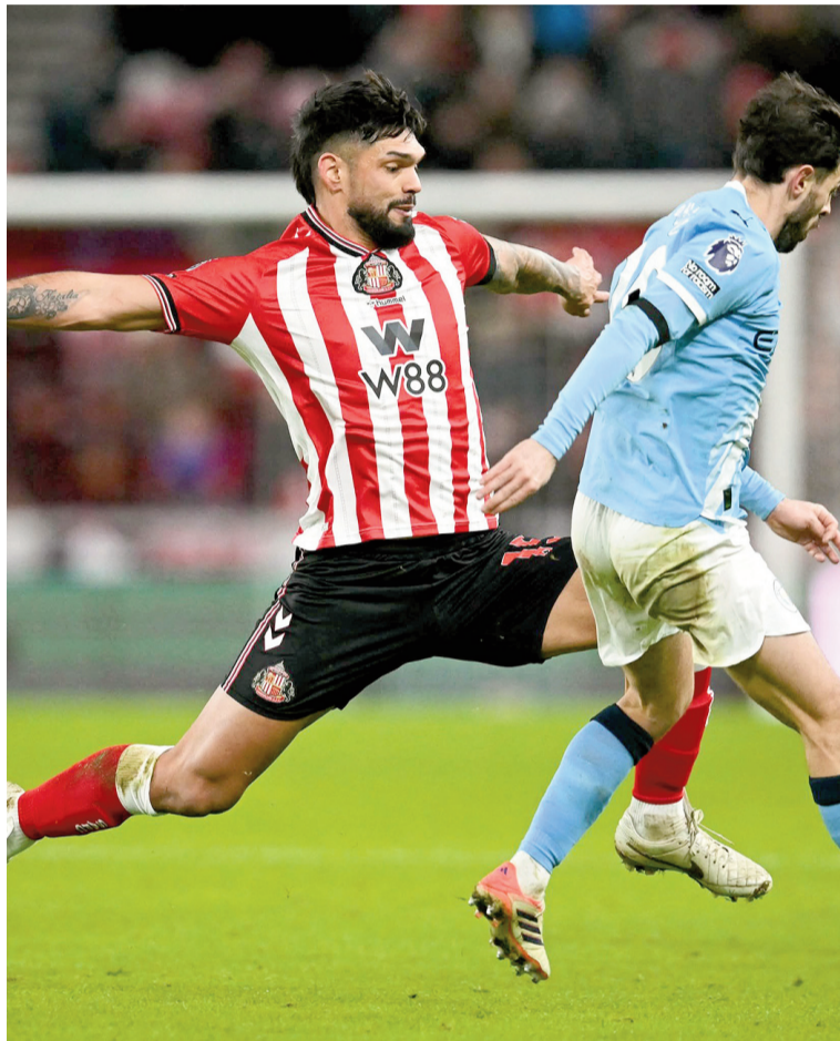
Manchester City no pudo doblegar al Sunderland.

Leeds se mostró ordenado, resistió la presión y en el segundo tiempo cerró espacios para sostener un punto clave que lo man-