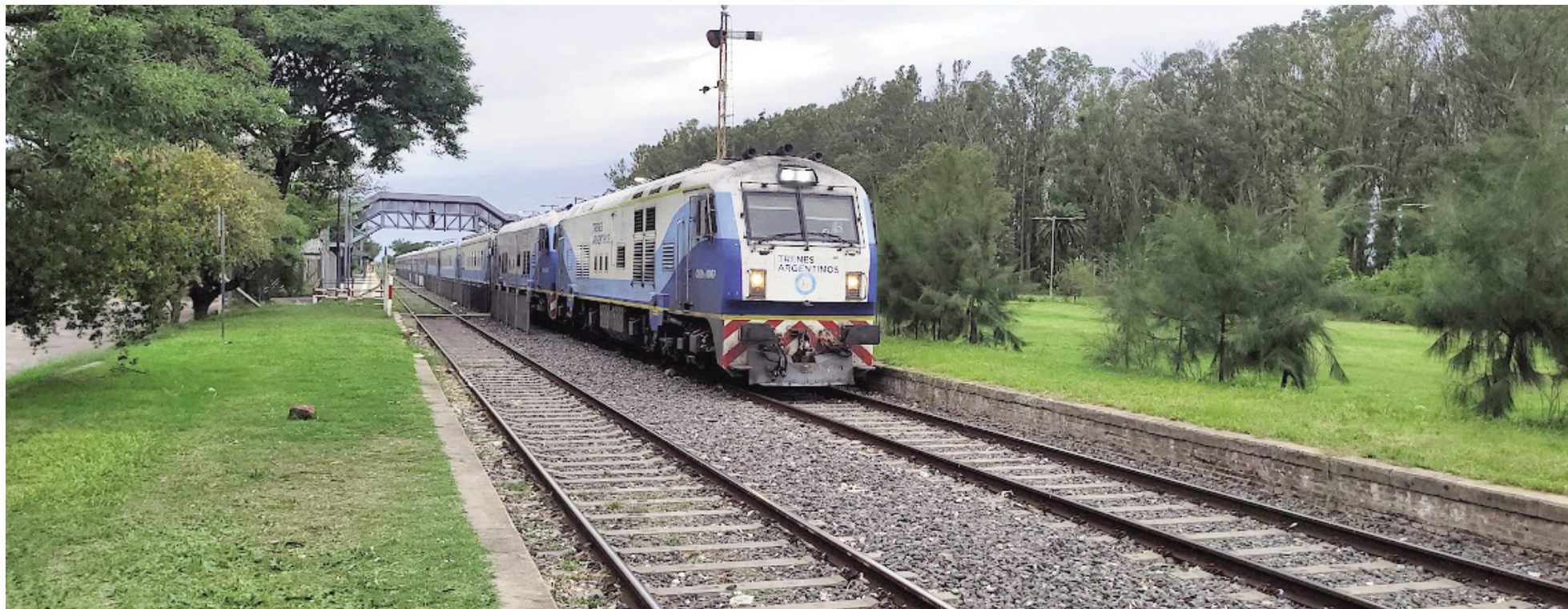
La Fraternidad denunció la interrupción de los servicios ferroviarios de larga distancia hacia Córdoba y Tucumán.

La Fraternidad, el gremio que representa a los maquinistas ferroviarios, denunció que los trenes de pasajeros desde Buenos Aires a Córdoba y a Tucumán ya no volverán a circular. Ambos servicios conectaban con nuestra ciudad, en cuya estación tenían paradas. “Privan a miles de usuarios de la posibilidad de transportarse a costos accesibles para la gente que menos tiene”, denunció la entidad.