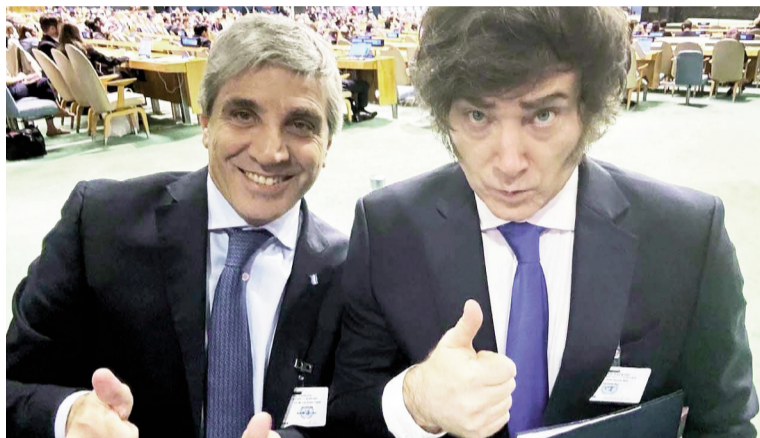
Milei y Caputo tendrán que juntar billetes verdes para acumular reservas.

En este 2026, la discusión ya no gira en torno a si la economía argentina crecerá en 2026, sino cuánto y cómo lo hará. Las proyecciones más conservadoras ubican la expansión entre 2,5% y 3%, mientras que los escenarios optimistas hablan de un rebote cercano al 5%, apalancado en la estabilización macro y la baja de la inflación. Sin embargo, el consenso pareciera ser otro: el crecimiento será desigual y con una