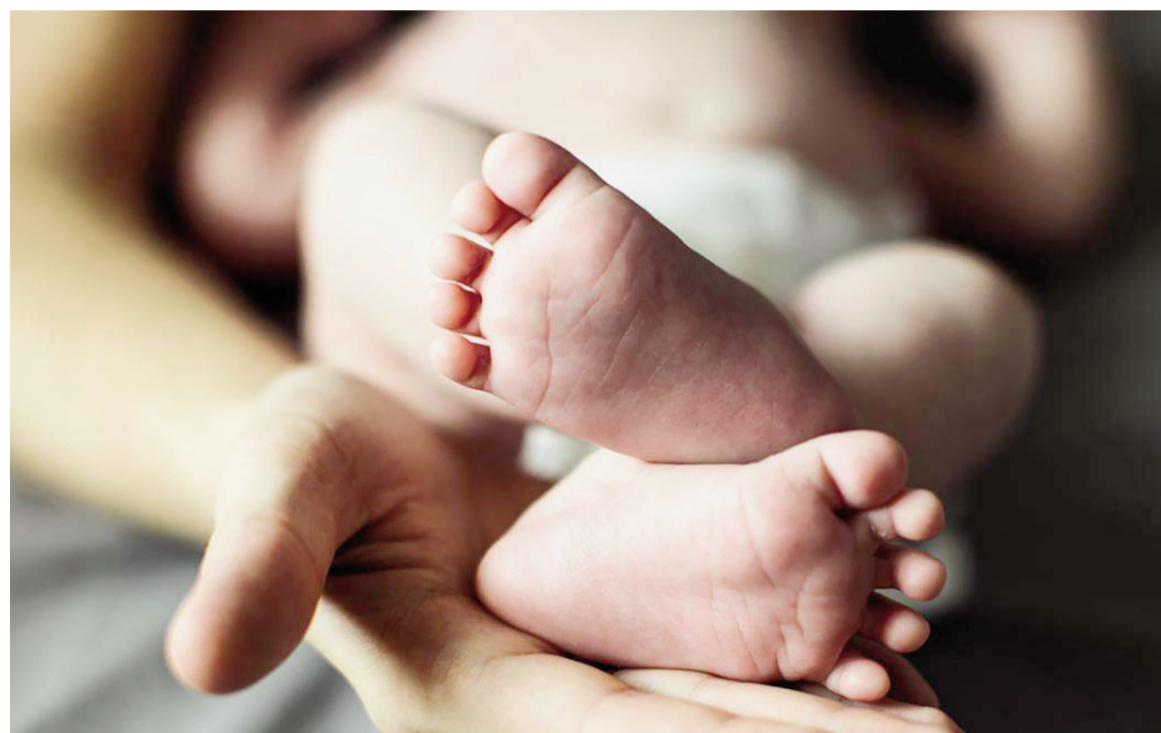
En San Nicolás, la tasa de natalidad cayó un 41,5% en el período 2014-2024.

En 2014, en San Nicolás nacieron vivos 2657 bebés. En 2024 hubo 1554 nacimientos. En el medio hubo un solo año en el cual el registro aumentó: fue 2018, cuando hubo un total de 2470 nacimientos. Antes y después de ese año, los datos muestran una caída en la cantidad de nacimientos en San Nicolás. Veamos: en 2014, como se escribió más arriba,