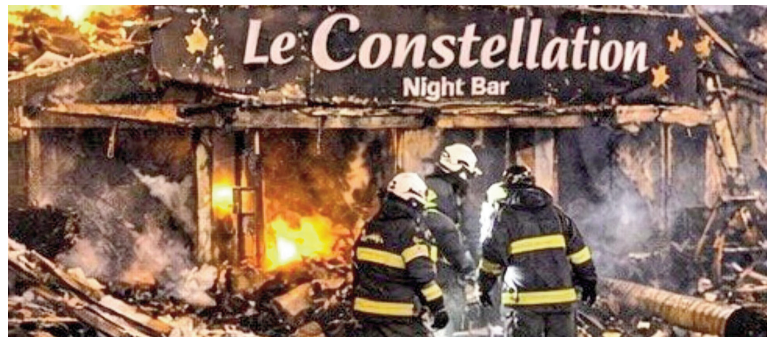
Otra vez la tragedia en medio de un festejo.

El fuego se desató en un bar de la localidad de Crans-Montana, cuando una multitud celebraba el inicio del 2026.