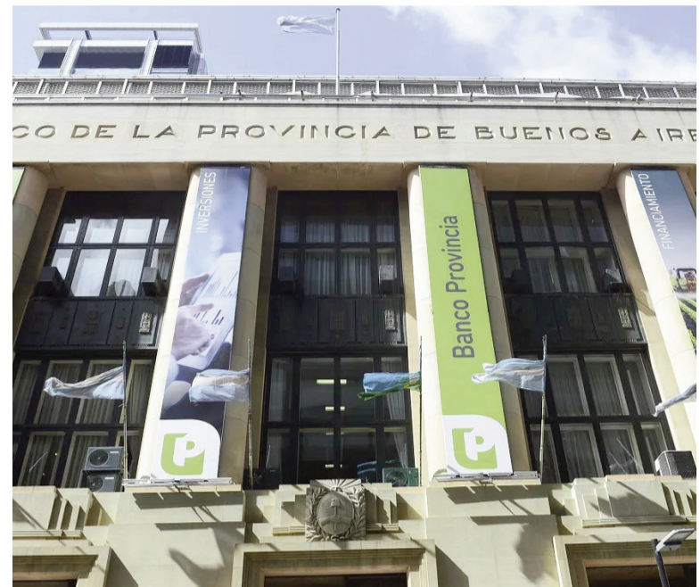
Casa central de Banco Provincia.