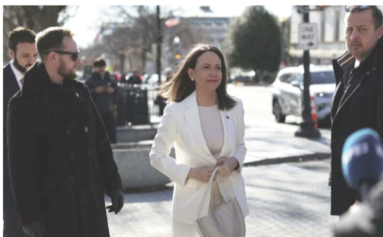
María Corina Machado se reunió con Donald Trump.

sidente Trump para la libertad de Venezuela», afirmó la dirigente opositora, en una breve intervención pública.