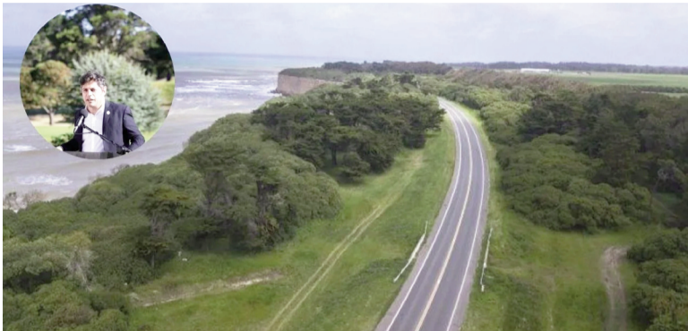
La obra será financiada con créditos.

En plena temporada de verano 2026, el gobernador de la provincia de Buenos Aires, Axel Kicillof, anunció el inicio de una nueva obra vial con el objetivo de seguir mejorando las carreteras que conectan la Ciudad de Buenos Aires y el conurbano bonaerense con la costa atlántica.