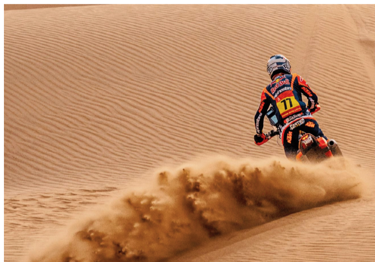
El salteño hoy tendrá una jornada clave en la anteúltima etapa.