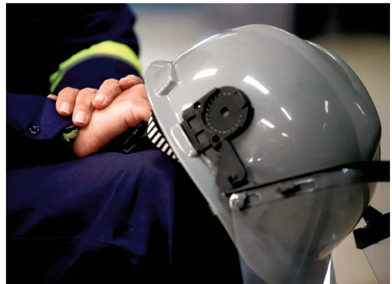
Desde la asunción de Javier Milei el empleo registrado muestra una fuerte contracción.

presas que cerraron son firmas de hasta 500 trabajadores, principalmente PyMEs, el 66,8% de los puestos perdidos correspondió a compañías de gran porte.