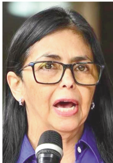
Delcy Rodríguez, presidenta interina de Venezuela.

Además, durante la presentación de la rendición de cuentas ante el Parlamento sobre el casi primer año del tercer mandato de Nicolás Maduro, la flamante mandataria venezolana pidió «un minuto de aplauso para nuestros jó-