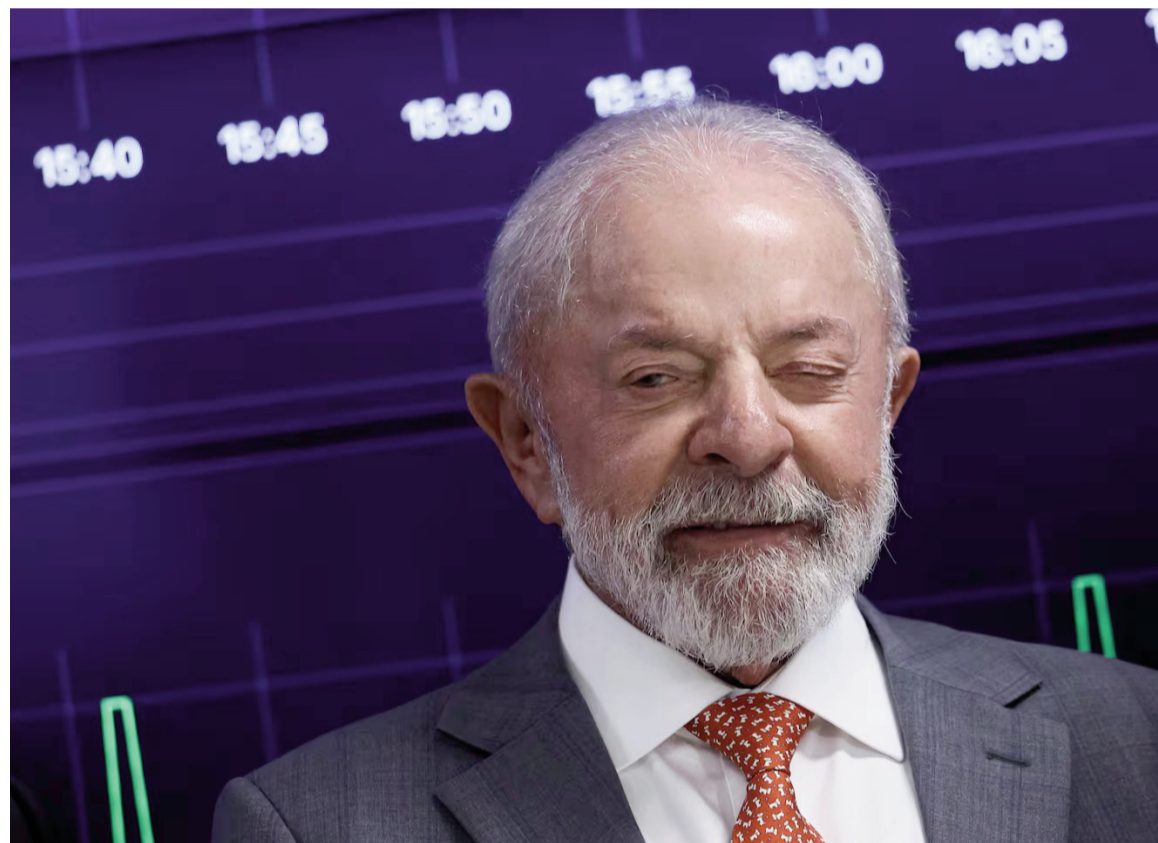
Lula da Silva recibirá a los líderes de la Unión Europea antes de la firma del acuerdo comercial entre el Mercosur y la UE.

El mandatario de Brasil no estará en Paraguay. Milei, Peña y Orsi participarán del acto en el que se formalizará el histórico convenio. Qué dijeron en Casa Rosada.