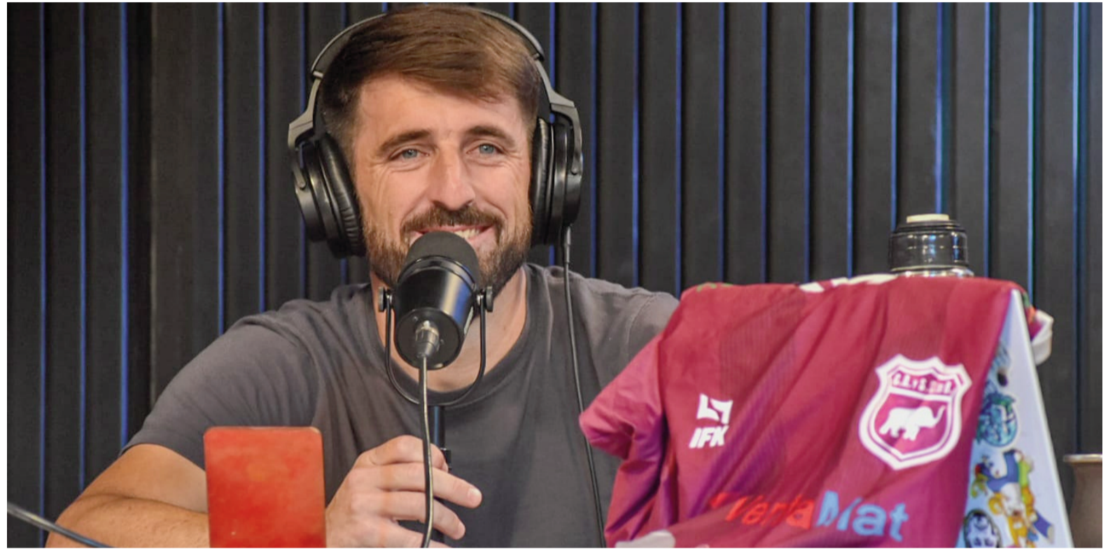
El goleador ramallense repasó su carrera en La Deportiva. JENNIFER MARTÍNEZ

Olego logró con la camiseta de Defe los ascensos al Argentino B y al A. Y en su primera temporada en la tercera categoría del fútbol nacional, llamó la atención de un gigante como Talleres de Córdoba, que en esa época estaba en la misma categoría. Para el DT de la T, Cacho Sialle, convencerlo no fue fácil. “Sialle