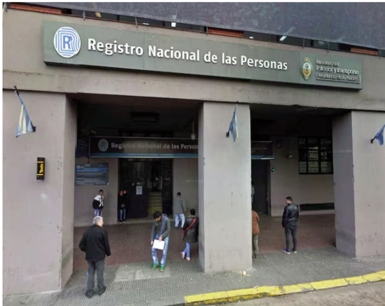
La sede del Registro Nacional de las Personas.

A partir de mañana 1 de febrero, habrá cambios en el DNI electrónico y el pasaporte. El Registro Nacional de las Personas (Renaper) aprobó nuevas disposiciones que buscan reforzar la seguridad y modernizar los documentos. El objetivo es alinearlos con los estándares internacionales.