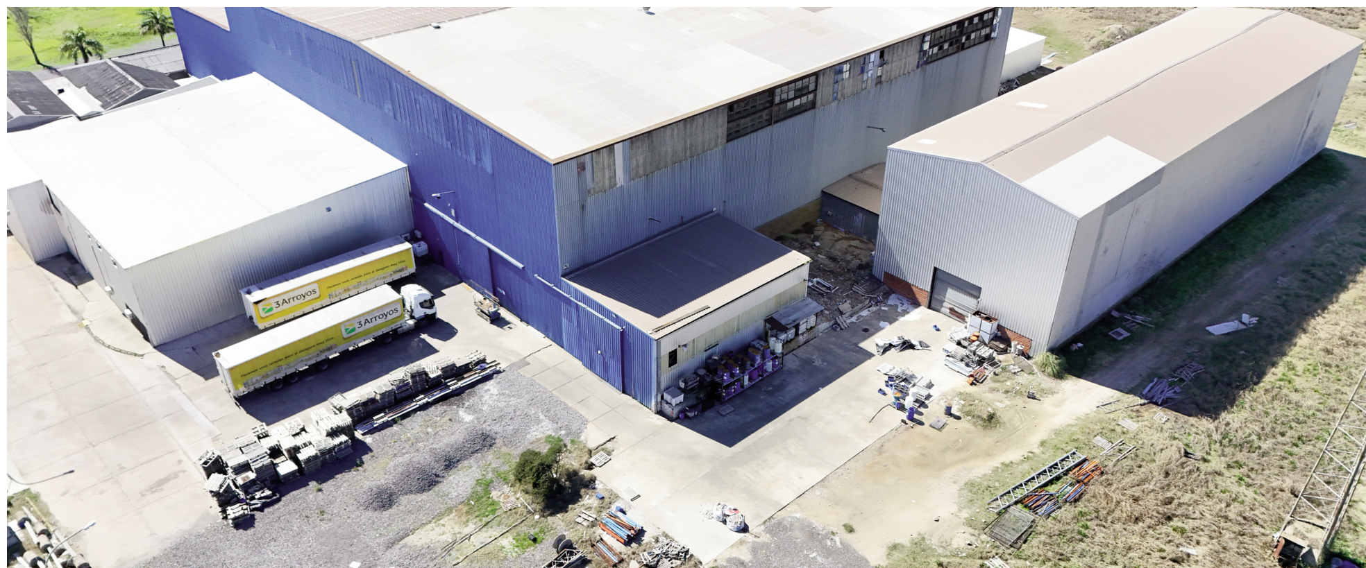
El fentanilo contaminado fue producido en la planta de Laboratorios Ramallo, clausurado desde mayo del año pasado.