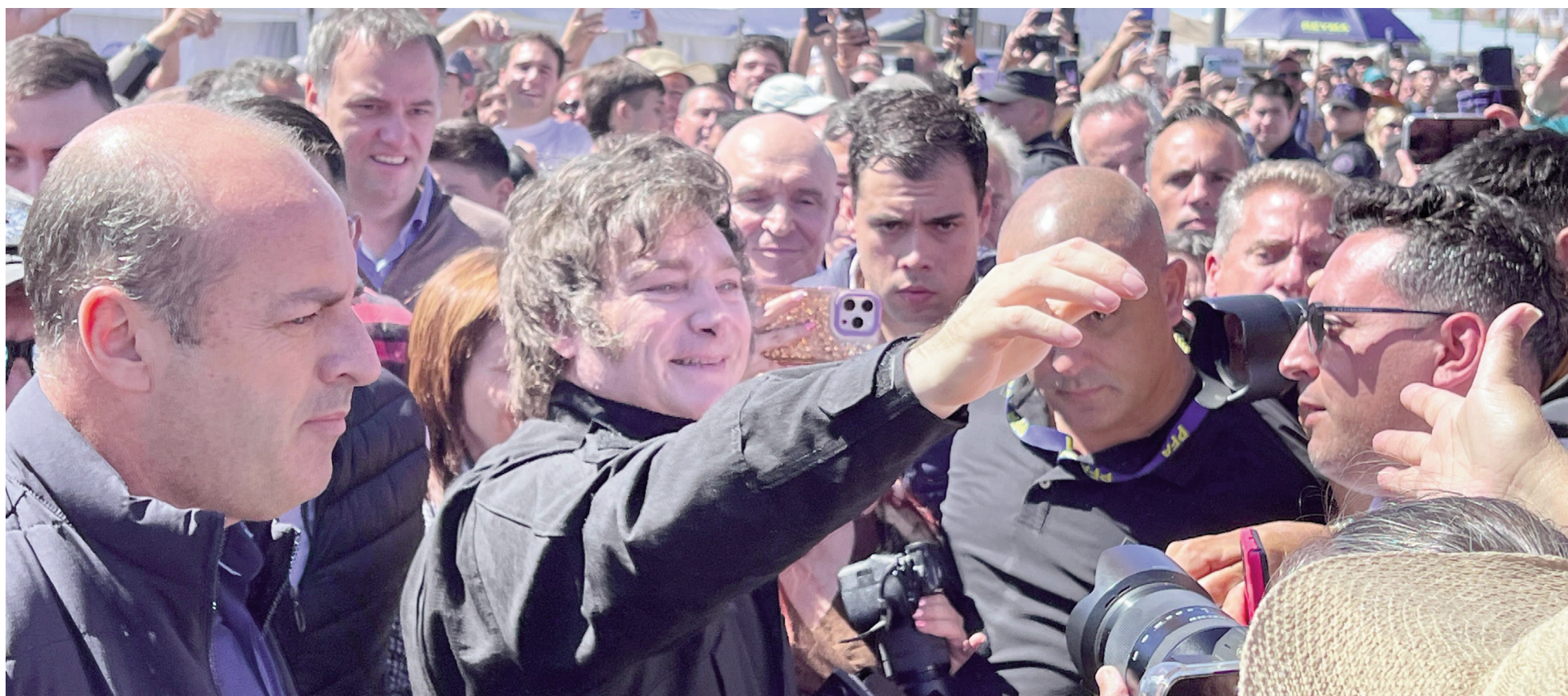
El presidente Javier Milei visitó el Predio Ferial de San Nicolás el 14 de marzo pasado, para el cierre de la edición 2025 de Expoagro.