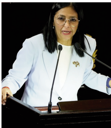
La presidenta encargada de Venezuela, Delcy Rodríguez.

«Hemos decidido impulsar una ley de amnistía general que cubra todo el período de violencia política, desde 1999 al presente. Y encargo a