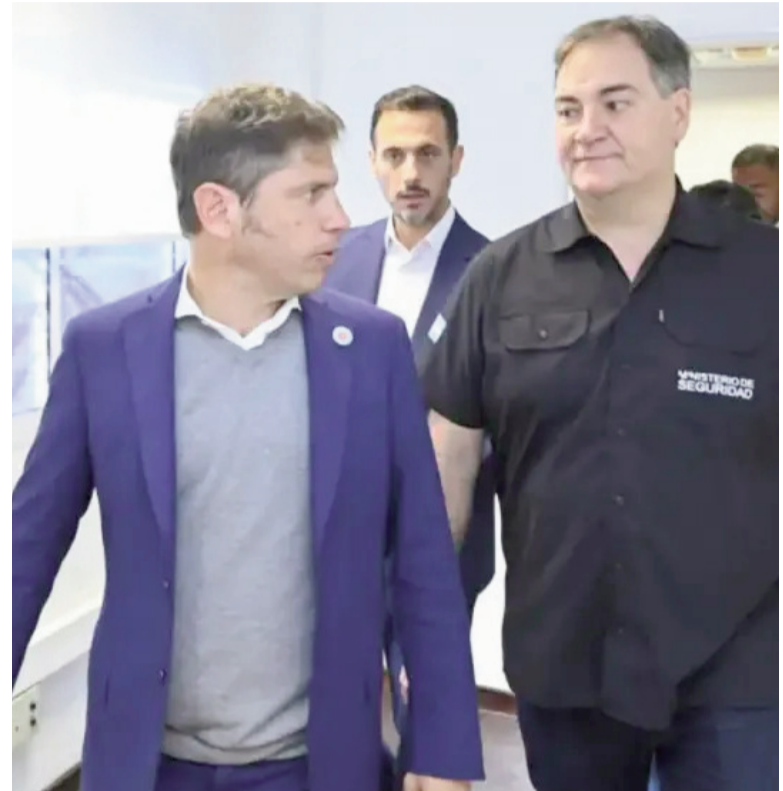
Kicillof fijó su postura sobre la responsabilidad penal juvenil.

provincia se aplicaron medidas de seguridad en casos graves, con encierro en institutos de menores, una facultad que corresponde a la Justicia. “Modificar la edad no resuelve nada por sí mismo. Insistir en ese camino es un fracaso asegurado”, agregó.