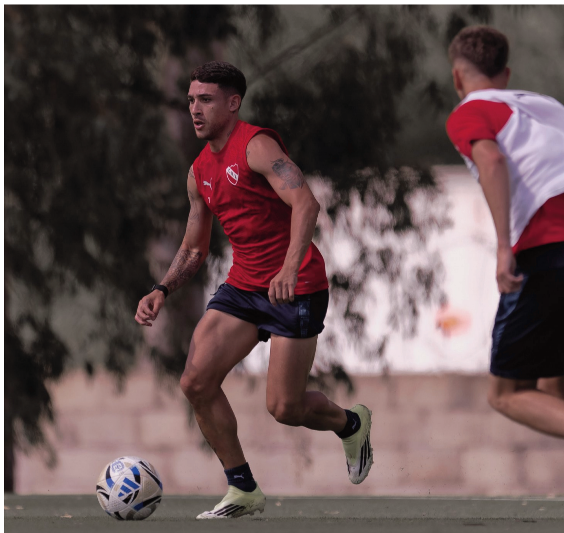
El Rojo buscará sumar de a tres en Avellaneda. WEB

El Rojo buscará su primera victoria ante el conjunto de Liniers que conduce el mellizo, a iniciarse a las 19.45. mientras que previamente San Lorenzo chocará con Central Córdoba de Santiago del Estero en el Nuevo Gasómetro.