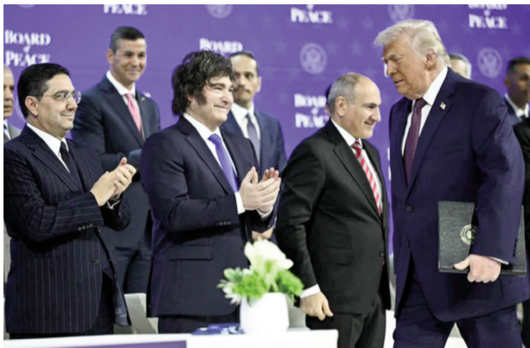
Admiten contactos con EE.UU. por deportados.

En la mesa chica del jefe de Estado reconocen además que la medida abriría un conflicto político y social "fuerte" en el plano doméstico. Funcionarios admiten que la