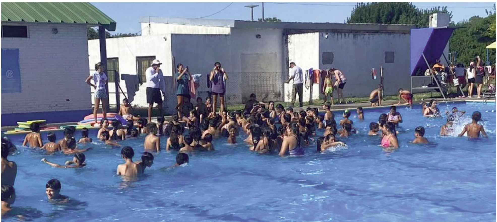
Estudiantes nicoleños participaron de los cierres del programa Escuelas abiertas en verano en los distintos espejos de agua.

Ayer viernes fue la última jornada de las Escuelas abiertas en verano 2026, una iniciativa del Gobierno bonaerense que se extendió durante todo el mes de enero, con la participación a nivel local de más de 600 estudiantes de escuelas públicas. Las autoridades educativas de nuestro distrito manifestaron gratificación por la alta concurrencia de chicos y chicas de todas las edades, así como por el compromiso de docentes, auxiliares de educación y demás actores intervinientes.