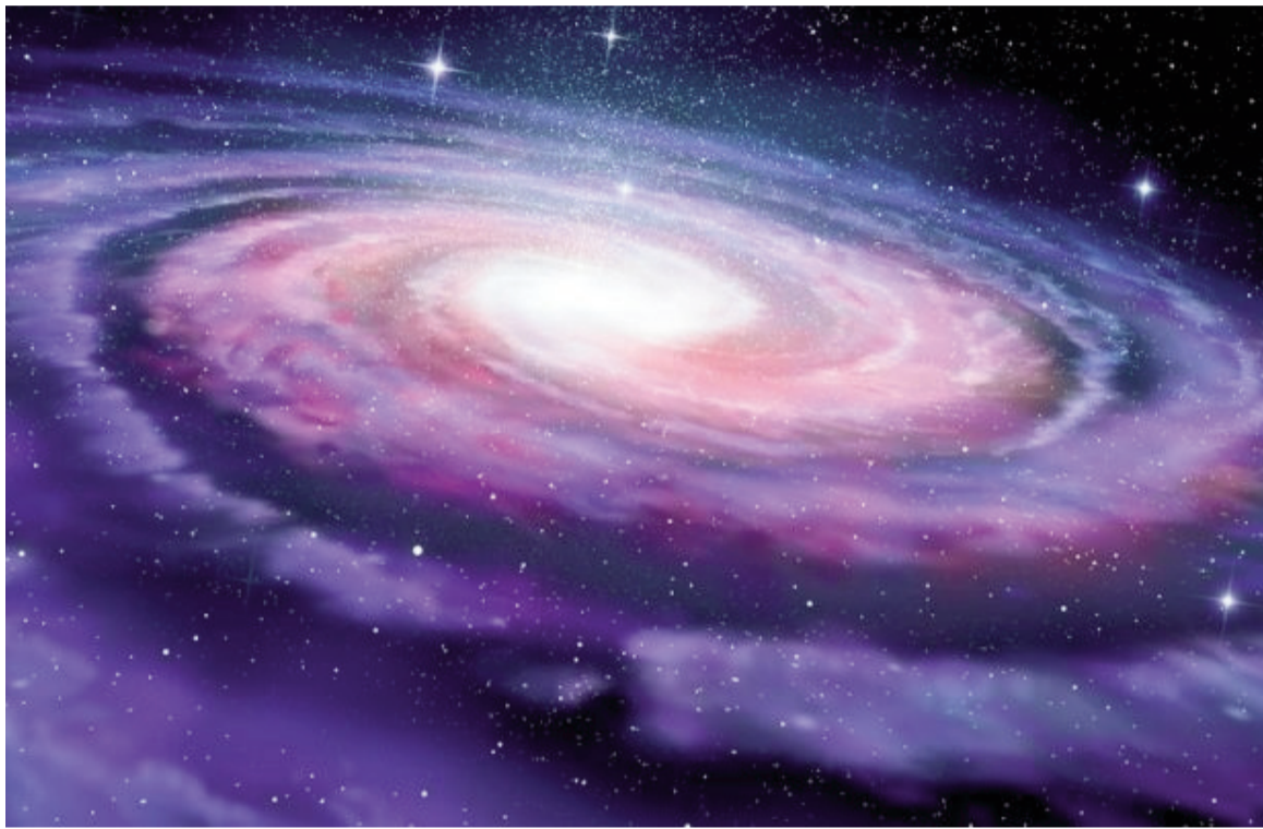
La investigación retoma una hipótesis planteada en 1966 sobre el uso de ondas de radio polarizadas a distintas frecuencias para medir la estructura tridimensional de los campos magnéticos galácticos.