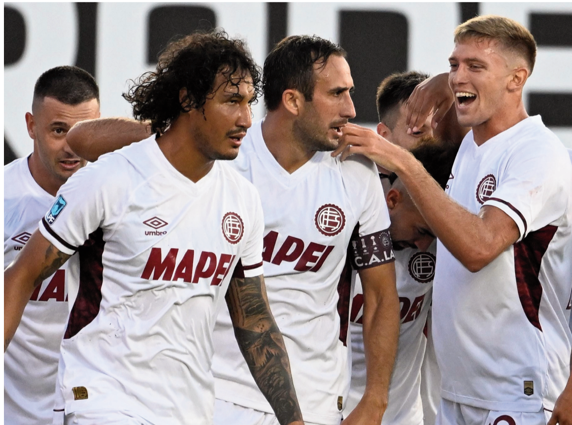
El equipo de Pellegrino tuvo un buen estreno como visitante.

El Granate mostró una buena actuación y se impuso por 3 a 2 con goles de Rodrigo Castillo, Carlos Izquierdoz y Marcelino Moreno, mientras que Alexis Cuello, con un doblete, descontó para el Ciclón.