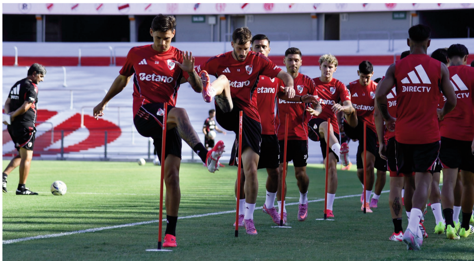
River comienza con su ilusión en 2026. WEB

El equipo de Gallardo intentará conseguir un triunfo en su estreno ante el "Guapo", mientras que Racing visitará a Gimnasia en el Bosque de La Plata. Por su parte, Rosario Central arranca frente a Belgrano en el Gigante de Arroyito.