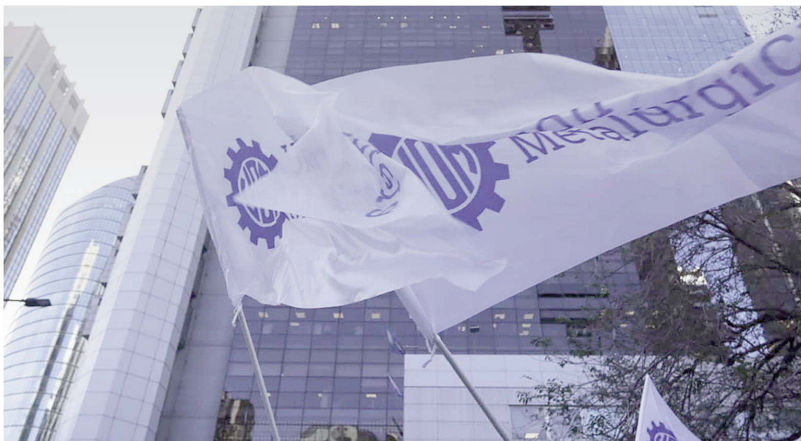
Al cabo de dos encuentros informales con abogados y directivos de Recursos Humanos, ahora la UOM busca reunirse con los CEO de las siderúrgicas.

visión de los meses anteriores tiene que ver con algunas medidas que de alguna manera emparcharon la falta de un acuerdo. Es que, entre julio de 2024 y abril de 2025, aun sin una escala acordada, las empresas del sector se avinieron a pagar sumas no remunerativas mensuales.