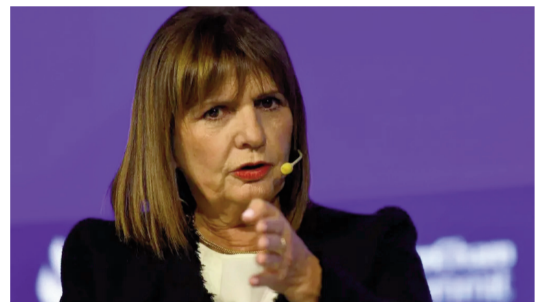
Senadora Patricia Bullrich.

Se da por descontado que el debate del nuevo Régimen Penal Juvenil junto con la reforma del Código Penal serán dos temas que Patricia Bullrich