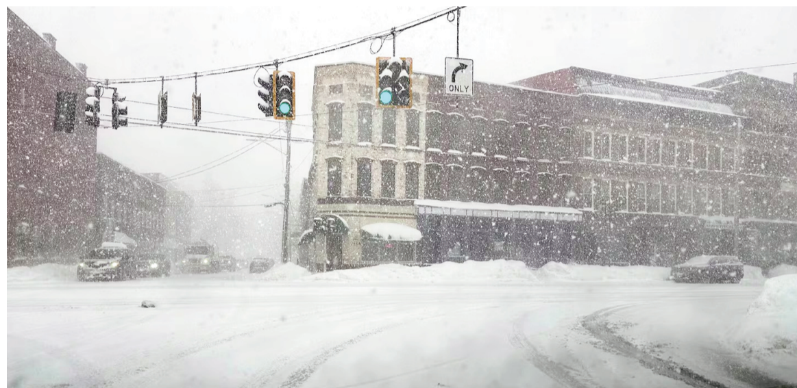
Más de 30 estados están en alerta por la tormenta en Estados Unidos.

Las autoridades estatales activaron un protocolo especial y movilizaron los equipos de respuesta ante la intensa caída de nieve.