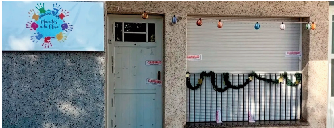
Jardín maternal "Manitos a la Obra" de Villa Constitución.

La Justicia santafesina avanza en la investigación por graves denuncias contra personal del jardín maternal "Manitos a la Obra" de Villa Constitución. Las presentaciones que dieron inicio al proceso habían sido efectuadas el pasado martes 13 de enero y daban cuenta de presuntas situaciones de maltrato infantil cuyas imágenes ha-