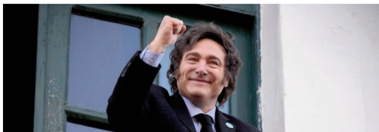
Milei criticó a los que dudaron del pago de deuda.

Por último, indicó que "es lo que hacen todos los países serios, por más que sea raro en la Argentina que vive defaulteando".