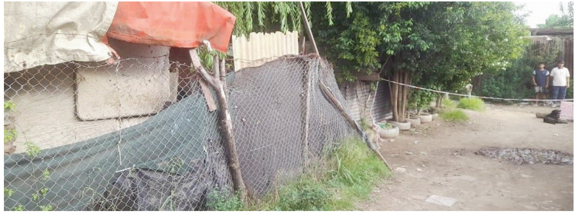
Asesinaron a balazos a una mujer en 27 de Febrero y Brasil.