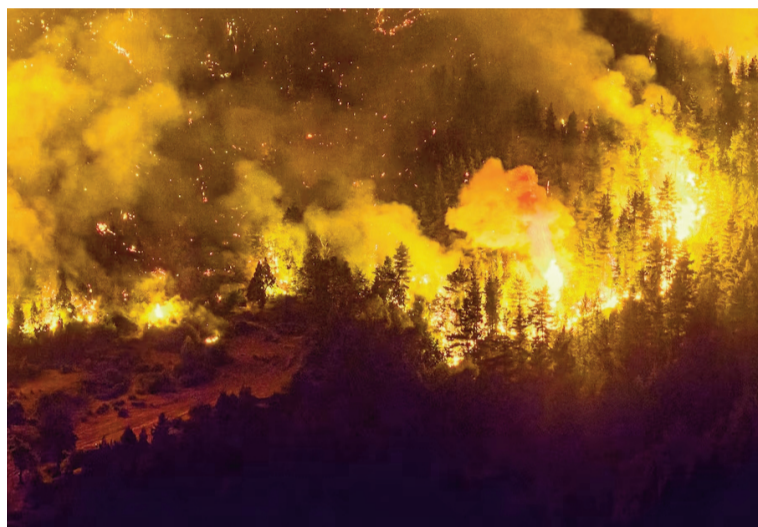
El fuego avanza en medio de pocas expectativas de lluvias para los próximos días.

Sobre el origen del fuego, el ministro fue categórico y descartó la hipótesis de negligencia: “Los peritajes tienen tres partes. Una es la inicial, donde se toman las primeras muestras y se ubica el punto cero, ahí se detectó según el perito ace-