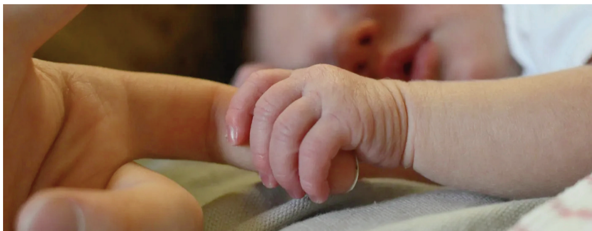
En Provincia se registran más muertes que nacimientos.

En perspectiva histórica, los registros oficiales muestran además