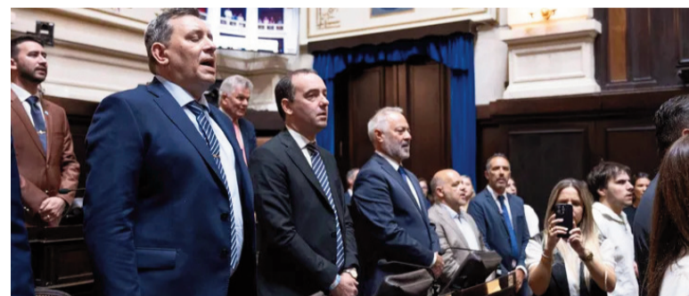
Bloque de La Libertad Avanza en la Cámara de Diputados bonaerense.