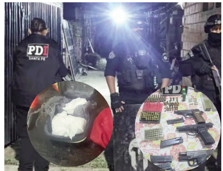
Tres niños eran utilizados para la venta de drogas

En las requisas se secuestraron 12 armas de fuego de distintos calibres y municiones, un kilo de cocaína —entre fraccionada y sin fraccionar—, vehículos, gran cantidad de teléfonos celulares, balanzas de precisión y elementos para corte y fraccionamiento de drogas.