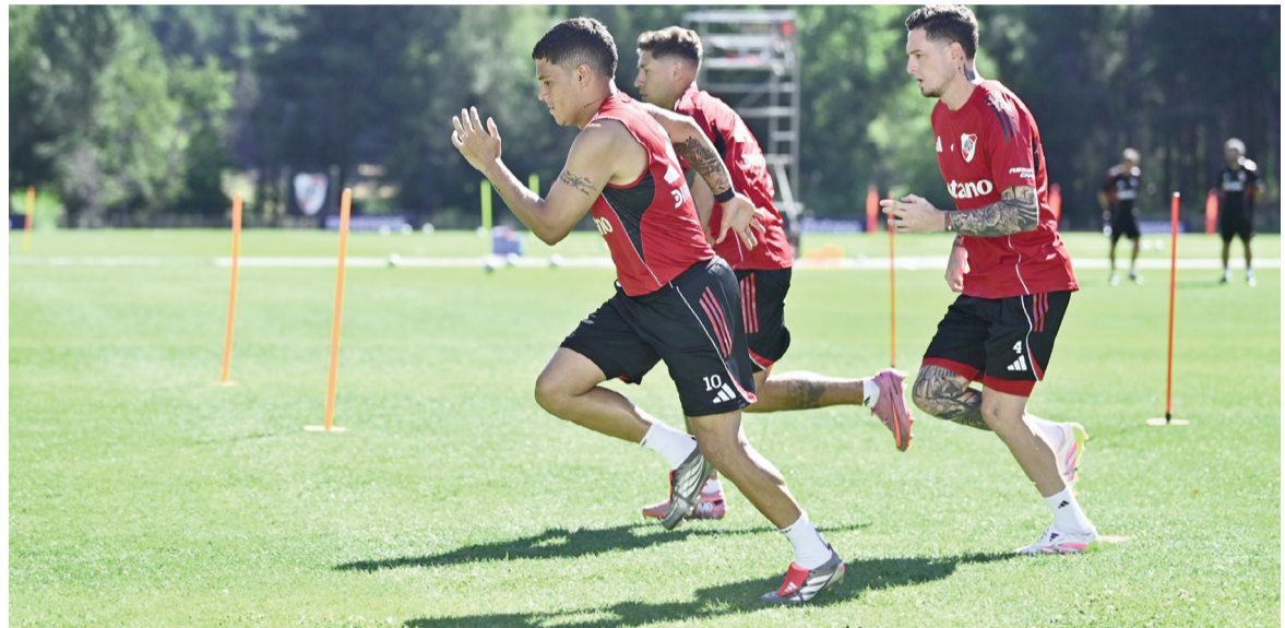
El River de Gallardo quiere arrancar el año con una sonrisa.