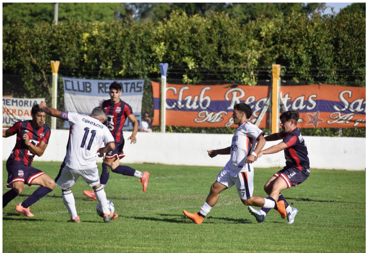
El Náutico tendrá que mostrar lo mejor de su repertorio.