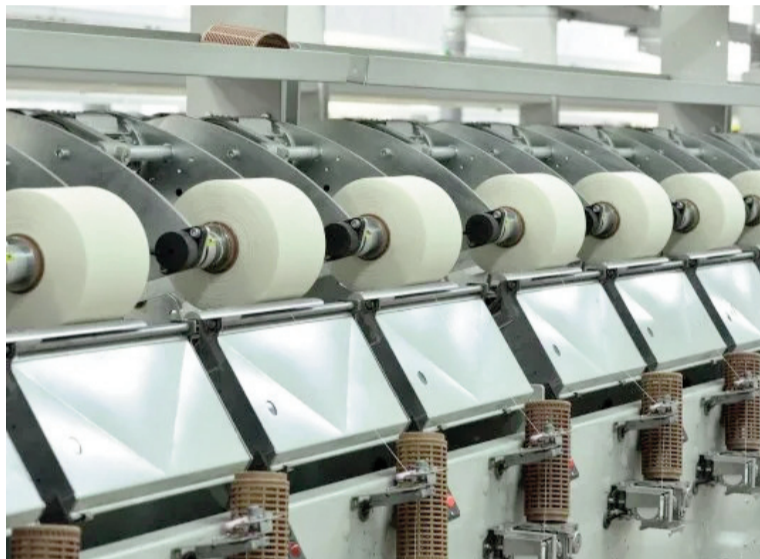
La crisis de la industria textil se profundizó a partir de la apertura importadora.

En el interior del país, la crisis golpeó con fuerza a la industria textil. Hilados S.A., empresa perteneciente al Grupo TN Platex, confirmó el cierre de su planta de confección en el Parque Industrial de