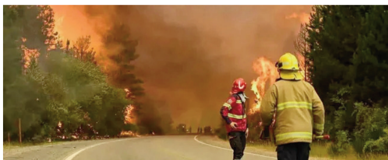
Habilitaron el tránsito en la Ruta 40 pero con suma precaución.

Por la noche del sábado, se cortó temporalmente un tramo de la Ruta 40 en las inmediaciones del paraje