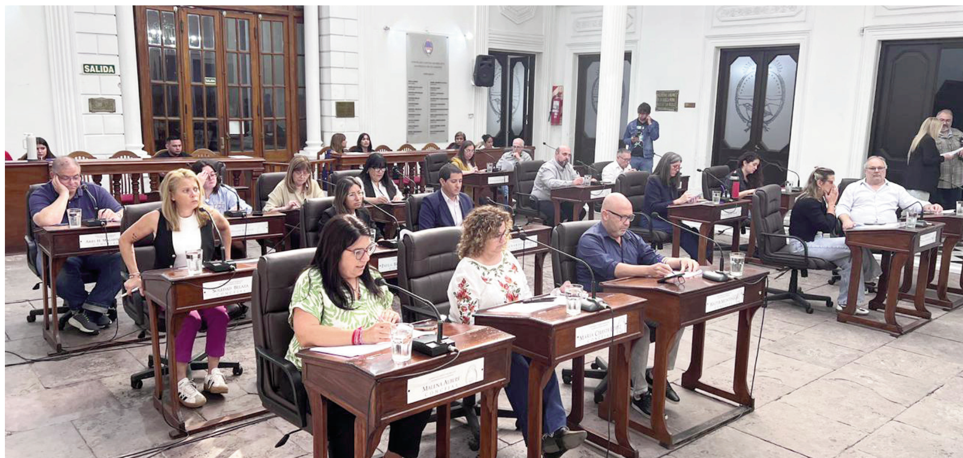
El Concejo Deliberante nicoleño funcionó en 2025 con un presupuesto de $742.741.567.