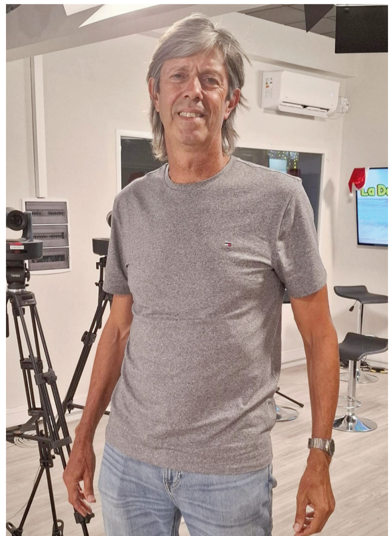
El extenista nicoleño fue 61° del mundo en 1987.