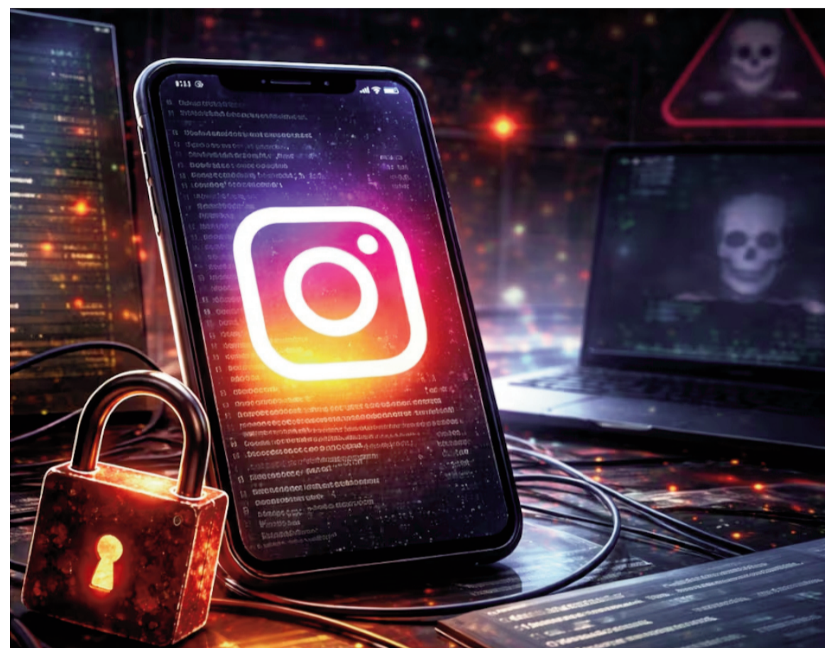
Se filtraron datos de 17,5 millones de cuentas de Instagram.

Nombres de usuario, correos electrónicos y números de teléfono asociados a los perfiles en la red social fueron expuestos en la dark web. Recomiendan cambiar las contraseñas.