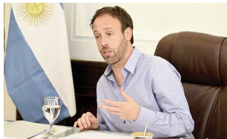
Ministro bonaerense Pablo López.

naerense remarcaron que la caída se arrastra desde 2024 y se profundizó durante el segundo año del gobierno de Javier Milei. Lejos de ser un fenómeno aislado, el retroceso de la recaudación aparece como el correlato fiscal de la política de ajuste, con menor actividad, menos consumo y una base imponible cada vez más reducida.