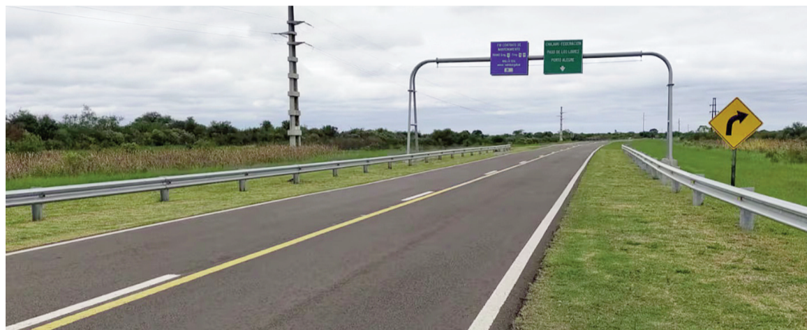
Uno de los objetivos del Ejecutivo es reducir costos para el sector productivo.

más de 700 kilómetros que forman parte del corredor del Mercosur, el cual facilita el comercio y la integración regional con Brasil y Uruguay y, además, conecta pasos fronterizos estratégicos e incluye el Puente Rosario-Victoria sobre el río Paraná, en cercanía con accesos a puertos y centros productivos del Gran Rosario, lo que potenciará las exportaciones y el desarrollo logístico.