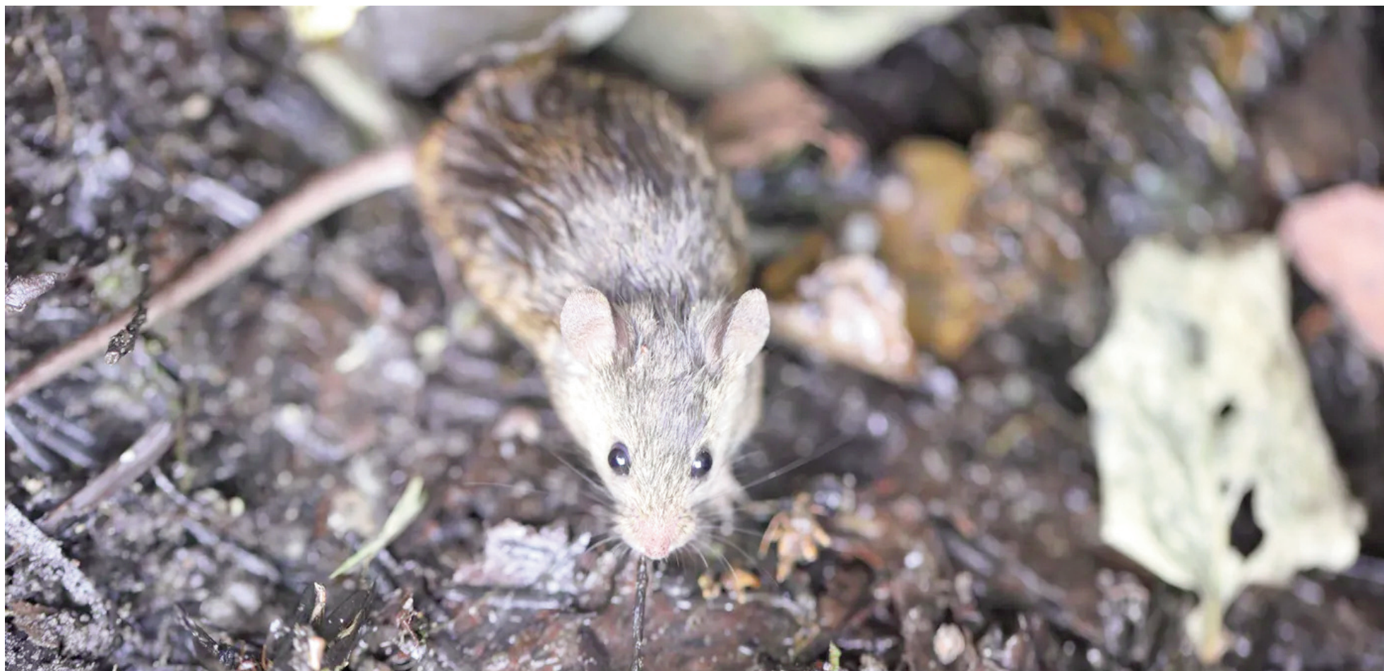
El hantavirus se transmite principalmente por la inhalación de partículas presentes en la orina, la saliva o las heces de roedores silvestres infectados. ILUSTRACIÓN