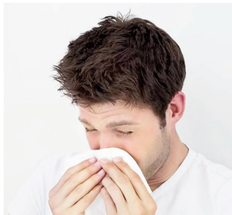
La gripe H3N2 afecta a varias personas.

Hay pacientes afectados en Buenos Aires, Santa Cruz, Ciudad de Buenos Aires, Neuquén y Mendoza.