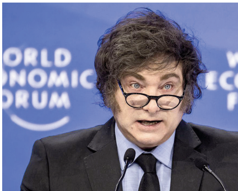
Presidente Javier Milei.

La operación militar ordenada por Donald Trump para sacar a Nicolás Maduro de Venezuela también estará plasmada en la alocución del mandatario, cuyo alineamiento con la Casa Blanca es total. "Fue un operativo quirúrgico, exitoso y eficiente", di-