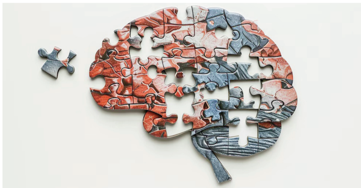
La prueba, validada por científicos de Europa y Estados Unidos, utiliza una gota de sangre extraída en el hogar y enviada por correo.

El método consiste en que la persona se realiza una autopunción en la yema del dedo en su domicilio para obtener una gota de sangre, luego debe secarla sobre un soporte especial y la remite directamente por envío postal al laboratorio correspondiente. No requiere la asistencia de personal sanitario ni condiciones estrictas de temperatura,