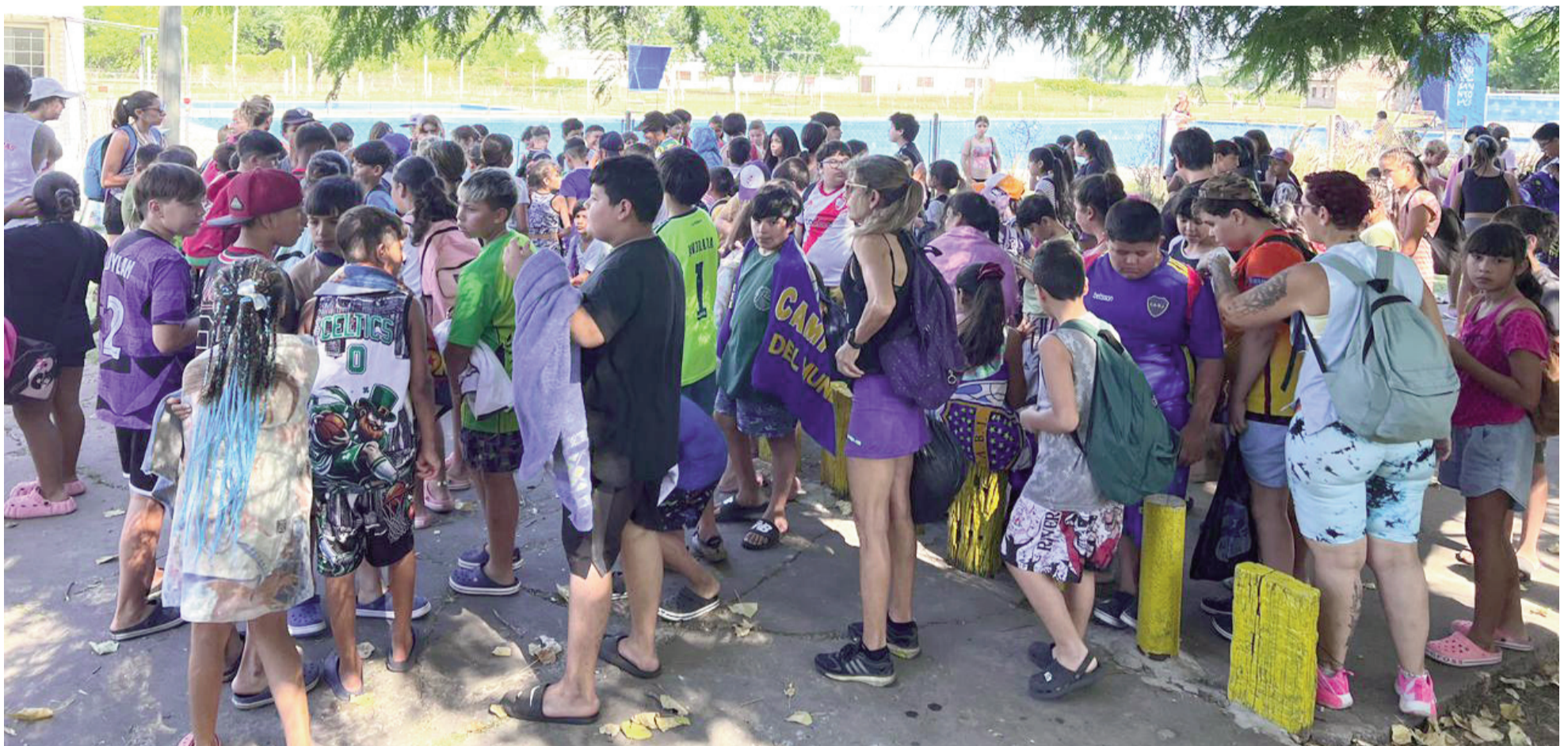
A lo largo de este mes, las y los participantes podrán disfrutar de actividades recreativas, deportivas, artísticas y acuáticas en el programa Escuelas Abiertas en Verano.

Más de 600 niñas, niños y adolescentes nicoleños en edad escolar, y unos 220.000 en toda la provincia de Buenos Aires, disfrutaron de una nueva edición de Escuelas Abiertas en Verano. Ayer fue el primer día de pileta en los cuatro predios designados en nuestro distrito: Asimra, Cedyc, La Emilia y el camping de Gral. Rojo. Allí asistirán los días martes y viernes para desarrollar las actividades acuáticas, deportivas y artísticas al aire libre.