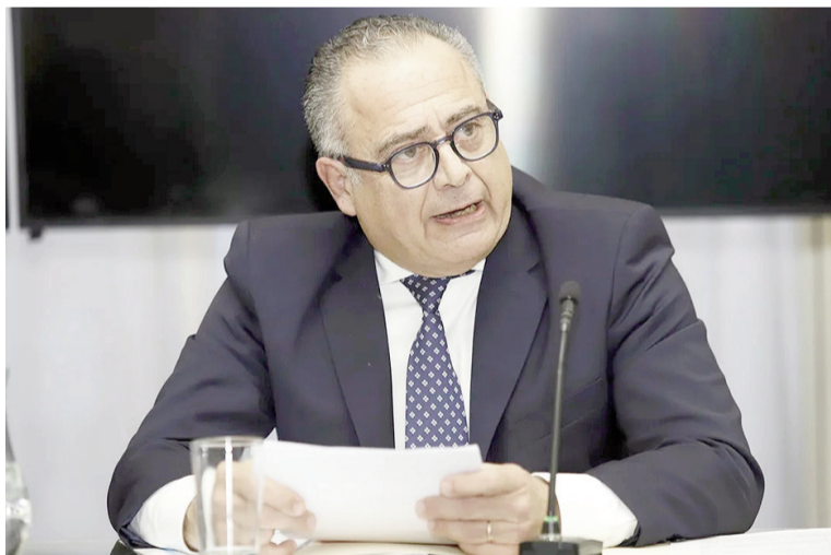
Embajador Carlos Cherniak.

Cherniak dijo que espera que los acontecimientos recientes "representen un avance decisivo contra el narcoterrorismo que afecta a la región" y que "abran una etapa que permita al pueblo venezolano recuperar plenamente la democracia, el imperio de la ley y el respeto de los derechos humanos, poniendo fin a la opresión ejercida durante años por el régimen autoritario que hundió a su pueblo en la pobreza y obligó a ocho millones de venezolanos a escapar de su país".