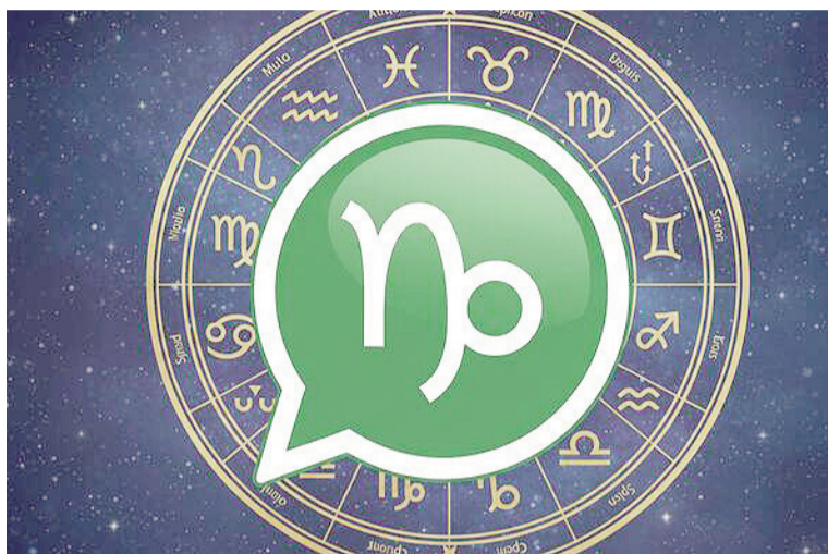
Así se ve el “modo Capricornio” en WhatsApp.

Como su nombre lo indica, este sistema pertenece al género conocido como launchers (o “lanzadores”, en español), los cuales permiten cambiar la interfaz principal del teléfono y personalizar distintos aspectos como los estilos de letra, fondos de pantalla, widgets y logotipos de los íconos. De