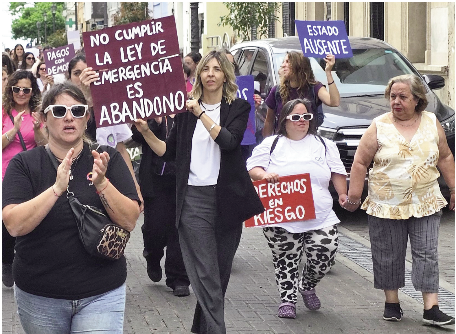
En San Nicolás se replicaron varias marchas convocadas en el marco de protestas federales por reclamos vinculados a la discapacidad.

Sánchez precisó: "Las familias nos encontramos en una situación de incertidumbre. Hay muchos profesionales que siguen trabajando aun en estas condiciones de demora en los pagos, pero otros han desistido y ya no trabajan con algunas obras sociales. Especialmente se da esta situación con IOMA, que es la prestación que más utilizan las personas con discapacidad que tienen pensión provincial. Se trata de la población más vulnerable, de quienes no tienen empleo formal; por eso, acceden a una pensión provincial para tener la cobertura del IPS. Hay muchos padres de niños y adolescentes que están recorriendo, buscando lugares para que les brinden las terapias, ya que, desde el año pasado, algunos centros donde ellos concurrían no trabajan más con IOMA. Es muy difícil conseguir tanto terapeutas como acompañantes. Esto genera no solo incertidumbre, sino también angustia en los cuidadores, porque sus hijos no puedan acceder a las terapias que más necesitan. Además, tienen