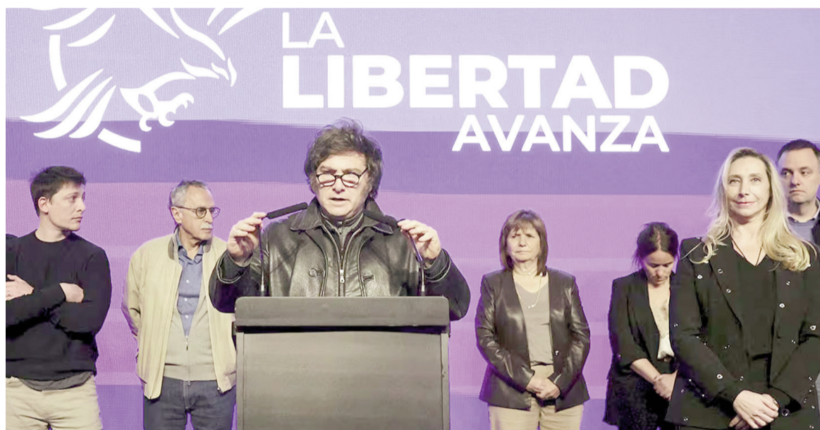
El Gobierno vuelve a activar la mesa política para lograr la aprobación de la reforma laboral.

Por su parte, Patricia Bullrich busca respaldos en el Senado y escucha las distintas propuestas que expresan los bloques aliados y opositores.