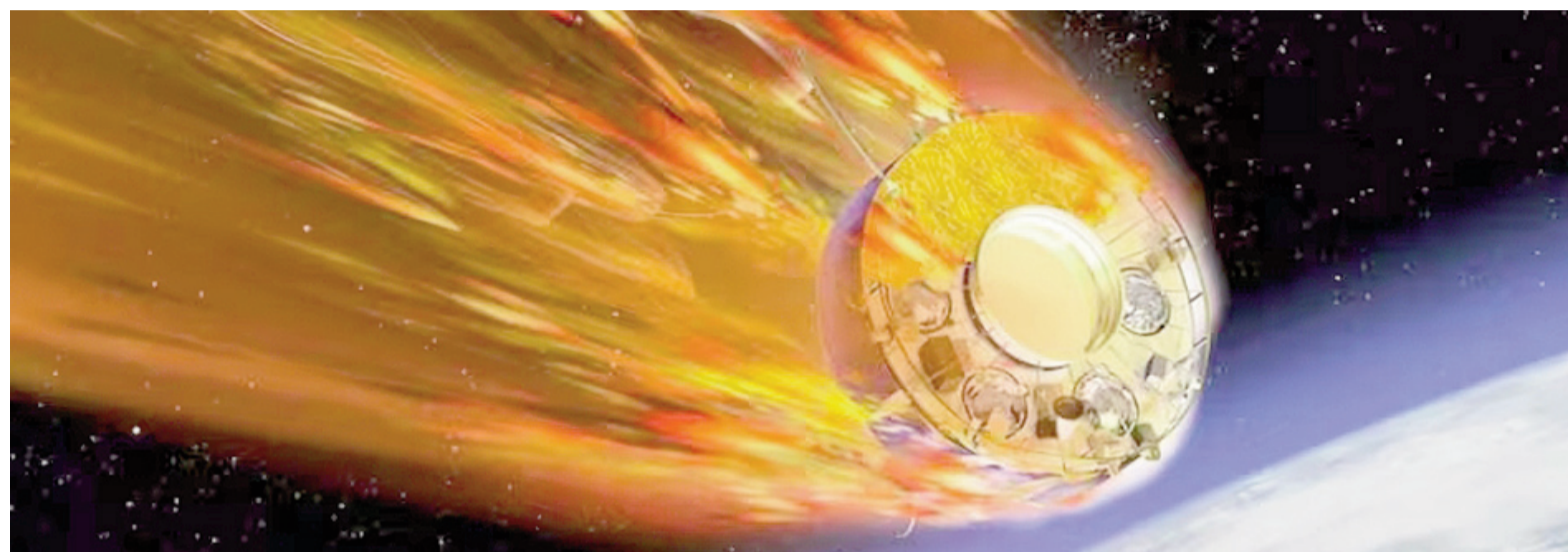
Hay preocupación por la trayectoria del Kosmos 482.

El Kosmos 482, lanzado en 1972 con destino a Venus, se precipita tras más de 50 años en órbita. Su trayectoria es incierta y podría causar daños materiales o personales, aunque la probabilidad es baja.