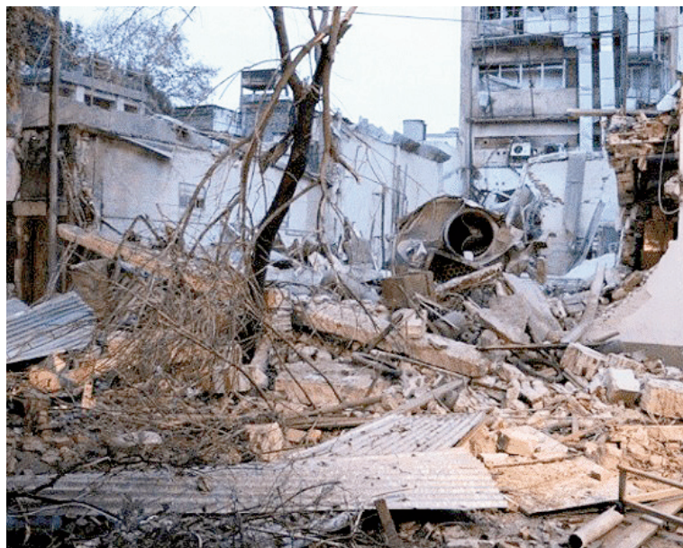
En julio de 2016, la caldera del laboratorio rosarino ubicado en Alem al 2900 sufrió una explosión por "acumulación de vapor".

El 15 de mayo de 2025, Laboratorios Ramallo fue allanado en el marco de la investigación de la causa penal por el centenar de muertes presuntamente provocadas por el fentanilo contaminado que allí se fabricaba. Dos días antes, la Anmat había inhibido las actividades productivas de la empresa radicada en Comirsa, clausurada desde entonces.