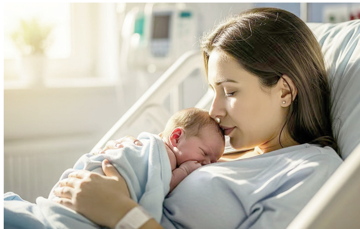
La inmunización materna busca reducir las hospitalizaciones por bronquiolitis y neumonía en bebés menores de un año.

El Ministerio de Salud anunció el inicio de la estrategia de inmunización.