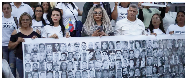
Continúan con las viglias para pedir la liberación de los presos políticos.

La declaración de la ONU se conoció el mismo día en que organizaciones de derechos humanos y el propio Gobierno venezolano difundieron cifras dispares sobre el proceso de excarcelaciones. El Mi-