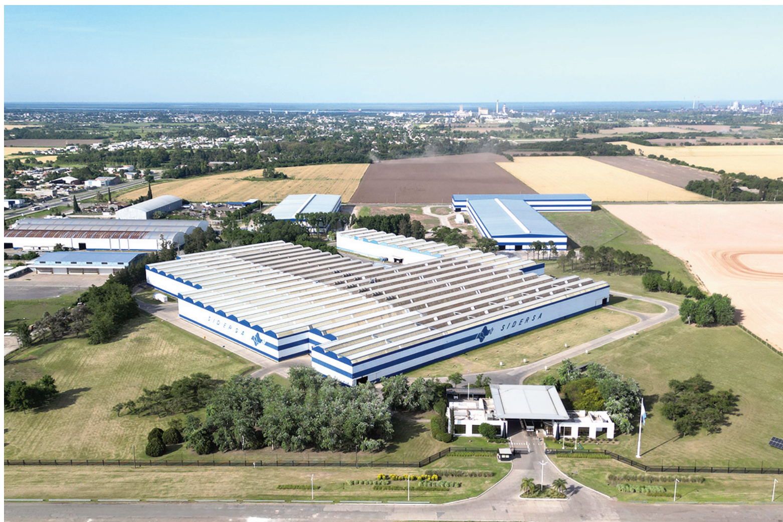
Emplea de manera directa a 650 personas y abastece a más de 2000 clientes desde su complejo industrial en San Nicolás.

tecer al mercado argentino con insumos estratégicos, como acero para la construcción y alambrón, con una capacidad de producción de 360.000 toneladas anuales, fortaleciendo las cadenas productivas locales y promoviendo la sustitución de importaciones. Se trata de la primera siderurgia integrada que se construirá desde cero en la Argentina en más de 50 años.