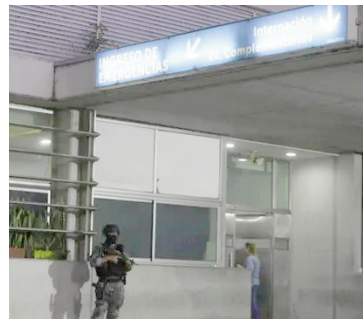
El joven murió en el HECA.

Según los primeros datos oficiales, pasadas las 22 se registraron varios llamados al sistema de emergencias que advertían sobre la presencia de una persona herida debajo del puente del sector. Personal policial y médico acudió al lugar y trasladó a la víctima de urgencia al Hospital de Emergencias Clemente Álvarez (HECA), donde falleció a poco de ingresar como con-