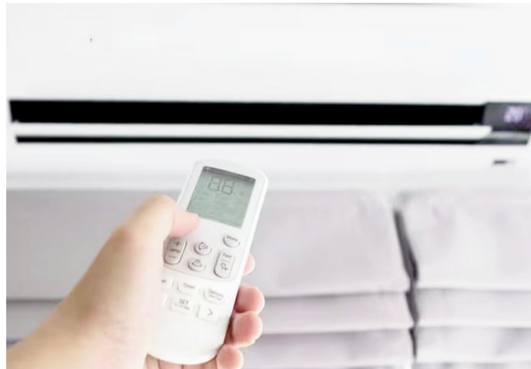
El ajuste clave del aire acondicionado para los días de temperaturas extremas.