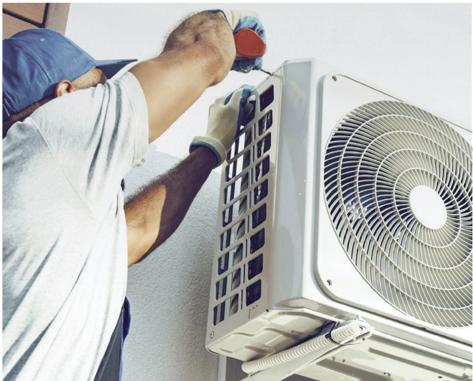
Los equipos más pequeños pueden conseguirse por poco más de $600.000, mientras que la instalación puede costar $120.000. ILUSTRACIÓN

Los materiales básicos de una instalación incluyen caños de cobre para la conexión entre la unidad interior y exterior, cables eléctricos, manguera de desagüe, aislantes y ménsulas para sostener el equipo