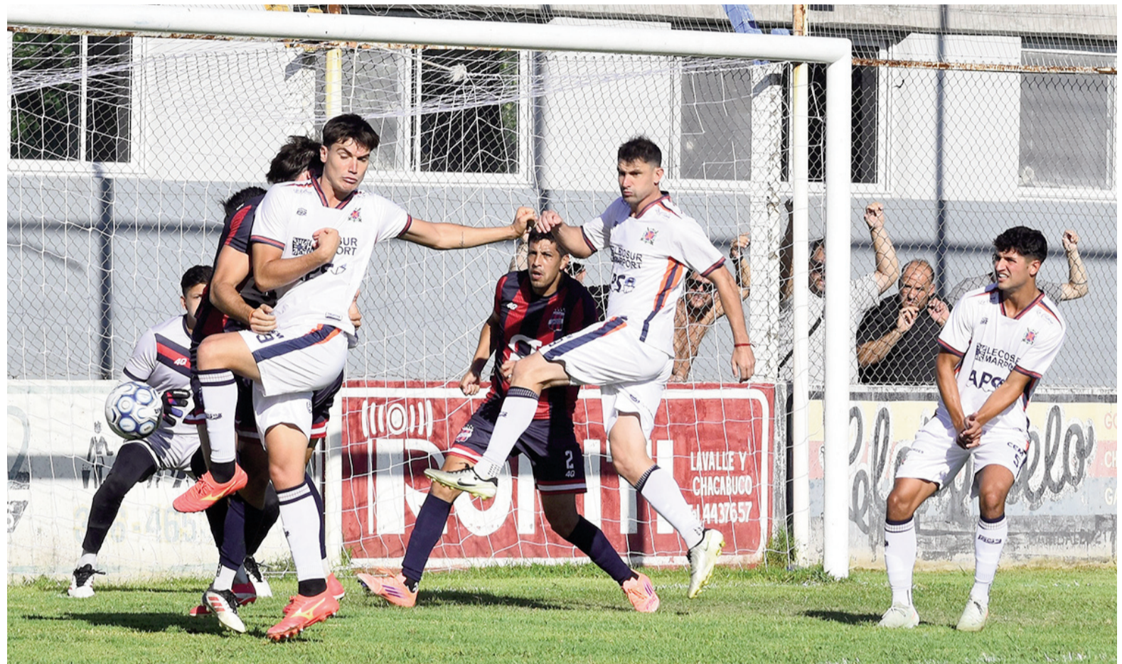
El Náutico cumplió una floja actuación y perdió en la ida.

El equipo de La Ribera cayó por 2 a 1 ante Unidos de Olmos en su cancha de barrio Prado Español por los cuartos de final de la Región Pampeana Norte y deberá dar vuelta la serie como visitante.