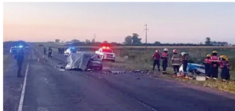
El siniestro fatal se produjo en Gualeguaychú.

El hecho ocurrió durante la madrugada de este domingo. Entre las víctimas fatales hay un joven de 18 años y dos mujeres. Identificaron a las víctimas.