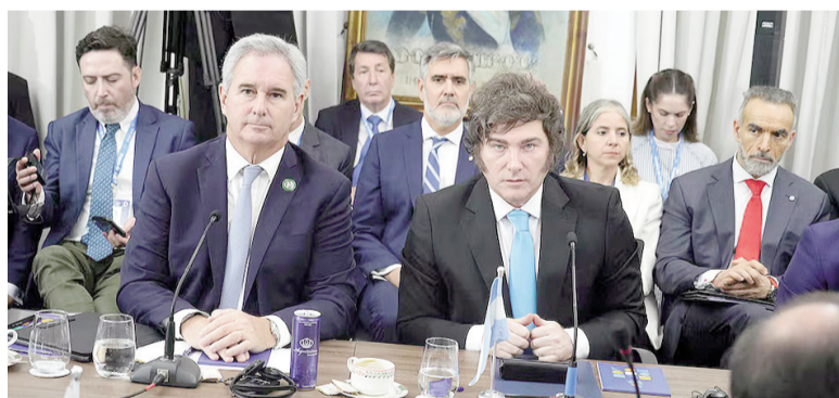
Milei y el canciller Pablo Quirno, en la última reunión del Mercosur.

La reunión de urgencia de la Comunidad de Estados Latinoamericanos y Caribeños (CELAC) convocada por el presidente pro tempore, el primer mandatario colombiano, Gustavo Petro, terminó este domingo sin una declaración conjunta de condena al arresto por parte de Estados Unidos del exdictador venezolano Nicolás Maduro, tras el rechazo de Argentina y otros nueve países.