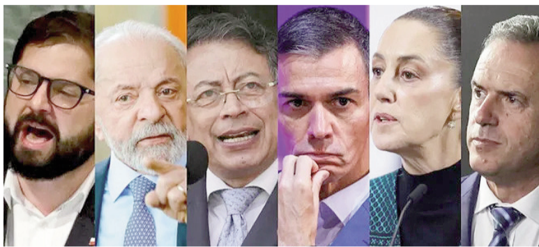
Seis países advierten sobre violaciones a la soberanía venezolana.

Los gobiernos de Uruguay, Brasil, Chile, Colombia, México y España firmaron una declaración conjunta tras el ataque en Venezuela y la captura de Nicolás Maduro por parte de Estados Unidos. Los países señalaron su "profunda preocupación y rechazo frente a las acciones militares ejecutadas unilateralmente en territorio de Venezuela, las cuales contravienen principios fundamentales del derecho internacional, en particular la prohibición del uso y la amenaza de la fuerza, el respeto a la soberanía y a la integridad territorial de los Estados, consagrados en la Carta de las Naciones Unidas".