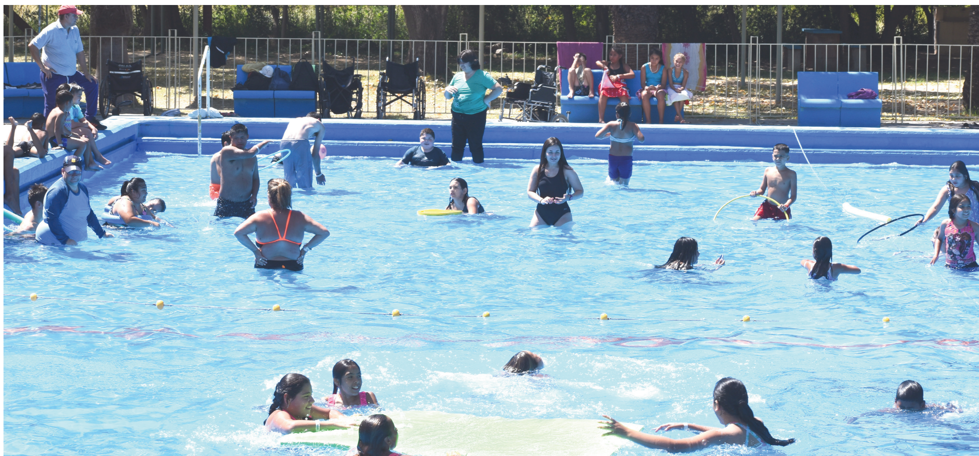
Las actividades de las Escuelas Abiertas en Verano se desarrollarán desde la presente jornada de 8 a 12 horas y se extenderán hasta el 30 de enero.

Desde este lunes, chicos y chicas en edad escolar de nuestro distrito iniciarán las actividades en el marco del programa bonaerense que impulsa la Dirección General de Cultura y Educación durante el verano. La propuesta, que se extenderá hasta el 30 de enero, cuenta en esta edición con cuatro predios con pileta: Asimra, La Emilia, Cedyc y el camping de Gral. Rojo. Habrá transporte para acceder los días martes y viernes, aunque los organizadores aclararon que “los días de pileta varían en función de las sedes”.