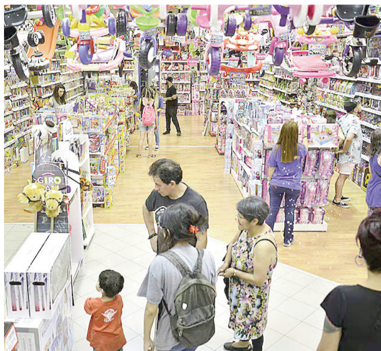
Comercios físicos y plataformas online concentran la mayor parte de las compras para esta celebración.

En ese sentido, los datos muestran que en la temporada actual se de-