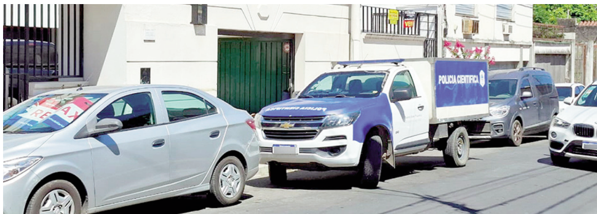
Efectivos de la Policía Científica trabajan en la vivienda de Sarmiento al 200, donde fue hallado el cuerpo de la mujer.

En la misma línea, un efectivo policial indicó a este medio que las pericias establecieron que el incendio fue accidental y se originó por una vela.